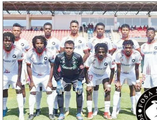
Ekipan'ny Fosa Juniors Fc Boeny.