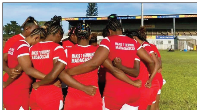
Ladies Makis 7s 2023.

Nandresy indray mandeha an'i Mexique tamin'isa 26 noho 7, ny ekipampirenena Malagasy Makis Ladies 7s, nandritra ny lalao nataony tao amin'ny kianja "Markötter Stadium, Stellenbosch, South Africa", tamin'ny alakamisy 20 aprily 2023 lasa teo, nefa dia faharesena intelo miantoana no azony avy eo, nandritra ny lalao faharoa sy fahatelo ary tamin'ny lalao 1/4-dalana tamin'ity fifaninanana ity. Voka-dalao azon'ny Makis