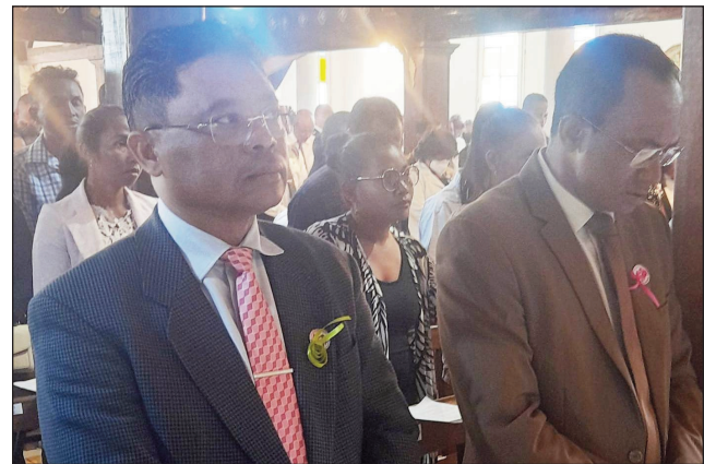
Ny fotoam-pivavahana nanombohana, ny fankalazana ny faha-25 taonan'ny Lycee Ambohitrimanjaka.