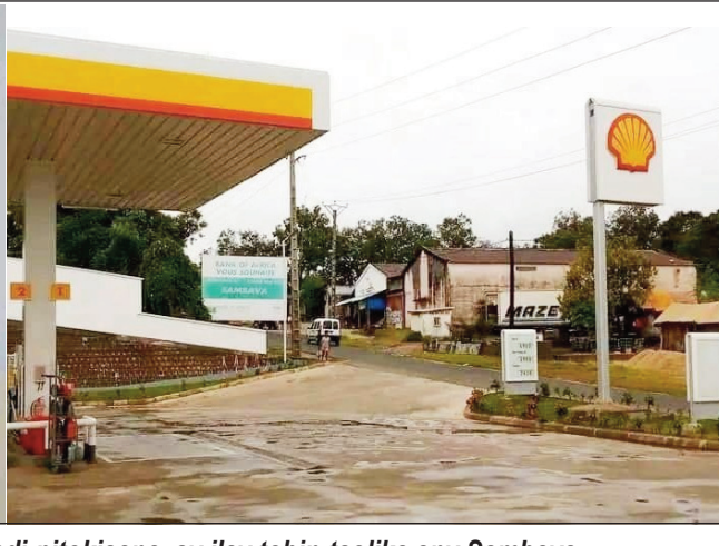
Ilay tovolahy nivadi-pitokisana, sy ilay tobin-tsolika any Sambava.

anisan'ny natokisan'ny anefa ity tovolahy nahasana ity. mpampiasa azy indrindra vanon-doza, nivadi-pitokisana ity.