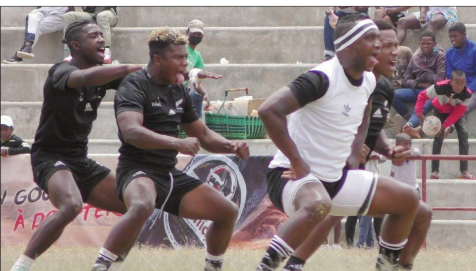
Rugby Tfma Ankasina.

Hitohy amin'ny alahady 05 martsa 2023 ho avy izao ny andro voalohany, amin'ny fifaninanana rugby fiadiana ny ho tompondakan'i Madagasikara "Elite Nationale XXL Energy Top 20", ka handrasan'ny maro sady hisongadina amin'izany ny lalaon'i Pilokely sy "Flèche noire", izay mamarana ny hetsika. Fandaharan-dalao amin'izany : 09:00-3Fai Ambalavao # Uskar Commune, 11:00-Stm Savonnerie # XV Avenir Andohatpenaka, 13:00- Uasc Cheminot # Mang' Art Manjakaray, 15:00-Tfa Anatihazo # Tfma Ankasina.