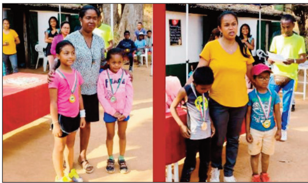
Ankizy mpilalao tenisy eny Marovatana.

Taorian'ny natrehan'ireo mpilalao tenisy lahy sy vavy ao amin'ny seksiôna ny tenisy eny Marovatana, ny fifaninanana « Championnat de Section Marovatana Toutes Catégories » ho an'ny sokajy « Vétérans Dames + de 35 ans », ny « Vétérans Hommes + de 55 ans », ny « 3è série Hommes », ny « 2è série Hommes » ary ny « 1ère série Hommes », teny amin'ny Club du Car Ivato tamin'ny 11 ka hatramin'ny 26 febroary 2023 lasa teo,