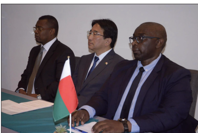
Ny filohan'ny Uaj (ankavia) sy ny Masoivon'i Japon ary ny filohan'ny Fmj.

Hahazo lelavola mitentina 66.019 euros (258 tapitrisa ariary) avy amin'ny fanjakana japoney ny taranja Judo Malagasy, ho-entina hampitaovana ny Dojo Nasiônaly, izay hatsangana tsy ho ela eto Antananarivo. Notanterahina tamin'ny talata 28 febroary teo, teny amin'ny Hôtel du Louvre Antaninarenina, ny fanaovan-tsonia ny fifanekena fanomezana « Projet d'acquisition des équipements », ho an'ny tetikasan'ny Federasiona Malagasin'ny Judo. Ny fanjakana japoney no hamatsy an'ity vola ity, izay hampitaovana « tatamis et matériels de qualité pour la préparation physique » ny Dojo Nasiônaly hatsangana. Mari-