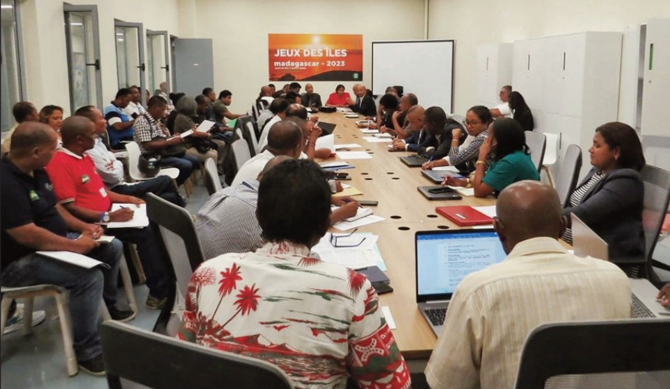
Mpivory teny Mahamasina.