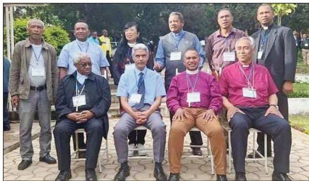
Ny FFKM, teny amin'ny FOFIKRI ilafy Antananarivo Avaradrano omaly.

Nifarana omaly ny fihaonamben'ny FFKM : Fiombonan'ny Fiangonana Kristiana eto Madagasikara, naharitra hateloana teny amin'ny FOFIKRI ilafy. Ny tenin'ny soratra masina ao amin'ny Jeremia 1/10 DIEM : « Jereo fa omeko fahefana ianao anio amin'ireo firenena sy fanjakana mba hanongotra sy hanjera, hanapotika sy handrava ary hanorina sy hamboly indray », no loha-hevitry'izao fihaonambe izao. Nisy ny fanambarana iombonana natao tamin'ny fiakaran'ny fivoriana omaly : nanambara ny FFKM fa tokony handray andraikitra arak'izay tandrify azy ny tsirairay eto amin'ny firenena. Miantso ny vahoaka malagasy manontolo izy ireo : tsy ny vahoaka ao anatin'ny FFKM ihany, tsy ny vahoaka kristiana ihany, fa ny vahoaka malagasy tsy vaky volo, mba ho olom-pirenena vanona sy tomponandraikitra. Adidintsika hoy ny fanambarana ny mijoro fa firenentsika ity, dia isika no sarotiny amin'ny zotram-pifidianana izay atao. Misorata anarana amin'ny lisi-pifidianana, hamarino ny anaranao amin'ny lisi-pifidianana ary rehefa tonga ny fifidianana, mandraisa anjara ianao. Mirosaha ianao han-