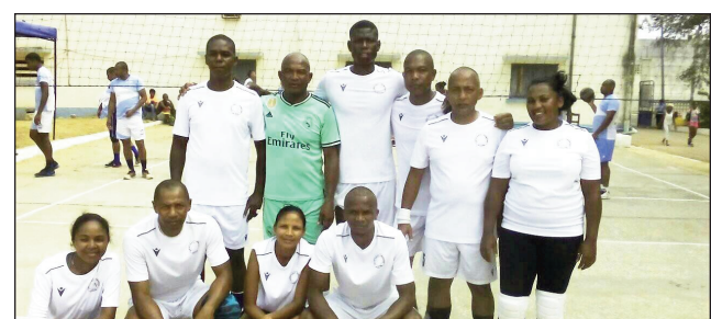
Volley ball Asief.