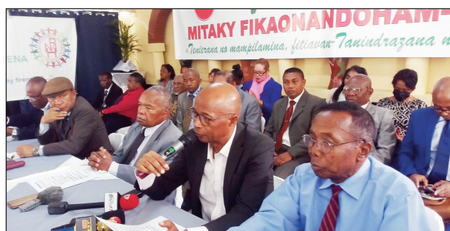
Ireo avy amin'ny G5, nitafa tamin'ny mpanao gazety tetsy Anosy.

Nitafa tamin'ny mpanao gazety ny vondron'ny mpanohitra G5, tao amin'ny Motel d'Antananarivo Anosy omaly, mikasika ny raharaha-pirenena, satria araka ny nambaran'izy ireo dia masimandidy sy tompon'ny fahefana eto amin'ny firenena ny vahoaka. Tsy maintsy tanterahina amin'ity taona ity ny fifidianana ho filohampirenena ho fanajana ny lalampanorenana. Mialoha izany anefa dia tsy maintsy tanterahina ny fikaonandohampirenena handrasan'ny rehetra anjara, handinihana sy hitadiavam-bahaolana amin'ireto teboka