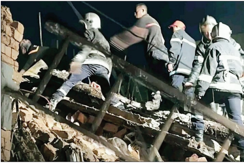
Ilay trano nirodana tetsy Behoririka.

Namono olona 5 ny trano nirodana iray tetsy Behoririka. Trano iray tetsy Behoririka ambadiky ny BFV, no nirodana tamin'ny 3 ora sasany maraina vokatra ny rotsak'orana omaly. Efa nisy ny olona voavonjin'ny mpamonjy voina ary mbola mitohy ny fijerena izay mbola tototra. Hatreto 5 no namoy ny ainy tototry ny tany, 9 kosa no avotra soa amantsara. Trano biriky misy rihana roa ity nihotsaka ity taorian'ny orambe niseho omaly alina. Olona 9 no avotra soa amantsara ary nalefa tsaboina eny amin'ny HJRA, araka ny vaovao avy amin'ny sampama mpamonjy voina. Noho izay voina izay, tonga teny an-toerana nijery izany ny depieten'ny Boriboritany faha-3 avy amin'ny antoko TIM,