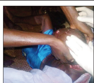
Ilay raim-pianakaviana nisy nanapaka ny lohany.

min'ity fiandohan'ity herinandro ity dia efa nandefa feo koa ireo dahalo, fa ho avy ka manao antso avo ireo mponina ny mba hijerena azy ireo, satria na dia misy mpitandro filaminana aza ao an-toerana dia sady vitsy no tsy ampy fitaovana ihany koa, ka sahirana rehefa misy hazo lava ; raha ny tapany atsimon'ny sy atsinanan'ny distrikan'i Mahabo indray dia rehefa tsy miady amin'ny dahalo dia miady amin'ny valala, satria dia mirongatra ny valala eo anelanelan'i Mahabo sy Mandabe iny ary efa manomboka manarona an'i Mandabe. Etsy ankilany, mbola ao Mandabe ihany dia ahiana ny hisian'ny ady antrano satria dia maro amin'ireo dahalo niova fo no miverina manao ny asa ratsy sy herisetra fanaony nohon'ny disadisa izay nitranga, noho ny nahafaty ny lebehin'ny kalaony iray dia lasa