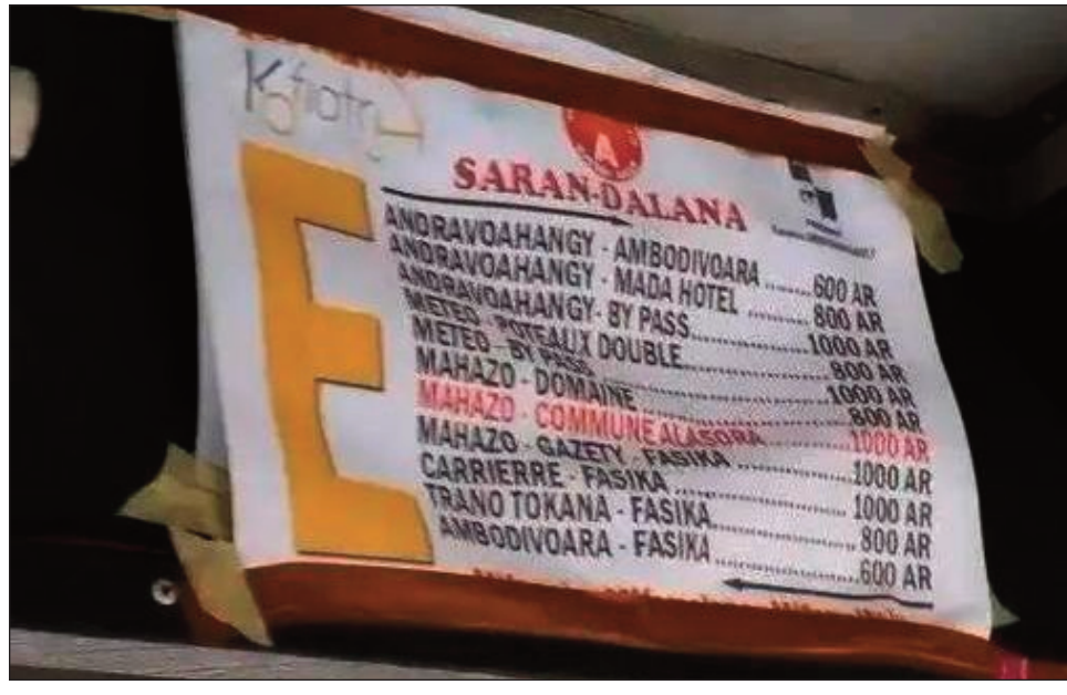
Ireo saran-dalana amin'ny taksibe zotra E.

Misy efa tafakatra hatramin'ny 1000 Ar amin'izao fotoana ny saran-dalan'ireo taksibe miasa manodidina ny renivohitra. Toy izany ny zotra E. Ny saran-dalan'ny zotra E, efa misy mahatratra hatrany amin'ny 1000 Ar, ny akaikikaiky kosa anefa dia latsak'izay arivo ariary izay. Ho an'ity zotra ity, eo anelanelan'ny 600 Ar ka hatramin'ny 1000 Ar izany, marina fa somary misy lavitra ihany ny lalana alehan'izy ireo, nefa na izany aza efa tsy ho takatry ny mpanjifa intsony ny 1000 Ar na 800 Ar saran-dalana izany. Tokony ho jeren'ny tompon'andraikitra akaiky ihany ny mahakasika an'izay fidangana saran-dalana izay. Marina fa miraikitra ny fifamoivoizana amin'izao fotoana