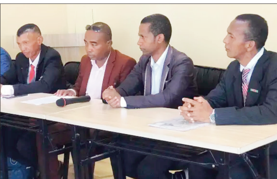
Mpitantana ny FMBFS ankehitriny.