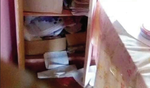
Ny fahavakisan'ny EPP Masombahiny Ambohimalaza Miray.

Trangana halatra sy tsy fandriampahalemana ao amin'ny EPP Masombahiny, kaominina Ambohimalaza distrikan'Antananarivo Avaradrano, nisy namaky fanintelony izany sekoly ambaratonga foto-trazany. Araka ny vaovao voaray, ny alin'ny talata 21 martsa nifoha omaly alarobia, no nitrangan'izany halatra tamina sekoly izany indray. Lasa tamin'izany ny boky izay entina mampita fahala-