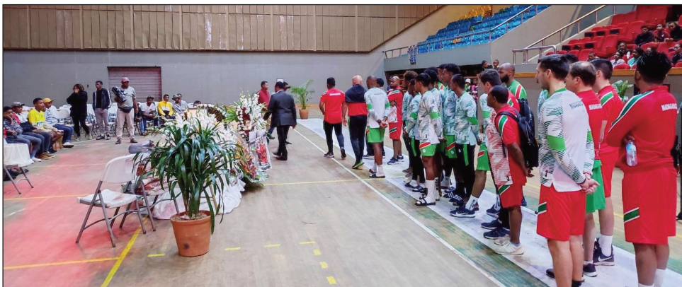
Mpilalao'ny Barea nandalo teny amin'ny Palais des Sports Mahamasina.

Tonga ilay andro nandrasana hikatrohan'ny ekipam-pirenena Malagasy amin'ny ekipam-pirenena'i Centrafrique, eo amin'ny fifanintsanana baolina kitra, hahazoana miatrika ny CAN Côte d'Ivoire 2023 andro faha-3, etsy amin'ny kianjan'i Mahamasina, anio alakamisy 23 martsa 2023. Azo lazaina fa tena hamaritra ny ho avin'ny Barea de Madagascar mi-hitsy ity lalao ity, eo amin'ny fiatrehana an'ity fifanintsanana ity, fa raha sanatria ka hisy ny faharesena ho azo indray anio dia "mampamangy any amin'ny ankizy, hoy ny fitenenana fa ny lehibe efa nihaona". Raha ny marina ihany koa dia anisan'ny