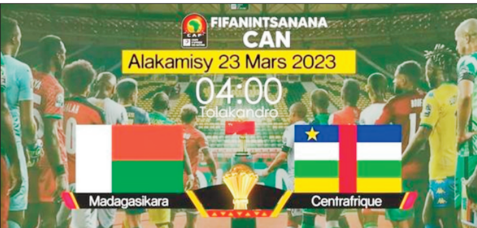
Barea Malagasy vs Les Fauves du Centrafrique.