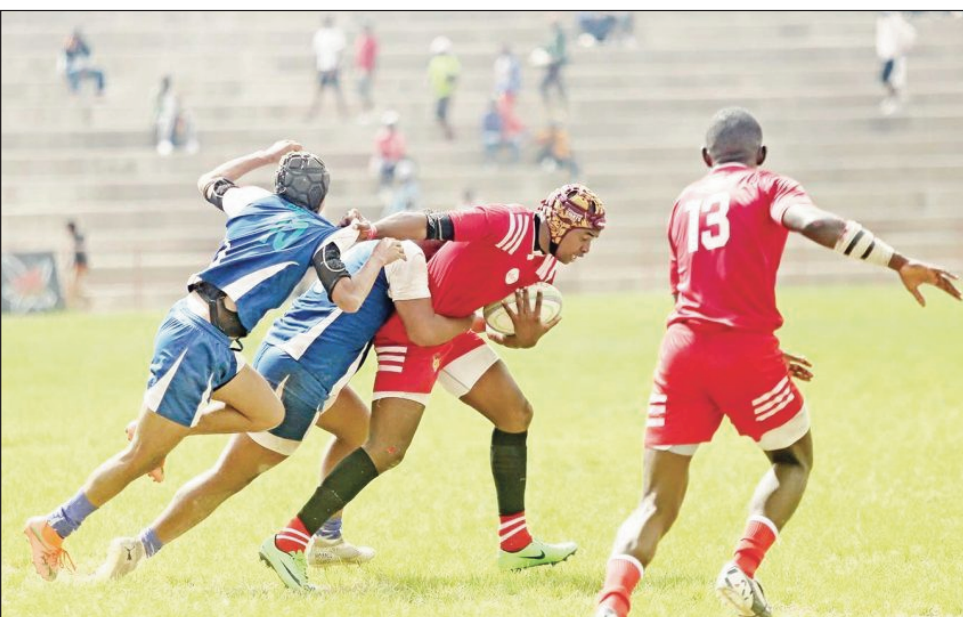
Lalao Rugby XXL Energy Top 20, 2023.

Mbola mitohy hatrany ny fiatrehana ny andro faha-2, amin'ny fifanintsanana rugby fiadiana ny "Championnat de Madagascar XXL Energy Top 20 2023", ka azo ambara fa hangotraka indray ny eny amin'ny kianja Makis Andohatapenaka amin'ny alahady 26 martsa 2023 ho avy izao, izay hanatontosana an'io tohin'ny andro faha-2 io. Fandaharandalao alahady 26 martsa 2023 : 09:00-Stm Savonnerie # Us Ikopa Andohatapenaka, 11:00-Tam Anosibe # XV Fa Ampasika, 13:00-Tfa Anatihazo # Fbm Bemasoandro, 15:00-3Fb Fahasalamana # Ftba Andohatapenaka.