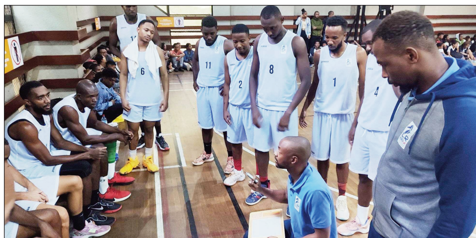
Ny ekipan'i Mayotte tetsy Mahamasina.

Rehefa nikatroka tamin'ny ekipa malagasin'ny Gnbcs tetsy amin'ny "petit palais des sports Mahamasina" tamin'ny talata 07 fe- broary 2023 teo ka resy tamin'ny isa 61-54 (QT1: 13-16, QT2: 16-10, QT3 : 13-14, QT4 : 19-14) ny ekipa voafantin'i Mayotte Basketball manao lalao tsapa ho fanomanan-tena ataon'izy ireo ho fanoma- nana ny lalaon'ny nosy 2023 dia anio alakamisy 09 febroary 2023 indray no hiatrika ny lalao faha- roa hataony amin'izao fandalovany eto Madaga- sikara izao ka hikatroka amin'ny ekipan'ny Cospn Malagasy, mbola ao