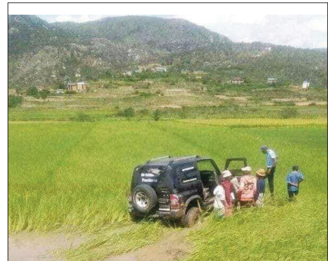
Fiarakodiana depiote, latsaka tany an-tanimbary.