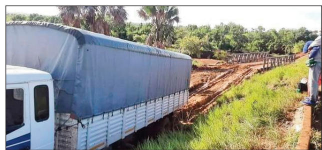
Kamiao tsy afaka noho ny faharatsian'ny lalana any amin'ny RN6.

Potika, tsy mbola vita amin'izao fotoana ny lalampirenena faha-6 (RN6) mandalo ny faritra Sofia, mihazo ny any avaraty ny Nosy iny. Noho izay antony izay, mikatso indray ny lalana amin'ny RN6 amin'izao fotoana izao, tavela ao amin'ny déviation, 60km tsy hiditra an'Antsohihy ny kamiao iray, ka tsy misy afaka mandeha ireo rehetra, na ny andaniny, na ny ankilany, izany hoe: tsy misy deviation azo atao.