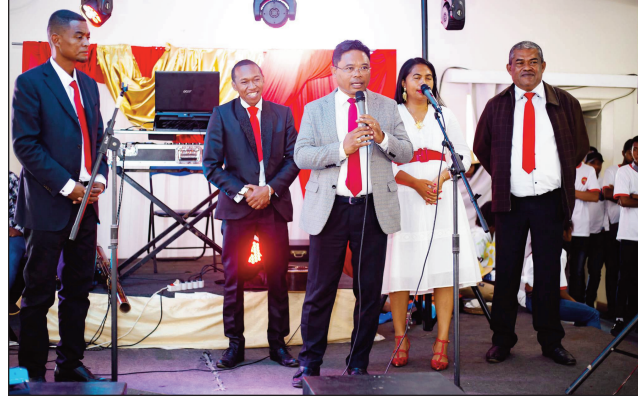
Ny fifampiarahabana tratry ny Asaramanitra teny Ivato ny alahady lasa teo.

Fahombiazana ny fihaonana voalohany tamin'ity taona ity, ho an'ny avy amin'ny antoko Tiako i Madagasikara Ivato, na TIM Ivato, tamin'ny fifampiarahabana tratry ny Asaramanitra nataon'izy ireo ny alahady teo tao amin'ny Espace Le Millennium Andradindravola. Noho izay antony izay, nisy ny fanambarana nataon'ny tompon'andraikitra ny antoko ao amin'ity kaominina ity."ankasitrahana feno ianareo rehetra nanotrona, nanohana ny antso, tamin'ny fifampiarahabana nahatratra ny taona vaovao 2023 ny antoko Tim Ivato ny Alahady 05 Febroary lasa Té. Mankasitraka an'Andria-