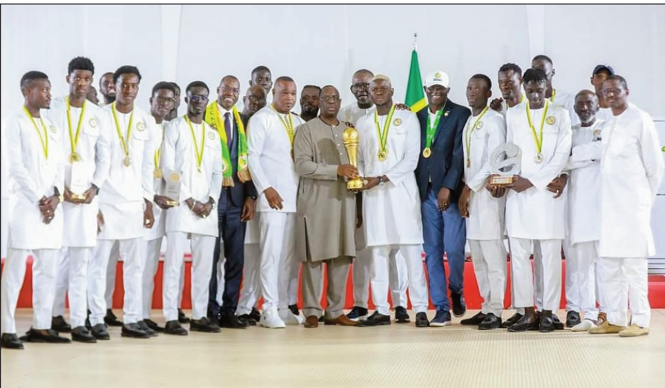
Ny « Lions de la Teranga du Sénégal », noraisin'ny filoha Macky Sall tao an-dapany.