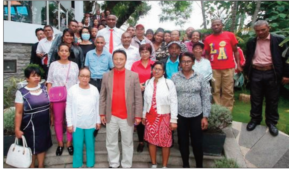
Ny avy amin'ny birao politikan'ny antoko TIM, teny amin'ny CENI Ivandry omaly.