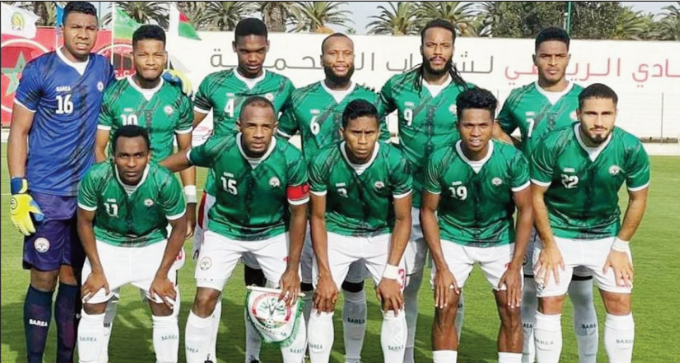
Barea de Madagascar farany tamin'ny 2022.