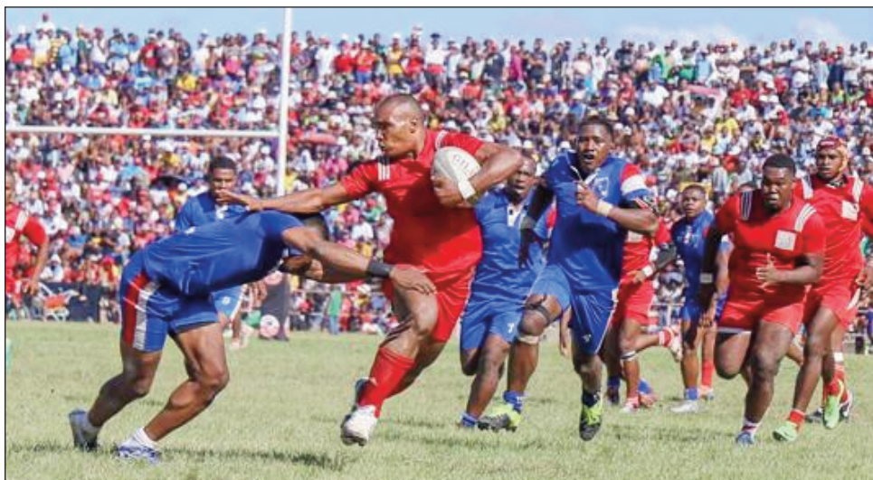
Fihaonan'ny Cosfa sy ny Ftm tamin'ny alahady teo.

Taorianan'ny andro fanokafana ny "Championnat Rugby XXL Energy Top 20", tamin'ny alahady 19 febroary 2023 teo, teny amin'ny kianja Makis Andohatapenaka dia raikitra fa ho tontosaina amin'ny alahady 26 febroary 2023 ho avy izao, ny andro voalohany amin'ity fifaninanana ity. Fantatra fa samy hiakatra kianja avokoa ny ekipan'ny Cosfa Miramila sy ny Ftm Manjakaray, izay nisehoana olana teo amin'ny Super Coupe, amin'io andro io. Fandaharan-dalao amin'io andro voalohany io : 09:00-Cosfa Miramila # Jsta Ambondrona, 11:00-Ukopa Andohata-