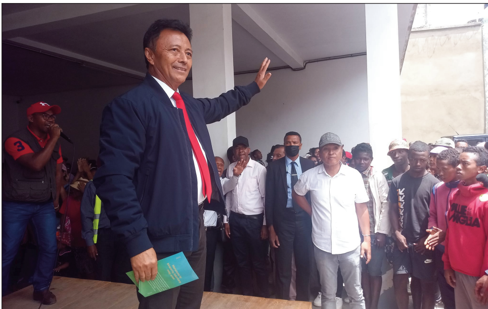
Ny filoha Marc Ravalomanana, teny Bel'Air omaly.