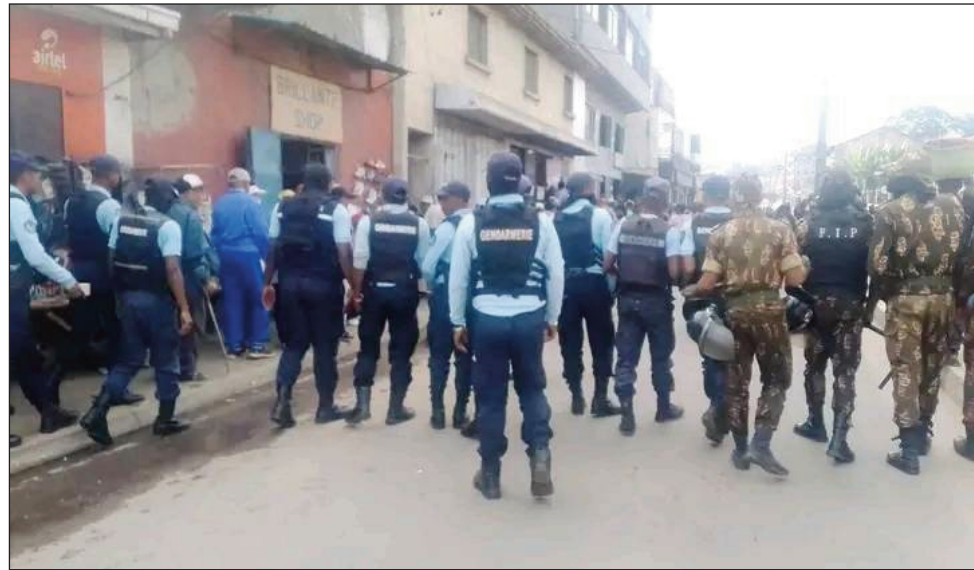
Noho izay antony izay, nirohotra nandeha an-tongotra, nihazo teny Bel'Air ny rehetra misy ny foiben'ny TIM ny rehetra, avy eny amin'ny Magro Behoririka.