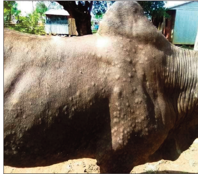
Omby marary any Antsiranana faha-2.