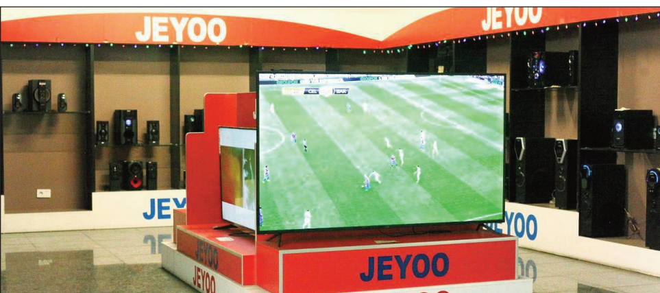
Entana, anisan'ny hita amin'ny Tranombarrotra Baolai.