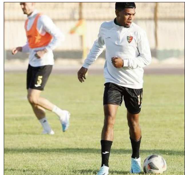
Rakool any Algerie.