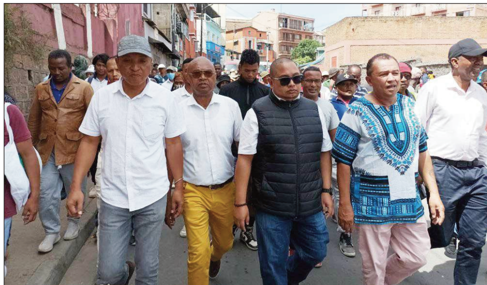
Vory lanona tao Bel'Air avy eo ny rehetra. Tonga tampoka tao, ny filoha Marc Ravalomanana.