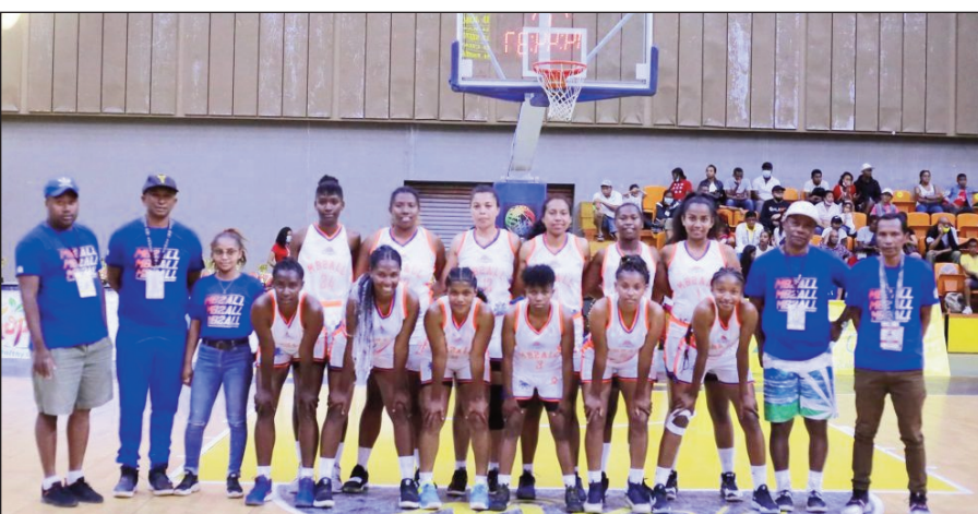
Basket-ball N1A Dame Malagasy.

Ho tontosaina any Antsirabe amin'ny 15 ka hatramin'ny 23 aprily 2023 ho avy izao, ny fifaninanana basikety « Championnat National N1A Dame 2023 » dingana savaranonando. Toy izao ireo Klioba handray anjara amin'izany : Vondrona A : Mb2All Analamanga, Cospn 2 Atsinanana, Tgbc Betsiboka, Sbbc Boeny, Jea Vakinankaratra, Phoenix Vakinankaratra. Vondrona B : Ankaratra Vakinankaratra, Tamifa Amoron'i Mania, Serasera Vakinankaratra, Ascute Atsinanana, Gnbc Analamanga, Fandrasa Matsiatra Ambony.