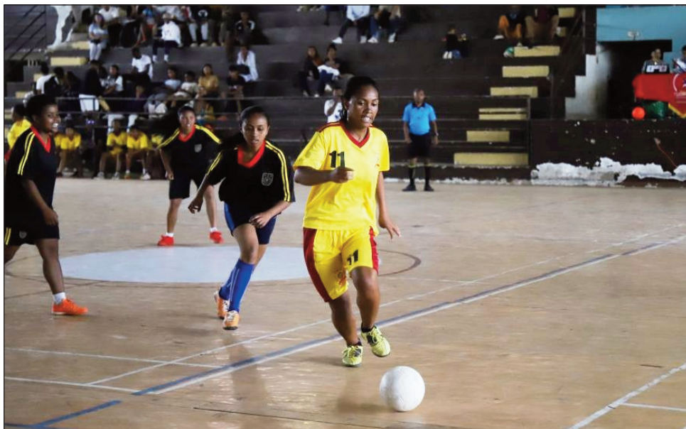
Lalao andro faha-2 teny amin'ny kianja mitafon'i Mahamasina.

Ho fantatra amin'ny andro faha-3 ho tontosaina etsy amin'ny kianja mitafon'i Mahamasina anio sabotsy 25 febroary 2023, ireo ekipa ho tafakatra amin'ny dingan'ny 1/4-dalana amin'ny fifaninanana baolina kitram-behivavy anaty trano "Tounoi Futsal Feminin Interuniversitaire" na ny TurnOver II, karakrain'ny UCM "Université Catholique de Madagascar". Marihana fa ireo ekipa tsara toerana indrindra aorian'io andro faha-3 io, no hiatrika an'izany dingan'ny 1/4-dalana izany. Fandaharan-dalao andro faha-3 : 12:30-Espa # Meff, 13:30-Aceem # Fsh Ucm, 14:15-Onifra # Istm, 15:00-Fss Ucm # lum, 15:45-Isps Leader # Fdsp, Fac Science #