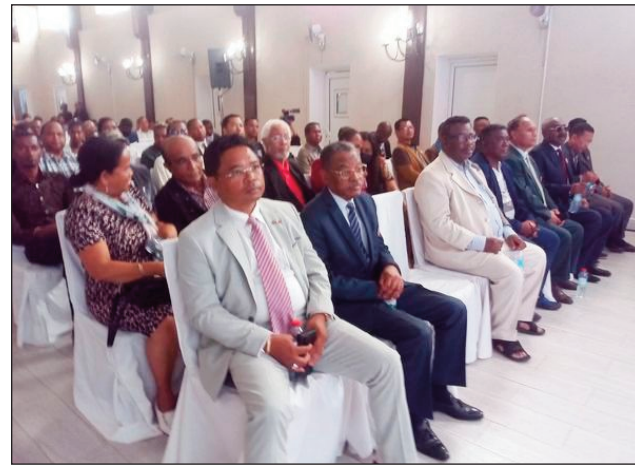
Ny fifampiarahabana tratry ny taonan'ny vondrona Panorama ny alakamisy lasa teo.

hetra hisoratra anarana amin'ny lisi-pifidianana ny fanafihana ihany koa hoy izy ny fifampiresahana sy ny fifampidihana mba hisan'ny ffidianana mangarahara sy eken'ny rehetra, amin'ny ffidianana filohampirenena amin'ny faran'ity