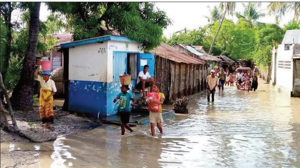
Tondraka ny rano any Morondava.

min'ny mpandrindram-paritry ny BNGRC. Hatreto dia tsy misy afatsy vary 350 kg sy voamaina 50kg no misy, fa vao miezaka mitady vahaolana ho an'ireo tra-doza ireo tompon'andraikitra, izay hita fa tena tompon'andraikitra tsy miamboho adidy ka miantso izay malala-tanana sy tsara sitrapo, mba hanolotra izay azony atolotra ho an'ireo traboina, satria dia mitazam-potsiny ireo tompon'andraikitra maro an'isa eto Morondava, nefa ny traboina tsy misy afa-tsy savony sy fitaovam-pidiovana avy amin'ny fitaleavam-paritry ny rano no mba natolotra azy ireo, nefa maro amin'ireo traboina no tsy misy sakafo, mitebiteby amin'ny tranony dibo-drano, misy ny fananany, izay tsy maintsy nialany noho ny rano be, nefa ireo mpanagalatra mitondra lakasamangalatra ny hasarany nandritra ny taona maro.