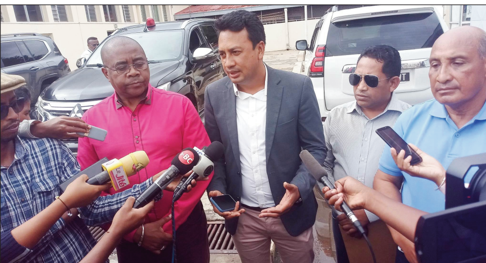
Ny avy amin'ny birao politikan'ny antoko TIM, teny amin'ny CENI Alarobia-Ivandry afak'omaly.

Manoloana ny fanakatsakanana ny hetsiky ny antoko politika misy amin'izao fotoana, indrindra ny hetsika fifampiarahabana tratry ny taona ataon'ny antoko TIM, sy ny hetsika