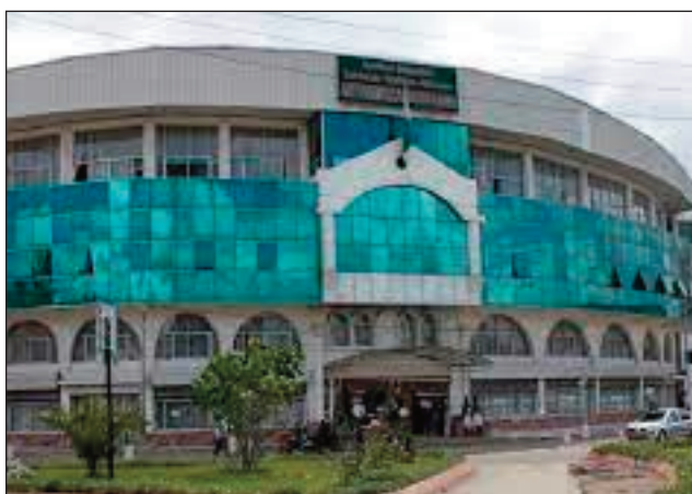
Ny lapan'ny loholon'i Madagasikara ,izay efa nambaran- dRajoelina fa ho foanana, nefa amin'izao mbola mandany ny volam-panjakana koa.

Hita sy tsapa tato ho ato, fa nalaza tokoa teo amin' ny sehatra ara-politika ny maha-olom-boafidy na olom-boatendry ny ma- nampahefana iray. Ny mpiara-monina dia ma- hatsapa, fa ireo izay voa- tendry hisahana andraiki- tra ambony hatrany no tena manimba ny fitanta- nana amin'ny ankapo- beny, hoditr'akondron- dRajoelina, toy ny laza ratsin'ny governora, ny fa- novana ny Praiminisitra sy ireo minisitra miaraka aminy, izay efa tsy tan- tin'ny maro tokoa, ka na ireo mpiara-mitolona ami- ny aza dia manenjika sy manaratsy avokoa. Vao voatendry ireo mpikam- bana vaovao ao amin'ny governemanta ohatra, dia ry Naivo Raholdina no mbola tsy afa-po, toy iza- ny koa ny depiote Rossy, izay efa naniry minisitra