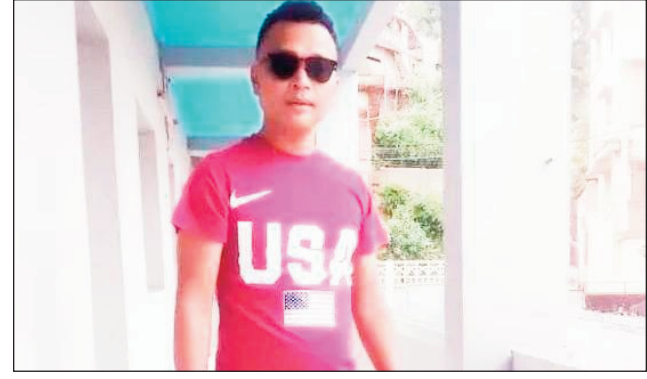
Jenner, mpanakanto feno ny tovolahy.