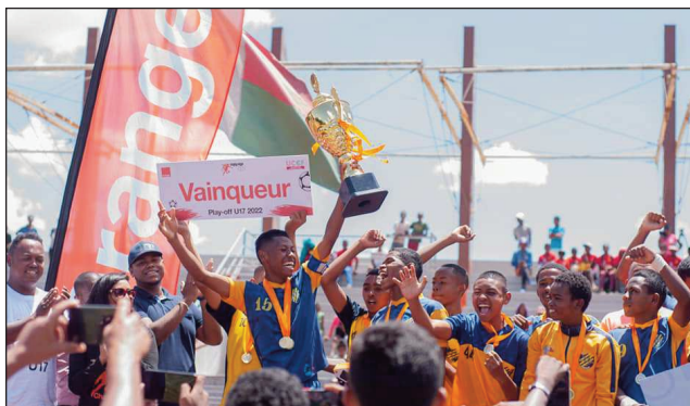
Ekipan'ny Academy Buffalo teny Alarobia.