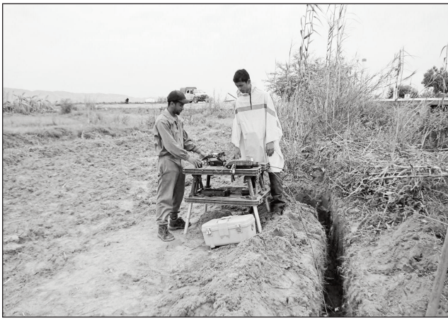
Teknisiana nandritra ny fandalovan'ny rivo-doza teto Madagasikara.

Manoana ny fandalovan'ny rivo-doza "Freddy" eto Madagasikara, ny orinasa Telma amin'ny maha mpiara-miombon'antoka ara-tantara sy ôfisialin'ny BNGRC « Birao Nasionaly misahana ny fitantana ny loza sy tandindon-doza », sy amin'ny maha mpandraharaha manana tambazotra-pifandraisan-davitra lehibe indrindra azy eto Madagasikara, dia mitondra ny fanohanana tsy tapaka ho an'ny Malagasy, sy ny tompon'andraikitra mahafa eo amin'ny fitantana mialoha sy mandritra ary aorian'ny fandalovan'ny rivo-doza. Teknisiana miisa 35 sy mpiasa « agents d'intervention » no vonona hihetsika avy hatrany amin'ny fitandroana ny tambazotra Telma : Akazobe, Antanana-rivo, Analavory, Ambatolampy, Ambositra, Belo Tsiribihina, Miandrivazo, Ikalamavony, Ambohima-