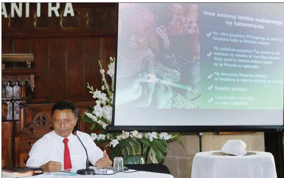
Ny filoha Marc Ravalomanana, tetsy amin'ny FJKM Tranovato Ambatonakanga.

Nizara traikefa tamin'ireo mpianatra mpi- ofana ho mpitan- drina, tetsy amin'ny Fakiol- te momba ny Teôlôjia tetsy Ambatonakanga ny filoha Marc Ravalomanana mivady ny talata lasa teo. Amin'ny maha-mpan- draharaha an'izy mivady ary amin'ny maha efa mpitantana azy ireo teo amin'ny sehatry ny fire- nena ihany koa, ny filoha Marc Ravalomanana, efa filohan'ny Repoblika, ary Neny Lalao Ravalomanana, efa ben'ny tanànan' Antananarivo. Loha-hevit- r'izany fifanakalozana trai- kefa sy fampiofanana iza- ny ny hoe: "ny fahantrana sy ny olona maharesy fa- hantrana." Nambaran'i Dada tao aorian'ny foto- ana, fa " faly aho, tena faly... nomen'Andriamanitra fotoana nahafahako nihaona sy nifampizara taminareo mpampianatra sy Mpianatra mpiomana ho mpi- tandrina, ny traikefa sy làlana nodiavina ary indrindra