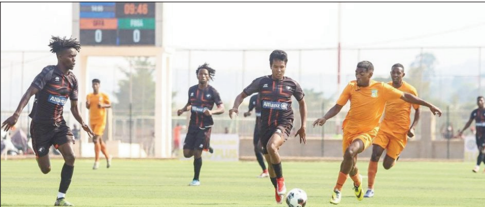
Lalao Orange Pro-League.