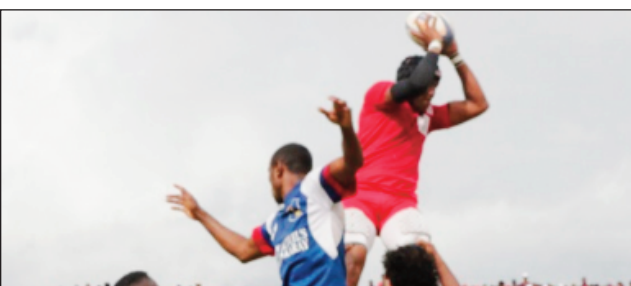
Ftm teny amin'ny Makis Andohatapenaka.

Hafana dia hafana ny fanombohan'ny fifaninanana rugby «Championnat de Rugby XXL Energy Top20, 2023 », eny amin'ny kianja Makis eny Andohatapenaka, rahampitso alahady 19 febroary 2023. Anisan'ireo ekipa hiakatra kianja amin'izany ny FTM Manjakaray, izay hifampitana amin'ny Cosfa Miamamila eo amin'ny hetsika « Super Coupe 2022 ». Ireo fandaharan-dalao feno : 09 :00- XV Avenir # Makis A, 11:00-Us Ikopa # Makis B, 13 :00-Tam Anosibe # Scb Besarety ("match test"), 15:00-Cosfa Miamamila # Ftm Manjakaray ("Super Coupe 2022").