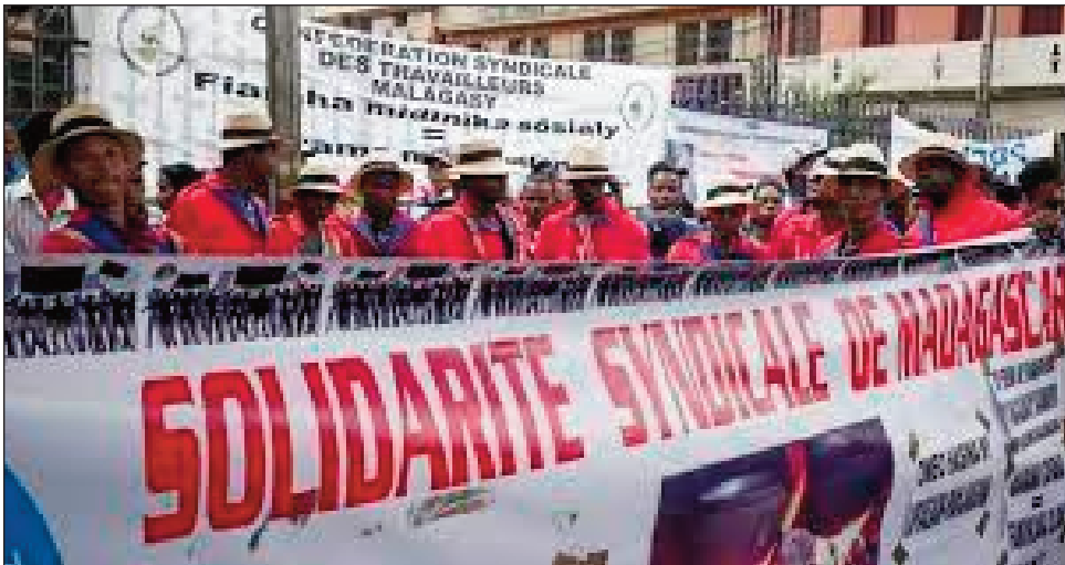
Ho rakotra mpiasa Antsahamanitra anio.

N a amperin'asa, na misotro ronono, hirohotra ho ao Antsahamanitra anio ny mpiasa rehetra eto andrenivohitra. Misy amin'izao fotoana ny tsy fampiharana ny fitondrana Rajoelina ny tombontsoa tokony ho azon'ny mpiasa eto amintsika, na ny amperin'asa io, na ho an'ireo zokiolona efa misotro ronono. Noho izay antony izay, no anisan'ny anton'izao hetsika izao, izay karakarain'ny SSM, Solidarité Syndicale de Madagascar, na ny Firaisankinan'ny Sendika eto Madagasikara. Hampiseho ny tanjany ny mpiasa anio, ho fanatsarana ny sehatry ny asa sy ho fisitrahana ireo zony. Handiniana ihany koa izany