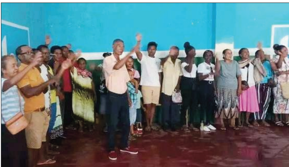
Ny fifampiarahabana tratra ny taona, ho an'ny mpitarika ny antoko TIM tany Mahajanga.

Tsy diso anjara tamin'ny fifampiarahabana tratra ny Asaramanitra ny taombaovao koa, ny mpitarika avy amin'ny antoko Tiako i Madagasikara (TIM) any amin'ny renivohitra ny faritra Boeny. Nifampiarahabana tratra ny taona vaovao tao amin'ny Tiko Mahajanga Be izy ireo ny faran'ny herinandro teo. Tamin'izany no nanomezana azy ireo toromarika, ny amin'ny fanentanana hatrany ny olona feno taona, hiditra hisoratra anarana ao anaty lisi-pifidianana. Ankoatra izany, ny fanetsehana ny fototry ny antoko ihany koa, ho amin'ny fiatrehana ny fifidianana filohampirenena ho avy, sy ny fifidianana ben'ny tanàna sy ny mpamolotsaina, izay tokony