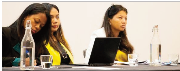
Ireo anisan'ny nampahafantatra ny vokatra ny fanadihadiana momba ny ady amin'ny kolikoly, eo amin'ny sehatry ny fiarovana ny hazo sarobidy eto amintsika.

L oza mitatao ho an'ny hazo sarobidy eto Madagasikara ny kolikoly, araka ny fanadihadiana nataon'ny TI-MG, na ny Transparency International Initiative Madagasikara. Maneho ny ambana sy ny fanambany ho an'ny faritra Menabe ny fikarohana nataon'ny TI-MG mahakasika izany. Nanolotra ny vokatra ny famakafakana, momba ny lalàna sy ny famantarana ny karazana kolikoly, manambana ny sehatry ny hazo sarobidy any amin'ny faritra Menabe ny fikambanana Transparency International - Initiative Madagascar (TI-MG) afak'omaly. Iray amin'ireo loza mitatao lehibe indrindra eo amin'ny ala voajanahary eto amin'ny firenena ny fitrandrahana tsy aradalàna ny hazo sarobidy. Namantatra ireo ambana kolikoly isan-karazany eo amin'ny sehatry ny fitrandrahana tsy aradalàna ny hazo sarobidy ity fanadihadiana ity. Anisan'ny ambana kolikoly hita eo amin'io sehatra io ny fanararaotana fahafanta-