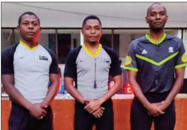
Ireo mpitsara basikety tetsy Mahamasina.

Raha nanomboka tamin'ny 02 febroary 2023 teo dia nifarana tamin'ny alarobia 15 febroary 2023, tetsy amin'ny Palais des Sports Mahamasina, ny hetsika "Tounoi de basket International Mayotte-Gnbc-Cospn", ka ny fihonnan'ny Sélection Mayotte sy ny Sélection Gnvb/Cospn, no namaranana an'izany tamin'io andro io. Ny vokatra azo dia lavon'i Mayotte tamin'ny isa 75 à 73 ny "Sélection Gnvb/Cospn". Nialohan'io lalao io kosa