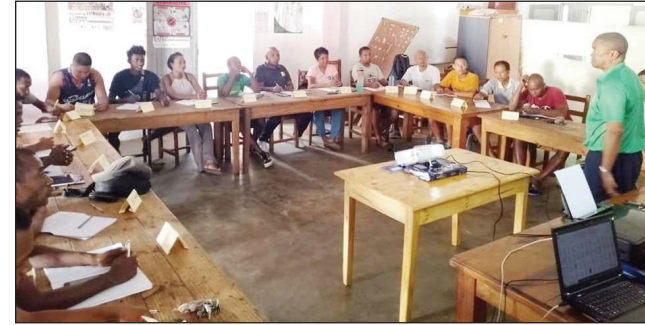
Fiofanana mpanazatra Young Coach tany Manakara.