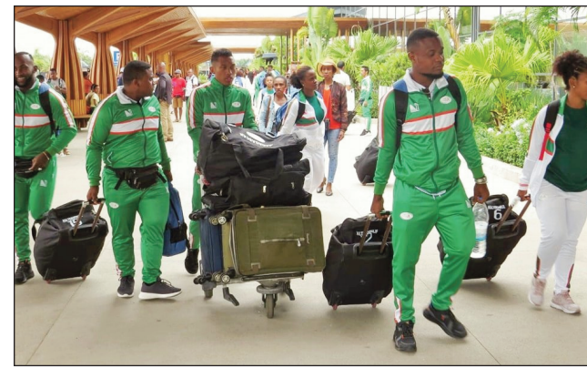
Atleta Malagasy nanainga teny Ivato.