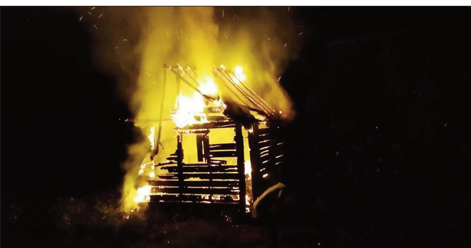
Trano nisy nandoro tany Morarano Gara Moramanga.