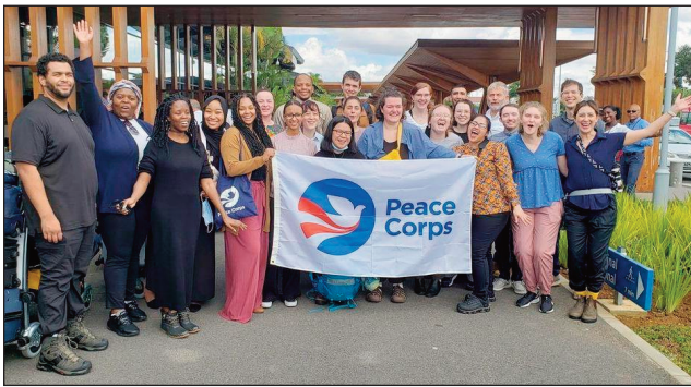
Ireo avy amin'ny Peace Corps Amerikana vao tonga eto amintsika.