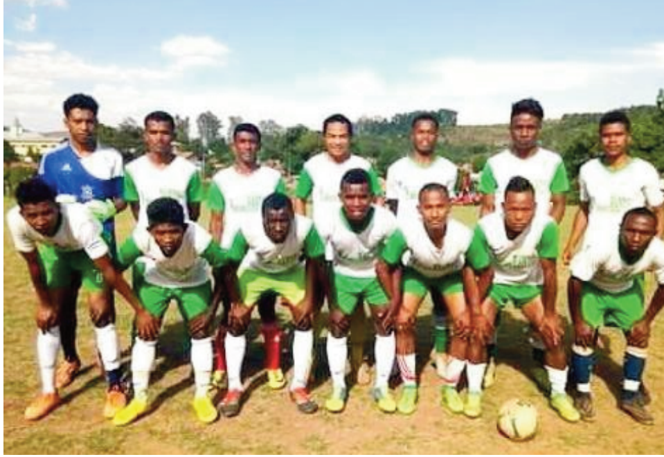
Ekipa mpilalao any Itasy.

Hitohy amin'ny alahady 12 sy alatsinainy 13 febrroary ho avy izao ny fifaninana baolina kitra « Championnat de Football D1 2022-2023 » karakrain'ny Ligin'ny baolina kitra any Itasy fantatra amin'ny hoe : « Itasy Football » taorianan'ny nanemorana azy nandritra ireny andro ratsy ireny. Fandaharan-dalao vondrona andrefana Alahady 12 febroary 2023, Kianja Miarinarivo : 13:00-Antanambao FC# 117 FC VS Jamaica Jfc (lalao miverina) 15:00-Fct Analavory #FCA analavory (lalao miverina) Alatsinainy 13 febroary 2023, Kianja Ampary : 14:00-Fitama # Mada City (lalao miverina) Vondrona atsinanana Alahady 12 febroary 2023, Kianja Arivonimamo : 12:00-Asca Foot # FootAcademy Fenoarivo (lalao mandroso) 14:15-Fmb