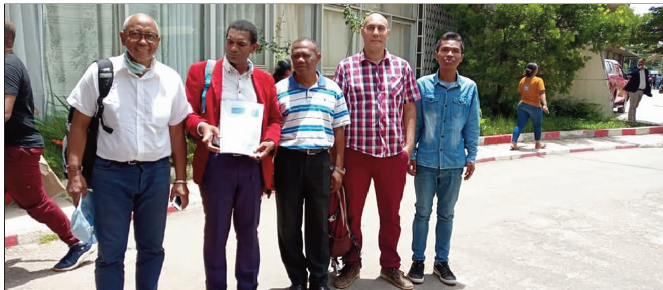
Mijoro ny antoko FIZAZIMA, tafapetraka ao amin'ny ministeran'ny atitany ny fijoroan'ity antoko politika vaovao ity.