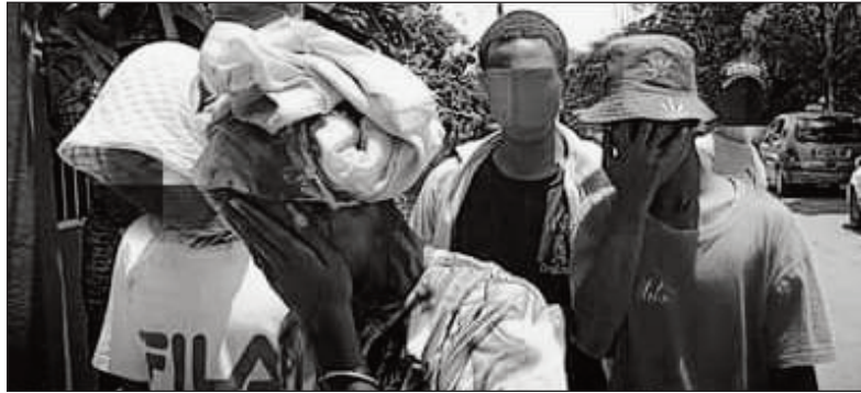
Ny korontana tany Antsohihy.