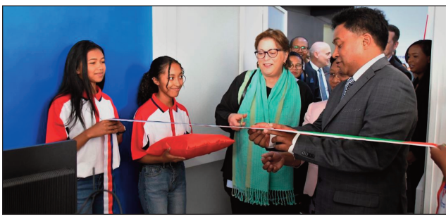
Fitokanana ny American Corner vaovao teny Ankatso.

Ny American Corner Antananarivo vaovao, izay natsangana eny amin'ny Oniversiten' Antananarivo dia sady hanampy betsaka ireo mpianatra sy ireo sampam-pampianarana ary ny olon-drehetra maniry hanao fikarohana, no hanamafy ny fifandraisana eo amin'Antananarivo sy Etazonia ary izao tontolo izao. Notokanan' ny Ambasadaoro Amerikana Claire Pierangelo, sy ny Filohan'ny Oniversiten' Antananarivo Mamy Ravelomanana omaly, ny American Corner vaovao, eny amin'ny Oniversiten' Antananarivo, izay hanokatra amin'ny fomba ofisialy ny tontolon'ny fikarohana sy ny fampianarana avo lenta ho an'ity Oniversite ity sy ny vahoaka Malagasy. Ny American Corner Antananarivo dia fiaramiasan'ny Masoivoho Amerikana eto Madagasikara, sy ny Oniversiten' Antananarivo ary ny