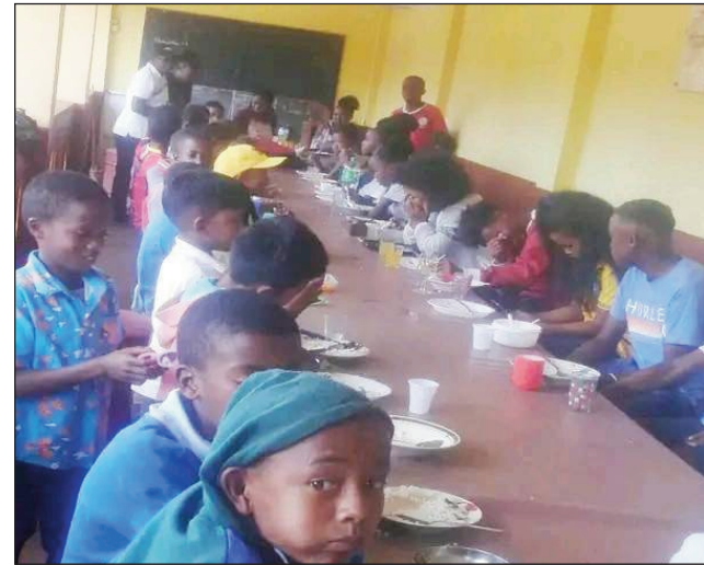
Teny amin'ny Epp Ambohitrahaha.