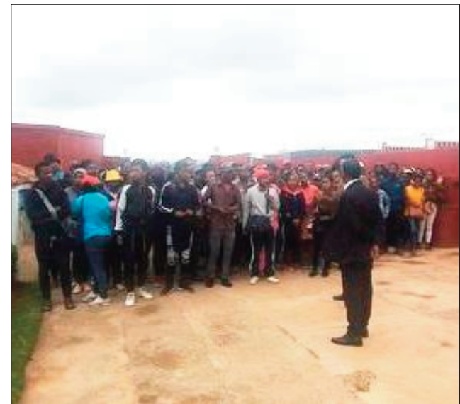
Fitokanana ny American Corner vaovao, teny amin'ny Oniversite Ankatso.