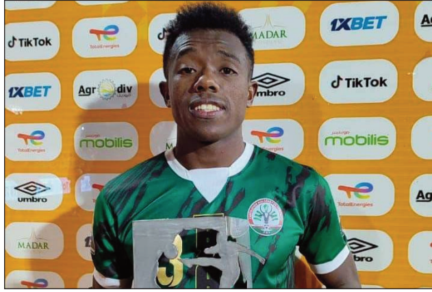
Tsiry tany Algérie.