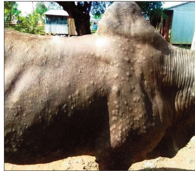
Omby marary any Antsiranana faha-2.