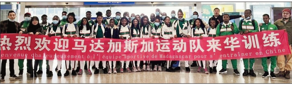
Ireo delegasiôna tonga any Chine.