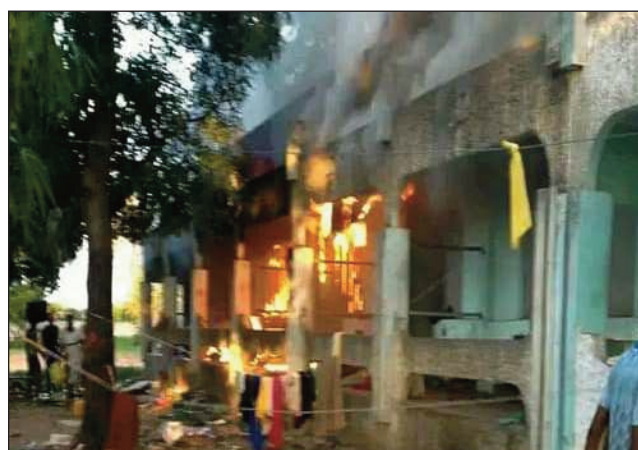
Tranon'ny mpianatra may tany Mahajanga.

Tranga mampalahelo no niseho tany Mahajanga faritra Boeny ny alahady hariva teo, niafara tamin'ny doro trano ny lalao baolina kitra nataon'ny mpianatra tany an-toerana. Tao amin'ny Campus Ambondrona, Oniversite Mahajanga : may tanteraka ny bloc 22 misy ireo mpianatra avy ao Analalava. Kila tao ny entana rehetra, fitaovampianarana ary ny diplaoma ho an'ny sasany. Raha ny vaovao voaray dia disadisa taorian'ny lalao baolina kitra nihan-nan'ny mpianatra avy any Analalava sy Bealanana