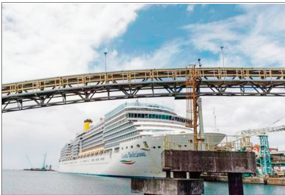
Ny sambo lehibe Costa, tonga tany Toamasina.

N igadona tao Toamasina faritra Atsinanana afak'omaly ilay sambo lehibe mitondra mpizahantany Costa Deliziosa. Nitondra mpandeha miisa 1608 izy, izay afaka nitsidika ny tananan'i Toamasina sy ireo toeram-pizahantany ma-