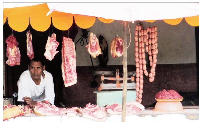
Anisan'ny miakatra be ny vidin'ny hena kisoa amin'izao fotoana.