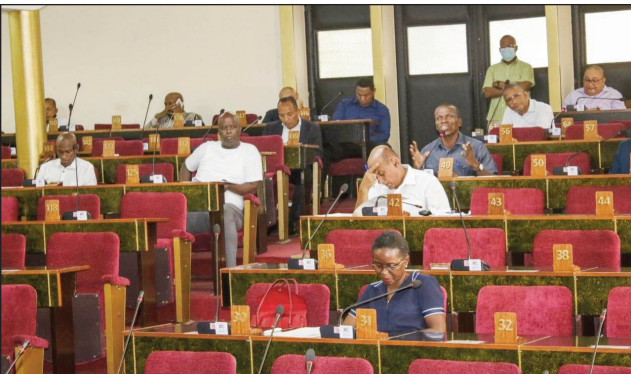
Ireo depiote nivory teny Tsimbazaza.