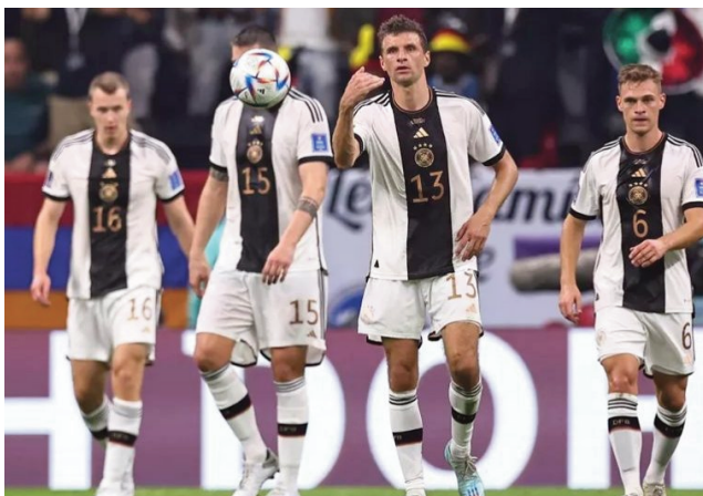
Nangoron'entana ny Mannschaft Allemand.

Talata 6 desambra : Amin'ny 6 ora hariva :