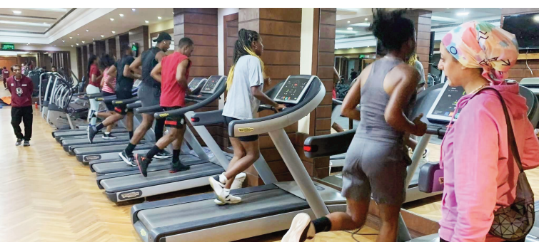
Mpilalao basket 3x3 Malagasy any Egypte.

Efa tonga soa any Le Caire renivohitr'i Egypte tamin'ny talata 29 novambra 2022 teo ny ekipam-pirenena Malagasy lahy sy vavy, hiatrika ny fiadiana ny tompondakan'i Afrika eo amin'ny taranja Basket-ball 3x3. Hotanterahana ny faha-3 sy faha-4 desambra 2022 ho avy izao, any amin'ity toerana ity ary efa manoman-tena fatratra ao amin'ny kianja "Stade de Al Nasr Club" amin'ny hiatrehana an'izany fifaninanana izany nanomboka tamin'ny harivan'ny alarobia 30 novambra 2022 lasa teo ny Ankoay lahy sy vavy.