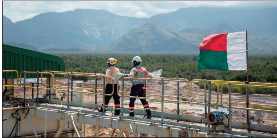
Ny orinasa Rio Tinto/QMM any Fort-Dauphin.

Mbola tsy milamina hatramin'izao ny adin'ny orinasa Rio Tinto/QMM any Fort-Dauphin amin'ireo mponina manodidina ity orinasa ity. Taorian'ny fametrahana sakan-dalana ataon'ireo mponina manodidina dia tsy azo antoka ny fidirana mankany amin'ny toeram-pitrandrahana ao Mandena, nanapa-kevitra ny orinasa QMM ny hametraka ny asa famokaran'ny « service minimum », mba ho fiarovana ireo mpiasa, ireo orinasa mpiaramiombon'antoka sy ireo fotodrafitrasa. Anisan'ny takian'ireo mponina any an-toerana ny fanonerana ny vidin'ny tanin'izy ireo, eo koa ny hanampiana