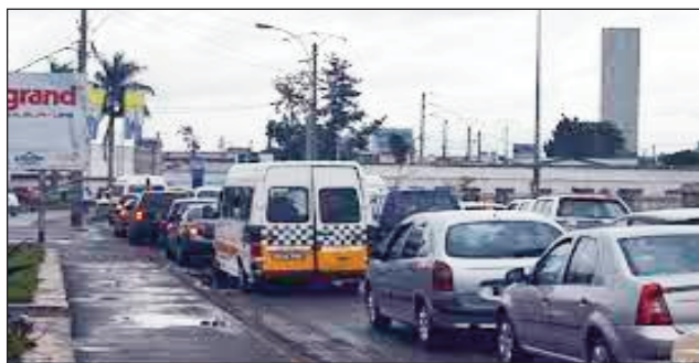
Toy izao ny fitohanana eto an-drenivohitra.

Tsy voafehin'i Vazahabe sy ny ekipany intsony ny andraikiny, izay no azo amehazana ny zava-misy amin'ny fitantanana ny renivohitr'i Madagasikara amin'izao fotoana. Efa navoaka ny hetra ho an'ny manana trano eto Antananarivo, nidangana be avokoa izany, izao vao nisy ny fanalefahana. Izany no midika, fa tsy mba nisy fandinihana lalina mialoha izany, mialoha ny namoahana ireny hetran-trano nidangana be ireny. Izao vao mihemotra amin'ny fanapahan-keviny ny fiadidiana ny tanàna, efa voaporofo anefa tamin'ireny toe-javatra ireny, fa tsy ao mihitsy ny fitantanana miainga avy etsy amin'ny Lapan'ny Tanàna Analakely. Hita porofo koa izao fa very tanteraka ny lazan'ny renivohitra noho ireo antoka nomena sy antsoantso izay natao tany aloha, miseho ho vazaha feno rehefa hanao zavatra ; nefa vazaha tapany aza tsy tratra. Tsy voafehy amin'ny tokony ho izy, satria raha ny loto sy fako fotsiny ohatra, dia tsy azo iainana intsony raha atao indray mijery. Fiara vaventy 11 isa no nambarany fa atolotra ny C.U.A raha izy no lany hitantana ny kominina, mba hanadiovana ireo dabam-pako sy ny hanadiovana ireo faritra iva misy loto. Teo koa ny antsoantso fa hanamboatra ireo lalana simba eto amin'ny manodidina, nefa dia lainga fotsiny hoy ny vahoaka marobe sendra anay, porofo mazava ny eny Manjakaray sy Ambodivona, lavaka manimba fiara ary efa fotaka sahady amin'izao fahavaratra izao. Ny olana manaraka dia ny fitohanana etsy sy eroa ity, noho ireo loto sy lavadavaka voalaza ery aloha, zara raha misy