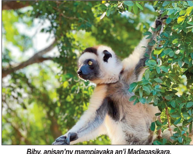
Biby, anisan'ny mampiavaka an'i Madagasikara.

Manampy an'i Madagasikara, hitahiry ny zava-manana'aina tsy manam-paharoa ananany i Etazonia. Hisy ny tranonkala vaovao eo anivon'ny tambazotran-tserasera Internet (aterineto), hanavao ny sehatry ny harena voajanahary sy ny fiarovana izany. Miara-miasa amin'ny fampiasana ny teknolojia ny fampahalalam-baovao i Etazonia sy Madagasikara, mba hiarovana sy hamonjena ny harena voajanahary sy ny harena an-kibon'ny tany malaza eto Madagasikara.