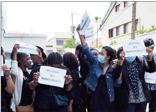
Ireo mpiasa nitokona tetsy amin'ny Lapan'Anosikely.

Tsy maha voalo ny karaman'ny mpiasa koa amin'izao fotoana ny etsy amin'ny Antanimierandoholona. Nitokona tsy nety nandray ny asany ireo mpiasa eo anivon'ity andrimpanjakana mpanao lalàna ity omaly vokatry ny tsy fahazoan'izy ireo ny tambin-karamany. Tsy misy vola hamahana ny olana ny fanjakana. Efa nisy ihany ny fifampiresahana fa tsy nisy vokany. Raha ny fantatra, omaly no tokony niroso tamin'ny fandanianana ilay volavolan-dalana mifehy ny tetibolam-panjakana ho an'ny taona 2023 ireo loholon'i Madagasikara. Raha nanodidina ny 17 miliara Ar ny tetibola ho an'ny Antanimierandoholo teo aloha, izay nizara ho an'ny senatera niisa 63.