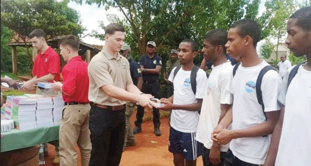
Ny fanoloran'ny Amerikanina fanomezana, ho an'ireo zaza kambotin'ny Polisim-pirenena any Ambatolampy.

Tsy nanadino ireo zaza kamboty taizain'ny Polisim-pirenena ao amin'ny Akany Ambatolampy, faritra Vakinankaratra ny Masoivoho Amerikana eto amintsika, fa nitondra ny anjara birikiny amin'ny fanampiana ny Akany. Fitaovam-pianarana: cahier, stylo, ... Sakafo: vary, menaka, siramamy, ... ary kilalao isan-karazany, no fanomezana azon'ny Akany tamin'izany. Tonga