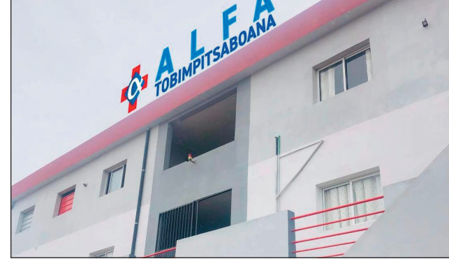
Ny tobim-pitsaboana "Alfa", teraka noho ny ezaka sy ny fikaonan-dohan'ny samy Malagasy.