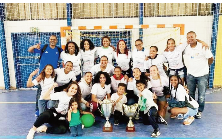
Ny ekipan'ny Hbf vehivavy any St Denis de La Réunion.