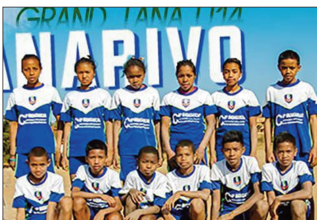
Tournoi Ajesai Grand Tanà U14.

Anisan'ireo ekipa handray anjara amin'ny fifaninanana baolina kitra « Tournoi Ajesaia Grand Tanà U14 », izay hanomboka amin'ny alakamisy 29 desambra 2022 izao ary hifarana amin'ny 31 desambra, 2022 ireo ankizy avy amin'ny Talenta School Ampahimanga Arivonimamo, hiaraka amin'ny ekipan'ny Rmd Anosizato, sy ny Andrady Fc ary ny Ajesaia Itaosy. Amin'ny alakamisy 29 sy zoma 30 desambra 2022 no hanaovana an'ireo fifa-