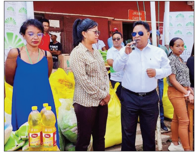
Ny fanolorana fanampiana ho an'ny fianakaviana sahirana teny Ivato.