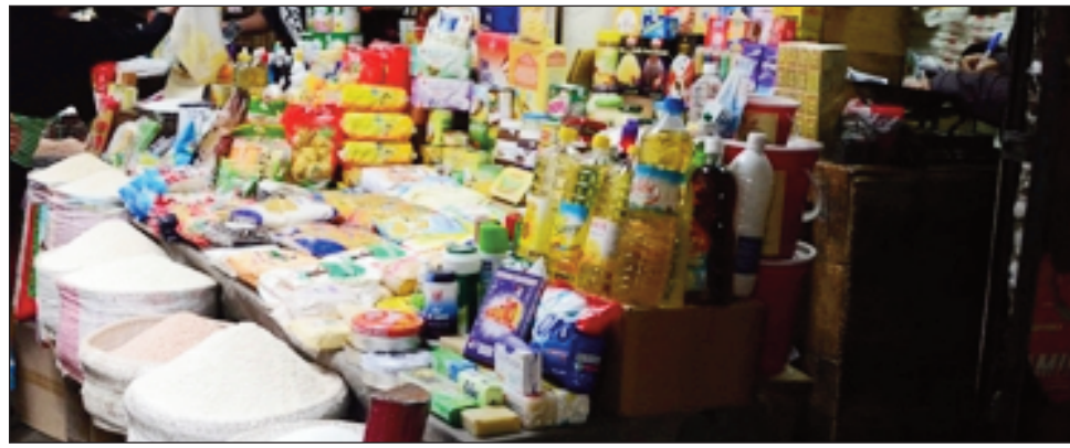
Anisan'ny manonga, ny vidin-javatra ilain'ny mponina andavanandro.

Amin'izao fiakaran'ny taona izao dia manonga ny vidim-piainana eto amintsika, mbola hanonga hanonga hatrany izany amin'ny taona ho avy 2023 hitsidika io. Tsy maintsy hitranga manomboka ny volana janoary ho avy io ny hiakaran'ny vidim-piainana. Aoka koa tsy ho adino fa tao anatin'ny LFI: lalànan'ny tetibolam-panjakana amin'ny taona ho avy, izay mbola nahitsin'ny lopolona farany teo, fa nakarina 15% ny vidin'ny solika, ny Jirama moa dia iny efa nandran-