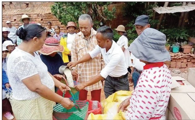
Ny solontenan'ny Collectif Diaspora, nanolotra fanampiana ho an'ny zokiolona teny Talatamaty Ambohidratrimo.