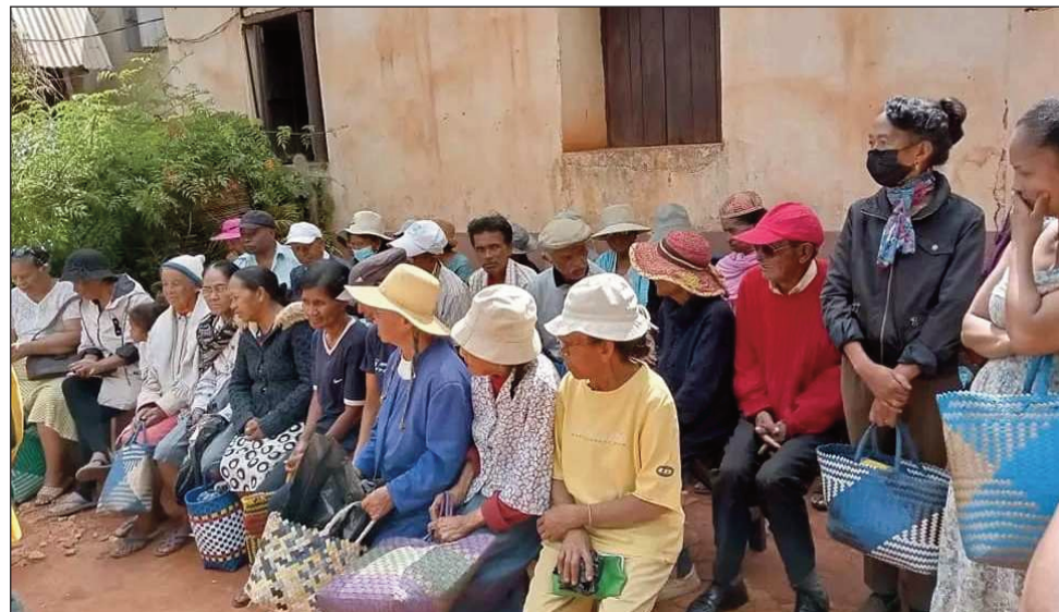
Ny avy amin'ny fikambanana Erikerika Madagasikara, nanolotra fanampiana ho an'ny mpampianatra, sy ny ray aman-drenin'ny mpianatra, tao amin'ny EPP Ambohitravoko Manjakandriana.