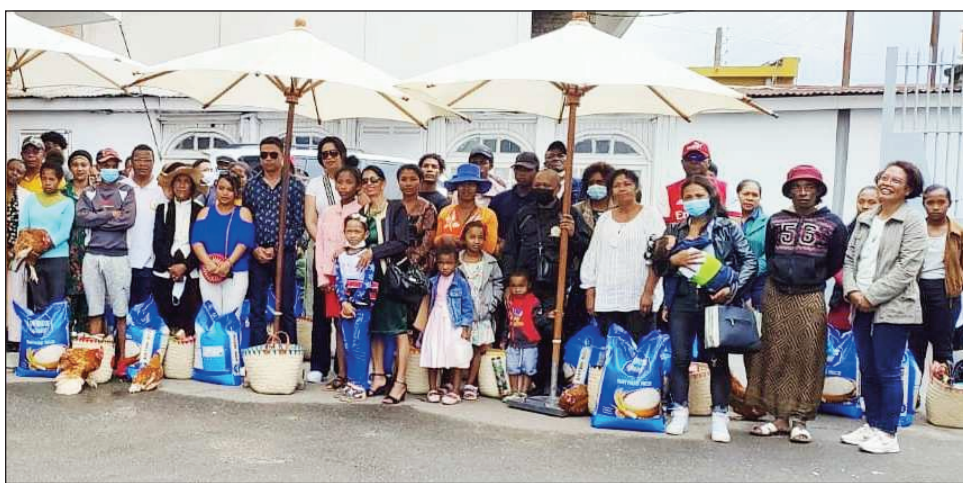
Ny fanolorana fanomezana ireo zanaka polisy, sy vadina polisy maty tam-perinasa.

Tsy nanadino ireo zanaka sy vadina polisy maty am-perin'asa ny FIVAPOVA tamin'ny fanakalazana ny fetin'ny Noely, n any Krismasy teo, fa nanome fanomezana ho azy ireo. Mbola maro ireo zanaka Polisy kamboty tsy tafiditra eny amin'ny akany, saingy tsy nohadinoin'ny fianakavian-ben'ny Polisy-pirenena izy ireo, fa notolorana fanomezana: vary, akoho sy sakafo isan-karazany ary kilalao, nentina niatrika ny fety. Ny Talem-paritry ny Filaminam-bahoaka sy ny FIVAPOVA (Fikambanan'ny Vadina Polisy sy Polisy Vavy), no agandy nana-nana ireto fanampiana