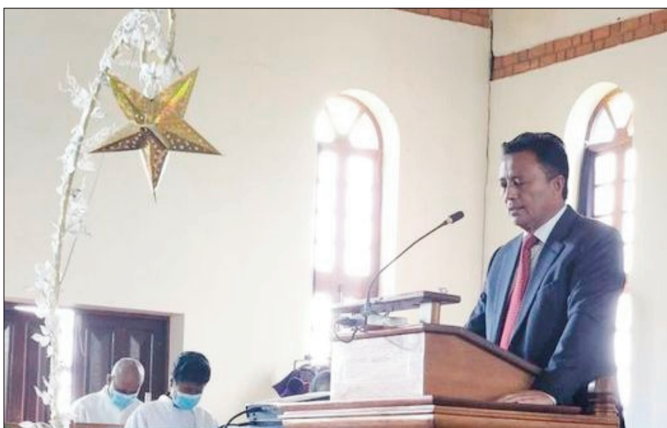
Ny filoha Marc Ravalomanana, teny amin'ny fiangonana FJKM Imerinkasinina Fanasina.

Fankalazana ny fetin'ny Noely na ny Krismasy ny alahady teo, teny amin'ny fiangonana FJKM Imerinkasinina Fanasina distrikan'Antananarivo Avaradrano, no niatrika izany ny filoha Marc Ravalomanana mianakavy. Nambarrany tamin'izany fa : "Mitondra am-bavaka ny Malagasy rehetra amin' izao Noely izao. Arahabaina isika rehetra tratry ny Krismasy 2022", hoy izy. Nandritra ny fotoam-pivavahana tany Imerinkasinina no nanambarany izany, niarahany nifaly tamin'ny mpino kristianina tany antoerana, indrindra niaranifaly tamin'ireo ankizy, amin'ny maha fetin'ny ankizy ihany koa ny andron'ny Noely toy izao. Tsy ny fetin'ny Krismasy ihany, fa mbola nirary soa ny rehetra tsy ankavaka koa izy, ho tratran'ny