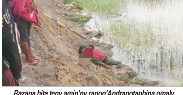
Razana hita teny amin'ny ranon'Andranotapahina omaly vao maraina.

mpamonjy voina. Misokatra kosa ny fanadihadiana mahakasika izao tranga nahitana fatin'olona izao. Tsy nisy nahafantarana azy teny amin'ity olona namoy ny ainy ity, koa mbola eo am-panaovana izay famotorana izay ny mpitandro filaminana any amin'ny faritr'i Marovantana iny.