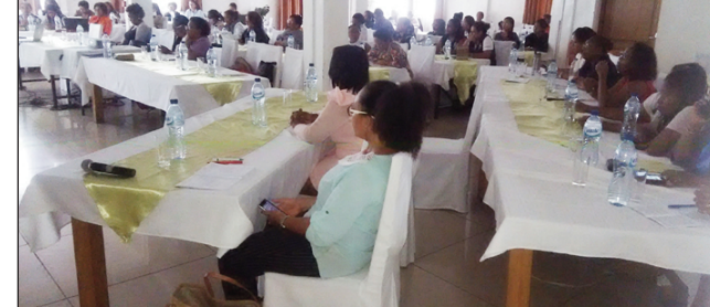
Ny atrikasa nataon'ny CNFM tetsy Andavamamba.