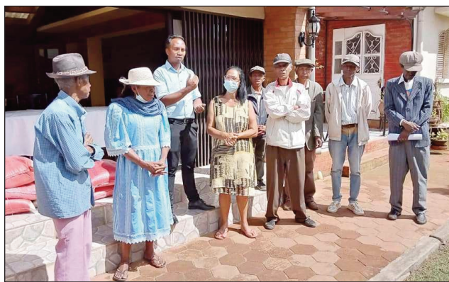
Ny hetsika sosialy nataon'ny Diaspora Pro Ravalomanana teny Talatamaty.

fety izao. Mahatsiaro ireo Diaspora Pro Ravalomanana, fa mijaly sy sahirana ny vahoaka Malagasy ankehitriny, noho ny zavamisy eto amin'ny firenena. Mankahery ny Malagasy izy ireo amin'izao fotoan-tsarotra mahazo ny firenena ankehitriny izao. Velom-pisaorana ireo Diaspora avy any ivelany ireo nahazo tombontsoa, satria mba ho afa-pahasahiranana kely izy ireo amin'ny fanampiana izay natolotra azy.