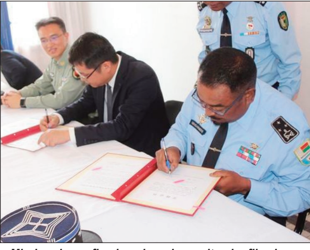
Miroborobo ny fiaraha-miasan'ny mpitandro filaminana amin'ny sinoa.

Tsara ny fifandraisana eo amin'ny Zandarimariam-pirenena sy ny firenena Sinoa. Nahazo fampitaovana vaovao toy ny aroloha (casques), arovatana (gilets anti-balles) sy fitaovana fikapohana misy herinaratra ambony dia ambony (matraques), avy amin'ity firenena ity ny Zandarimaria. Tato anatin'ny fotoana fohy izao dia nifanesy ny fahafatesana zandary, maty voatifitry ny dahalo, noho tsy fahampian'ny fitaovana hoentiny izy ireo miaro tena. Araka izany dia tena mamaly ny filan'ny Zandarimaria amin'