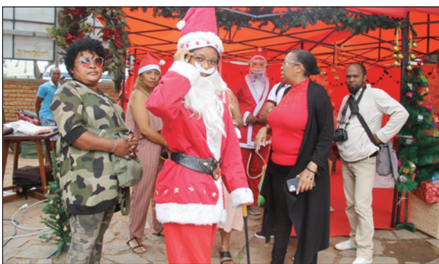
Fankalazana ny Noelin'ny ankizy, niarahana tamin'ny Fondation Celine et Didier Ratsiraka.