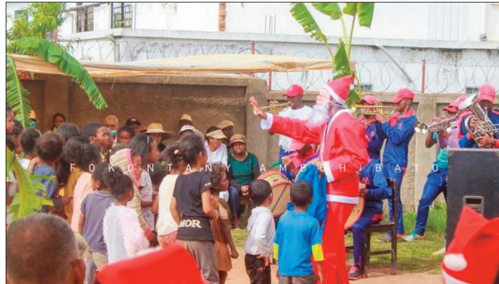
Asa sosialy amin'izao fetin'ny Noely izao, ataon'ny Fondation Celine et Didier Ratsiraka.