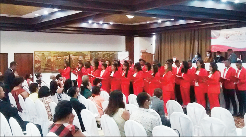
Ny fankalazana ny faha-15 taonan'ny AFAFI tetsy amin'ny Hotel Carlton.