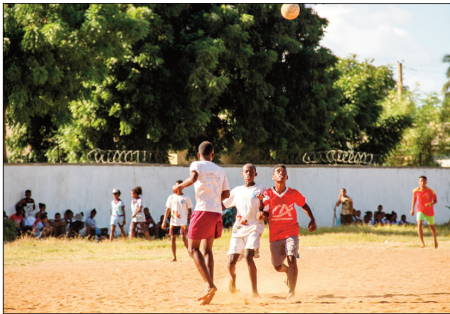
Mpilalao Kitra Tanora Malagasy.

Ho fanomanana ny handraisan'i Madagasikara anjara amin'ny fifaninana baolina kitra COSAFA U20 amin'ny taona 2023 dia hisy ny fikarakarana fifaninana baolina kitra natokana hoan'ireo mpilalao zatovolaha latsaky ny 19 taona hanomboka amin'ny volana janoary 2023 ho avy izao ka nampitondraina ny anarana hoe : "Coupe des Sélections Régionales U19 Garçons" . Avy amin'ity fifaninana ity no hananganana ekipam-pirenena ny baolina kitra Malagasy sokajy U 19 na Barea U 19 hiatrika an'io fifaninana COSAFA