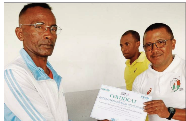
Fanomezan'ny DTN sertifikà ny mpiofana iray.