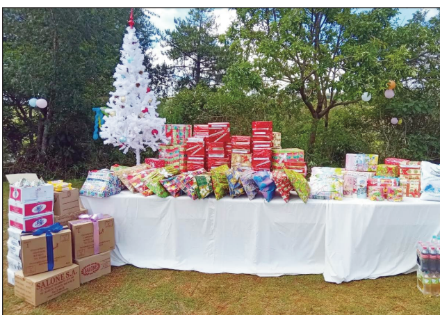
Ireo fanomezana nomena ireo zaza kambotin'ny polisim-pirenena any Ambatolampy.