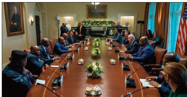
Ny fihanan'ny filoha Amerikana tamina filoha maromaro avy aty Afrika, anisan'izany ny filoha Malagasy.

pirenena ireo, anisan'izany ny fitsabahan'ny vahiny sy ny herisetra ara-politika. Nifanakalo izao fomba fanao nahomby, amin'ny fitantanana ireo ambana ireo sy hiantohana fifidianana azo antoka sy mangarahara ary atokisan'ny vahoaka ihany koa ireo filoha. Nohamafisin'ireo mpandray anjara ny fahavononan'izy ireo hikarakara fifidianana malalaka sy marina ary mangarahara, tanterahan'ny rafi-pifidianana nasionaly mahefa sy mahaleo tena ary tsy mitanila, araka ny voalazan'ny sata afrikana momba ny demokrasia sy ny fifidianana ary ny fahaiza-mitantana. Manan-danja ny fifidianana hatao aty Afrika amin'ny taona 2023. Na dia tsy manohana kandida na antoko manokana aza i Etazonia, dia manamafy ny fanohanany ny zotram-pifidianana hanamafisana ny demokrasia aty Afrika. I Etazonia dia miara-miasa amin'ny Kongresy ary mikasa hanome 165 tapitrisa dolara mahery, hanohanana ny fifidianana sy ny fitondrana tsara tantana aty Afrika amin'ny taona 2023.