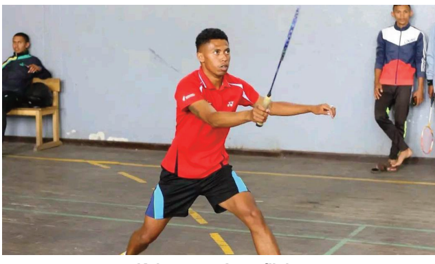
Kalaza teny Ampefiloha.