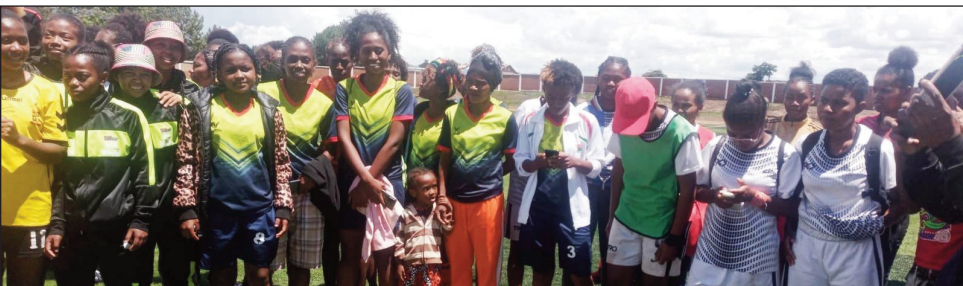
Football Féminin « phase 2 ».