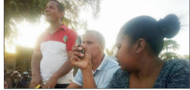
Ny sasany amin'ireo mpitarika ny Distim any Mahabo faritra Menabe.