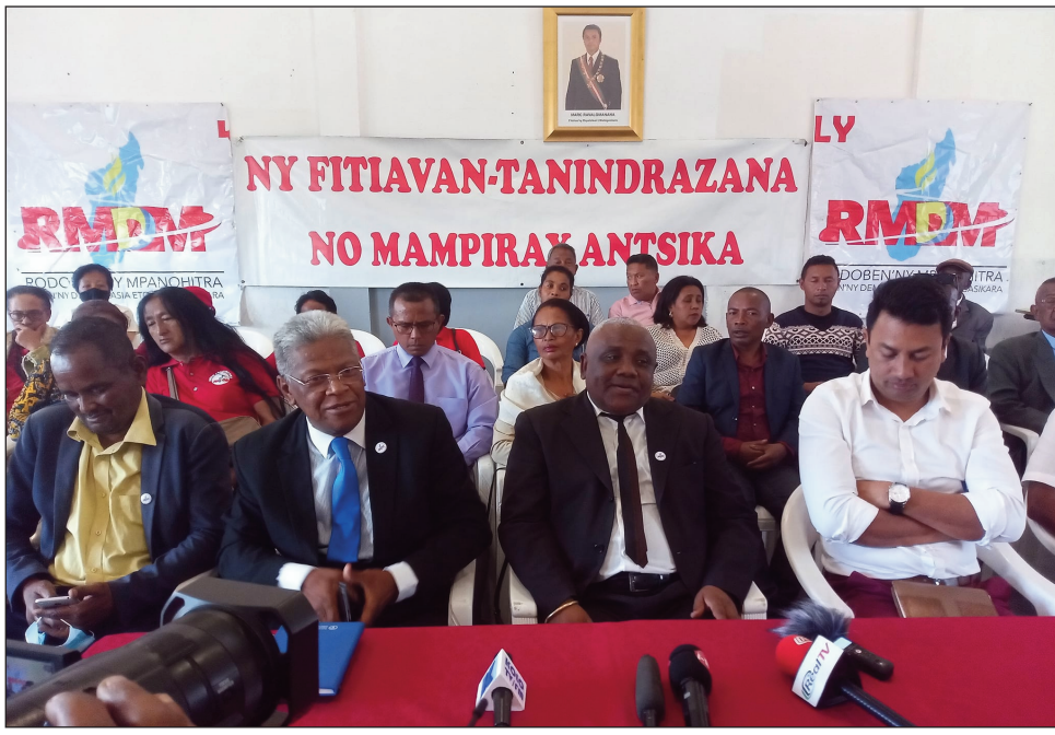
Ny tafa tamin'ny mpanao gazety nataon'ny RMDM tetsy Bel'Air omaly.