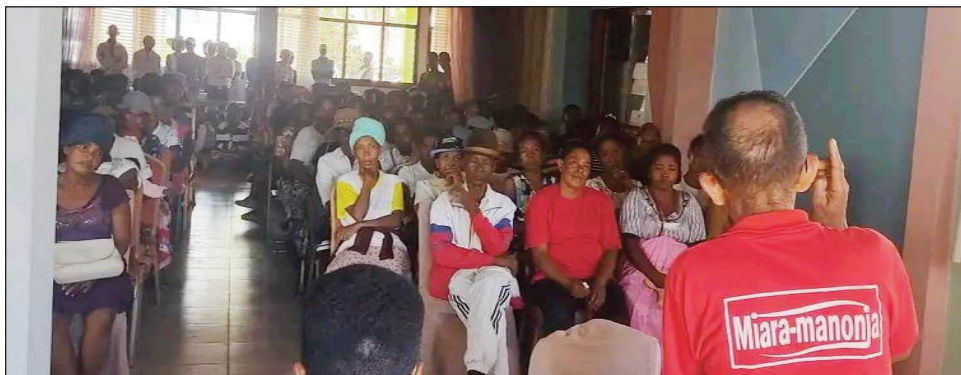
Ny fivorian'ireo mpitarika ny antoko TIM tany Ihosy faritra Ihorombe.

Nanatanteraka fivoriana ny avy amin'ny antoko Tiako i Madagasikara (TIM) any Ihosy faritr'Ihorombe ny faran'ny herinandro teo. Nisy arak'izany ny fanentanana ireo mpikambana hanatant-raka ny toromariky ny filoha Marc Ravalomanana, nandritra ny fankalazana ny tsingerintaona nahaterahany sy ny faha-20 taonan'ny antoko TIM, natao tany Fianarantsoa ny 12 desambra lasa teo. Manentana ny mpikatroka rehetra hiditra amin'ny lisi-pifidianana ny TIM Ihosy, ary nanentana azy ireo ny mpitarika ho mailo amin'ny fanaraha-maso