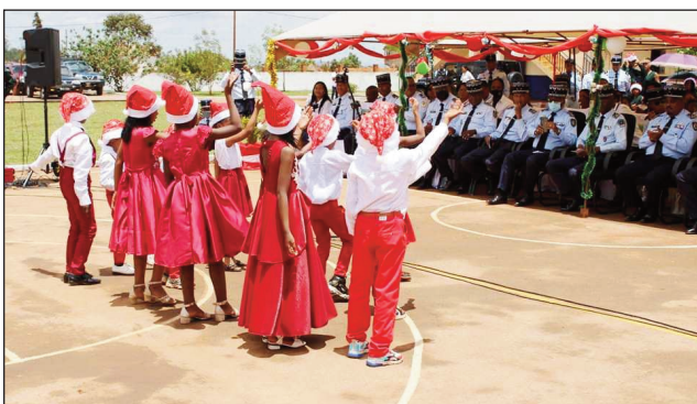
Ny fankalazana ny Noely ho an'ireo ankizy taizaina ao amin'ny Akanin'ny Zandarimariam-pirenena Arivonimamo.

"Fa Mpamonjy no teraka ho anareo anio ao antanànan'i Davida, dia Kristy Tompo" Lioka 2:11. Dibon-kafaliana ireo ankizy kamboty miisa 71 beazina ao amin'ny Akany Zandarimaria Arivonimamo faritr'ltasy, nandritry ny fankalazana ny Noely taona 2022, izay natao y sabotsy teo.