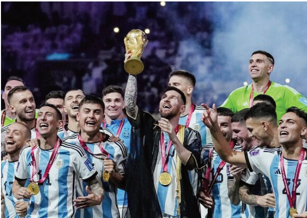
Avo ny lanitra ho an'i Messi sy ny namany.

Tapitra tamin'ny alahady 18 desambra 2022 ny andiany faha-22 amin'ny fifaninanana baolina kitra « FIFA World Cup Qatar 2022 », ka tafavoaka ho tompondakan'ny baolina kitra lehilahy vaovao ny ekipan'i Argentine noatarihan'i Lionel Messi. Lavon'izy ireo tamin'ny isa 3(4) - 3 (2) taorianan'ny « Tirs au but » ny ekipan'i France tompondaka farany teo amin'ny lalao famaranana, notontosaina tao amin'ny kianja « Stade Lusail Iconic » any Doha Qatar. Fety be tsy nisy toa azy ny an'ny va-hoaka Argentin hatrany Qatar ka hatrany Buenos Aires renivohitr'i Argentine. Sambany teo amin'ny niangaliana baolina kitra i Messi, no nibata an'ity amboara lehibe