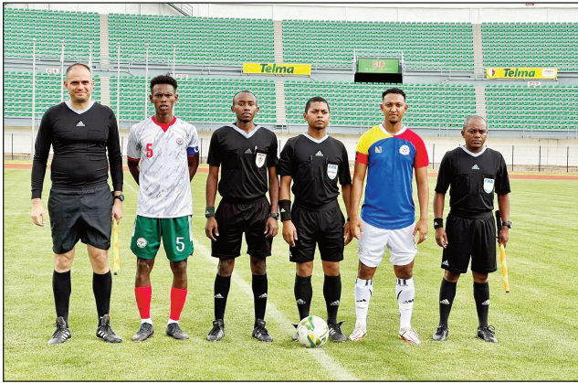
OPL sy UJSM tetsy Mahamasina.

Lavon'ny Barea Chan 3 - 0 ny ekipa voafantintin'i La Réunion, nahitana betsaka an'ireo mpilalao Malagasy mila ravinahitra any an-toerana, izay notarihan'i Théodin mpilalao teo aloha tao amin'ny Fosa Juniors Fc. Ho fanomanan-tenan'ny Barea handeha hiatrika ny Chan Algérie 2023 ity fihaonana natao tetsy amin'ny kianjan'ny Mahamasina tamin'ny sabotsy 17 desambra 2022 ity ary mialohan'ny hiaingan-dry zareo ho any Tunisie, mbola hiatrika lalao fanomanan-tena