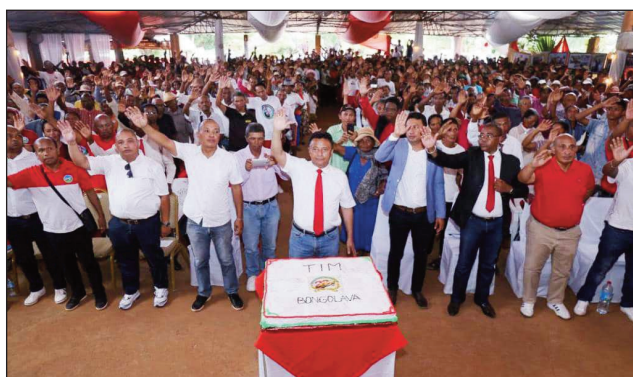
Ny filoha Marc Ravalomanana tany Tsiroanomandidy faritra Bongolava.

kitra. Homba antsika mandrakariva Andriamanitra," hoy ny fanambarana anisan'ny nataony tamin'izany. Nandritra izany ihany koa no nanambaran'i Dada, fa omena sehatra manokana ny vehivavy sy ny tanora ao anivon'ny antoko. Hita sy tsapa tany an-toerana fa sahy, mino, ary mijoro i Bongolava, hipoka tanteraka ny toerana nomanin'ny tany an-toerana.