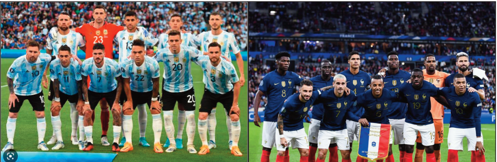
I Argentine sy i Frantsa.