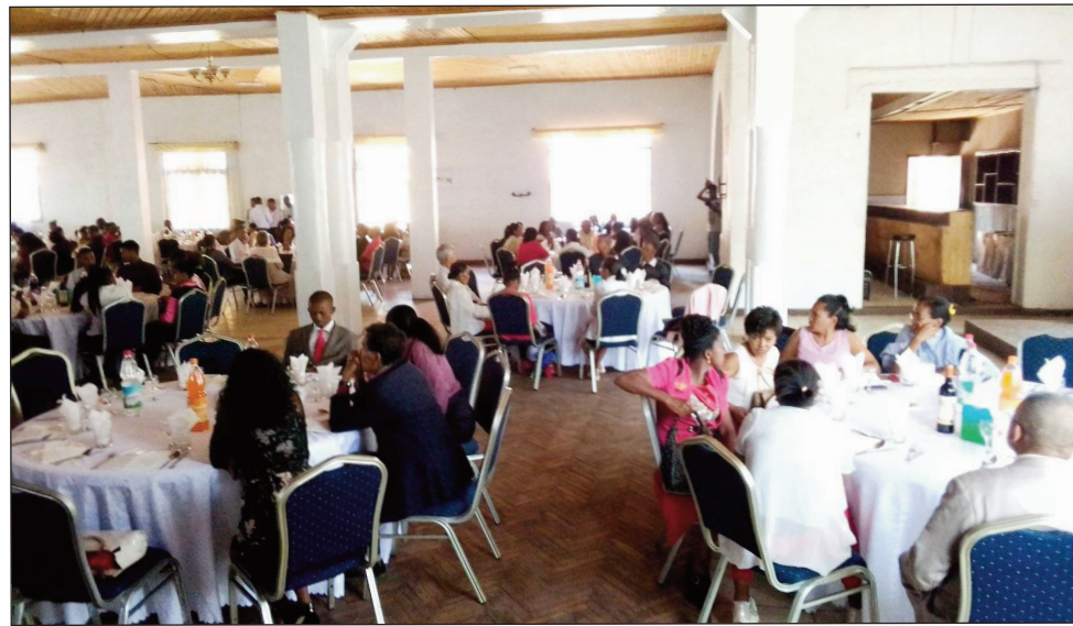
Ny fahatongavan'ny filoha Marc Ravalomanana, filoha nasionalin'ny antoko TIM, tany Tsiroanomandidy omaly, nanatrika ny faha-20 taonan'ny antoko TIM tany amin'ny faritra Bongolava.