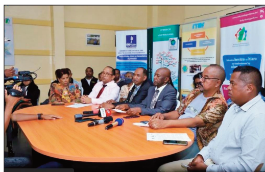
Ny avy amin'ny VOI Tsarafara, sy ireo mpiara- miombon'antoka aminy. Ny avy amin'ny VOI Tsarafara, sy ireo mpiara-miombon'antoka aminy.

Niha-mafy hatrany ny disadisa teo amin'ity olon-tsotra ity sy ny fikambanana Tsarafara teo amin'io tany ao Andriankely io, izay la- zainy fa Tsarahonenana, ka niakatra Fitsa- rana matetika ny raharaha. Teo anatrehan- izany dia nahazo rariny hatrany ny Fi- kambanana teo anatrehan'ny Fitsarana am- baratonga voalohany tany Ambatolampy, satria nidina ifotony ny fitsarana niaraka ta- min'ireo Sampan-draharaham-panjakana sy Manampahefana voakasika nanamarinan'ny fizaran'ny tany ary hita fa tsy mifanindry mi- hitsy ny tanin'ity olona tokana ity, izay atao hoe Tsarahonenana sy ny tany Andriankely ao anatin'ny tany tantanan'ny VOI Tsarafara, fa mifanakaiky. Tsy nanaiky izany ilay olona te-hibodo ny tany, izay efa voajarin'ny Fika- banana an-taonany maro, niaraka tamin'ireo tantsoroka ara-bola sy ara-teknika, ka nam- piakatra ny raharaha teo anivon'ny Fitsarana