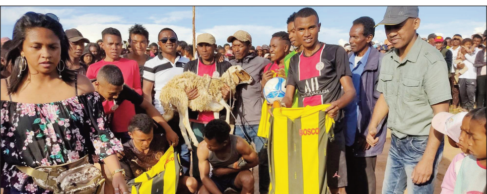
Ny ekipa laharana faharoa, nahazo ny amboara ondry.