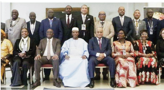
Ireo mpikambana ao amin'ny Fiba Afrika tany Mozambika, anisan'izany ny filohan'ny FMBB.

Tafahaona nivantana tao Maputo Mozambique tamin'ny alarobia 14 desambra 2022 lasa teo, ny filankevi-pitantanan'ny FIBA Africa, izay sambany tafahoana nivantana, taorian'izay nisian'ny valan'aretina Covid izay. Nodinihan'ity filankevi-pitantanan'ny Fiba Afrika ity ihany koa nandritra an'io fivoriana io, ireo hetsika taloha ary nankatoavina ireo tetikasa vaovao maromaro mahakasika ny basikety ao amin'ny kaontinanta. Marihana fa nifanindrandalana tamin'ny fiadiana ny ho tompondakan'i Afrika, andiany 2022, hatao any an-drenivohitr'i