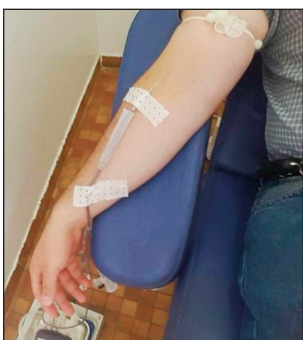
Olona mpanome rà maimaimpoana.

Nitondra ny fitarainany tamin'ny gazety ny olona nitondra marary tamina Hopitaly ka nipa rà. Namidin'ireny Hopitaly ireny hoy izy ny rà tokony homena maimaimpoana: