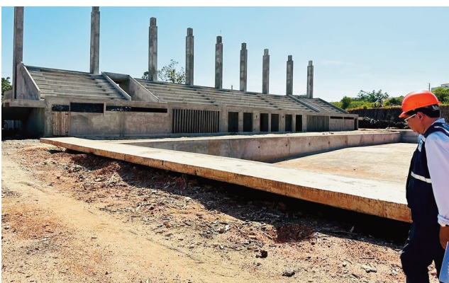
Ny CIJ nitsidika ny fanamboarana ny dobo filomanosana tany Mahajanga.

Nifarana omaly ny fivorian'ny CIJ: "Filankevitra iraisam-pirenena momban'ny lalaon'ny Nosy eto amin'ny ranomasimbe Indianina", fanomamana ny Lalaon'ny Nosy 2023, izay notanterahina teny amin'ny Novotel teny Alarobia Antananarivo, nanomboka tamin'ny alarobia 14 desambra 2022 lasa teo, ka nankatoavana fa ho tanterahina eto Madagasikara hanomboka amin'ny 23 aogositra ka hatramin'ny 3 septambra 2023 izany hetsika izany. Firenena 7 mandrafitra ny CIJ no handray anjara tamin'ny zavany fivoriana izany dia i Maurice, Maldives, Mayotte, Comores, La Réunion, Seychelles ary i Madagasikara mpampiantrano. Nanatrika an'izany ihany koa ny ORAD Océan Indien. Fantatra tamin'izany ihany koa fa