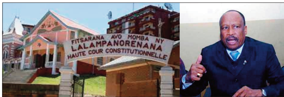
Vaky ny ady eo amin'ny filohan'ny HCDDDED sy ny HCC.

Namoaka ny fanambarany, na avis ny HCC omaly, mahakasika ny fangatahan'ny filohan'ny HCDDDED, filankevitra ambony ho fiarovana ny demokrasia sy ny tany tan-dalàna, ny hila-zan'ny HCC, na ny fitsarana avo momba ny lalampanorenana, ny nanafoanana ny fitsipaham-pitokisana tao amin'ny Antenimierampirenena, sy ny fanitsakitsahana ny lalampanorenana ataon'ny filoha Rajoelina, nihaona mivantana tamin'ireo depiote. Toy izao izany fanambarana nataon'ny etsy Ambohidahy izany: "Avis n°01-HCC/AV du 21 décembre 2022 Relative à une demande du Président du Haut Conseil pour la Défense de la Démocratie et de l'Etat de Droit. Le Président du Haut Conseil pour la Défense