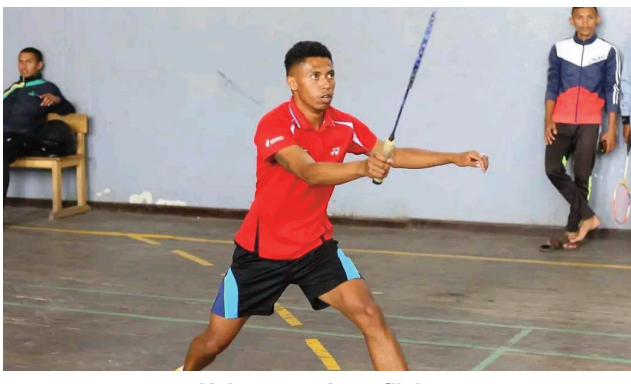
Kalaza teny Ampefiloha.