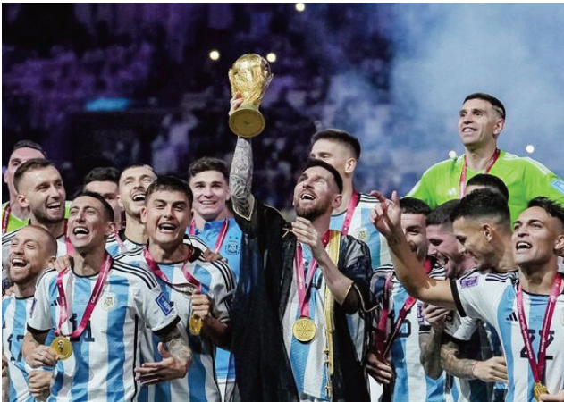
Avo ny lanitra ho an'i Messi sy ny namany.

Tapitra tamin'ny alahady 18 desambra 2022 ny andiany faha-22 amin'ny fifaninanana baolina kitra « FIFA World Cup Qatar 2022 », ka tafavoaka ho tompondakan'ny baolina kitra lehilahy vaovao ny ekipan'i Argentine noatarihan'i Lionel Messi. Lavon'izy ireo tamin'ny isa 3(4) - 3 (2) taorianan'ny « Tirs au but » ny ekipan'i France tompondaka farany teo amin'ny lalao famaranana, notontosaina tao amin'ny kianja « Stade Lusail Iconic » any Doha Qatar. Fety be tsy nisy toa azy ny an'ny vaohoka Argentin hatrany Qatar ka hatrany Buenos Aires renivohitr'i Argentine. Sambany teo amin'ny niangaliana baolina kitra i Messi, no nibata an'ity amboara lehibe