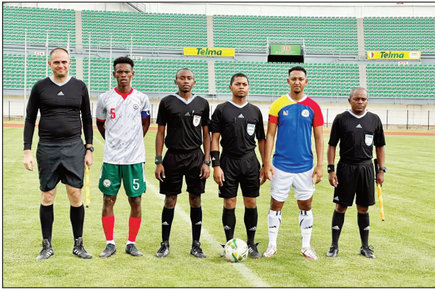
OPL sy UJSM tetsy Mahamasina.