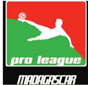
Ny sary famantarana ny Orange Pro League.

League D-2 ny taom-pilalaovana Orange Pro League 2022/2023. Neken'ny CFEM ny handamina ny fe-potoana famotsorana ireo mpilalao miaraka amin'ny FMF mba hahafahan'ny Barea manomana tsara amin'ny fiadiana ny ho tompondakan'i Afrika (CHAN) 2022, hatao any Alzeria, amin'ny Janoary sy Febroary 2023. Tapaka ihany koa fa ho tazonina ny raikipohy tamin'ny taon-dasa