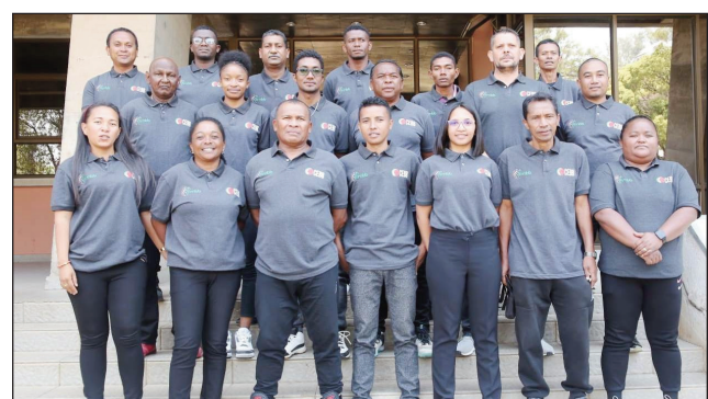
Ny CEBB tetsy Mahamasina.