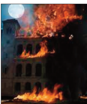
Ny fahamaizan'ny Rova 27 taona lasa izay.