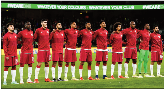
Ny Ekipam-pirenena'i Qatar mpampiantrano.

Ho tanterahina any Qatar hanomboka amin'ny alahady 20 novambra 2022 ho avy izao, ka tsy hifarana raha tsy amin'ny alahady 18 desambra 2022 ny fifaninanana baolina kitra «Fifa World Cup 2022» andiany faha-22. Miisa 32 nozaraina ho vondrona 8 ireo ekipam-pirenena handray anjara amin'izany fifaninanana izany, ka lalao 64 no hifandimbiasana hatrehan'izy ireo. Vondrona A : Qatar, Equateur, Sénégal, Pays-Bas. Vondrona B : Angleterre, Iran, Usa, Pays de Galles. Vondrona C : Argentine, Arabie Saoudite, Mexique, Pologne. Vondrona D : France, Australie, Danemark, Tunisie. Vondrona E : Es-