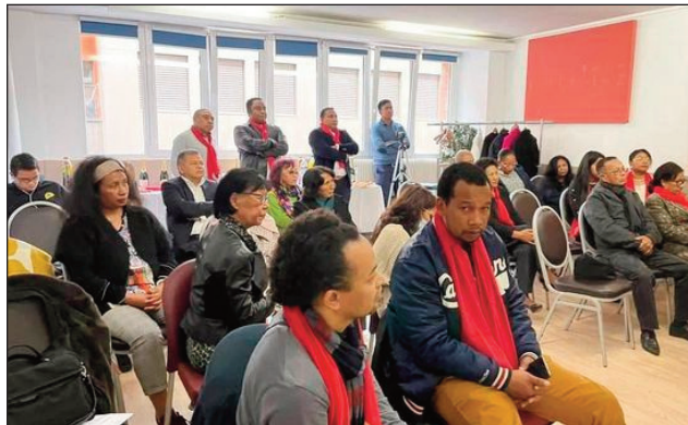
Ny hetsiky ny TIM Frantsa ny sabotsy teo tany Paris.

Nontanterahina ny sabotsy tao Paris renivohitr'i Frantsa ny hetsika fidirana amin'ny politika : rentrée politique, nataon'ny antoko Tiako i Madagasikara, TIM Frantsa. Tonga maro ireo mpikatroka TIM, ary namaly ny antson'izy ireo ihany koa ireo fikambanana maro samihafa mpanohana mafana fo ny filoha Marc Ravalomanana. Fidirana amin'ny politika no natao, nefa na izany aza tsy nipetrpetraka fotsiny nandritra ny taona maro, fa tamin'ity fihaonana ity niavaka kosa, araka ny fanamarihan'ny mpikarakara, satria fotoana isehoana amin'izay hoy izy ireo amin'izao herintaona mialohan'ny fififianana hatao eto amin'ny firenena izao. Tokana ny tanjona dia hametraka ny filoha Marc Ravalomanana hitantana ny firenena indray. Mahatsiaro izahay na aty antany lavitra aza, fa tena mijaly sy miaina ao anaty fahantrana ny Malagasy. Tsy hipeetra-potsiny anefa manoloana ny tetika entina hangalaran-bato ny TIM Frantsa ; koa mitaky ny hanaovana ny fikaonandoham-pirenena aty Madagasikara hisoro-