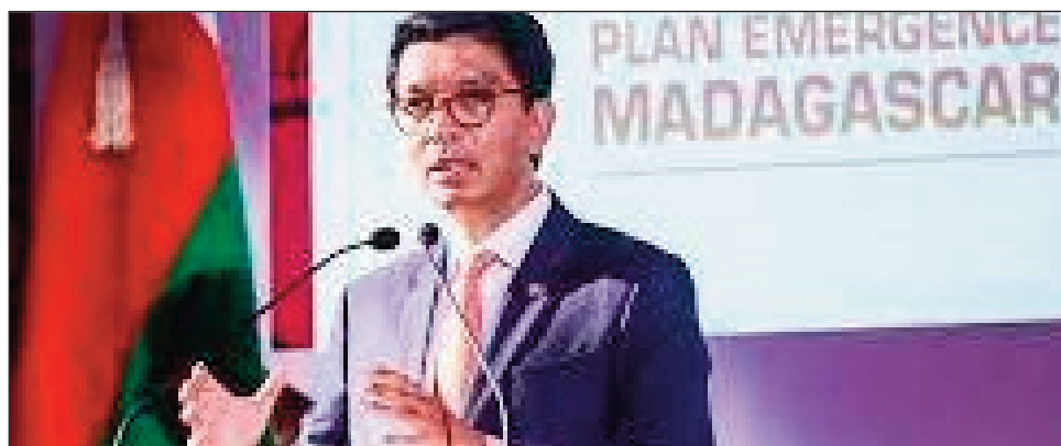
Ny filoha Rajoelina teny amin'ny CCI Ivato.

Taorian'ireny toe-draharaha tamin'ny faran'ny herinandro lasa teo ireny, mikasika ny planina voalaza fa maty paika (PEM) ary efa namoahana andiam-baovao maro teto ihany koa, dia mba maro ihany koa ireo olon-tsotra, niantso sy nandefa hafatra taty aminay fa kabary sy antso fanampena-maso : takon-kenatra, sy tsy am-piheverana teo anatrehan'ny vahiny avy any ivelany fotsiny ihany no betsaka, nefa efa tara be mihitsy raha oharina tamin'ny fampielezan-kevitra sy propagandy natao tany aloha fony hirotsaka ho fidiana ho filoham-pirenena ny taona 2018 Rajoelina, ka tsapa fa efa simba sy lo ny zavatra tiany hatao, hoy ireo sendra anay nefa mbola tiankatoa ihany amin'ny fifidianana 2023 manaraka. Tsy am-piheverana tokoa hoy ireo beanitra avy naka vola fisotroan-dronono teny avaradrano, satria raha ilay lalam-be migodana na "auto route" ohatra, iza no tena hahita