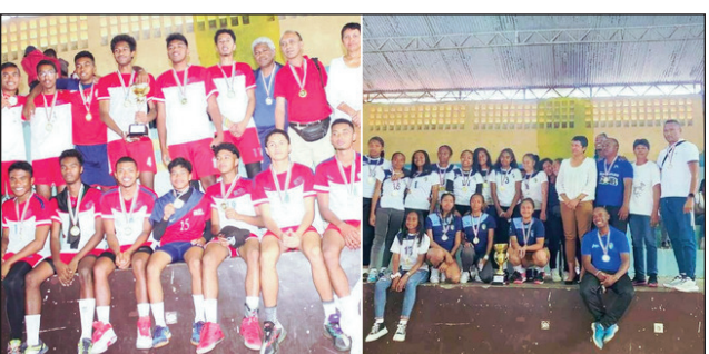
Asi lehilahy sy Gnvb vehivavy.