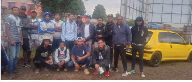
Rallye Passion Antsirabe 2022.

Ny Rallye Passion andiany faha-3 ho tontosaina any Antsirabe amin'ny alakamisy 10 sy zoma 11 ary sabotsy 12 novambra 2022 ho avy izao izay ho karakarain'ny «Club Tacs» no dingana faha-6 amin'ny fiadiana ny ho tompondakan'i Madagasikara 2022 amin'ity fifaninanana Rallye Malagasy ity. Dingana manokana miisa 14 no ao anatin'ny fandaharana amin'ity rallye Passion