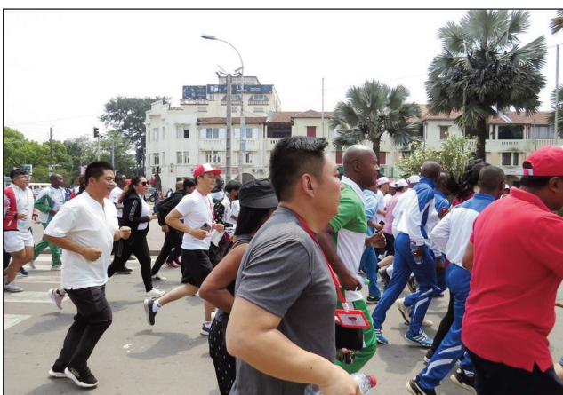
"Course de l'Amitié" nandalo teny Analakely.

Hazakazaka ara-piralahina "Course de l'Amitié" natomboka teny amin'ny « Parvis Analakely », nandalo teny Behoririka ary nifarana tao amin'ny Kianja Barea Mahamasina, tamin'ny alahady 06 novambra 2022, no nanamarihana ny faha-50 taonan'ny fifandraisana ara-diplomatika teo amin'i Chine sy i Madagasikara teto amintsika. Ny Masoivoho Sinoa eto Madagasikara, sy ny Fikambanana Sino-Malagasy, no tompo-marika tamin'ny fikarakarana an'ity hetsika ity ary nitarika nivantana ny hetsika ny Ambasadaoron'i Chine miasa sy