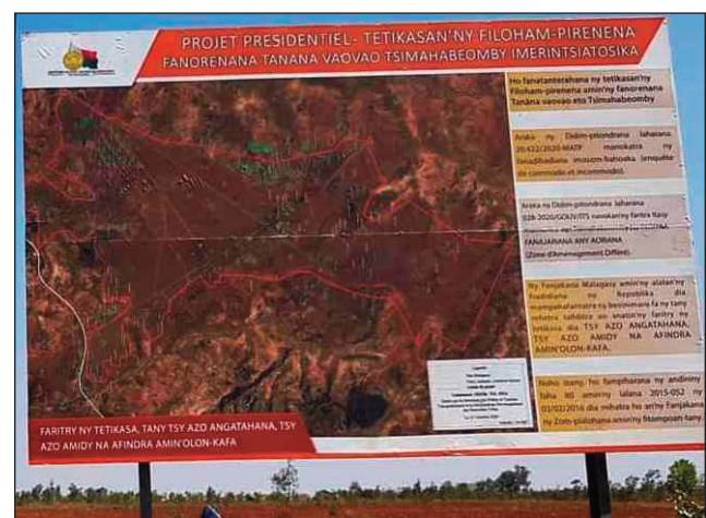
Ny tetikasa Tanamasoandro, any Tsimahabeomby Imerintsiasosika.