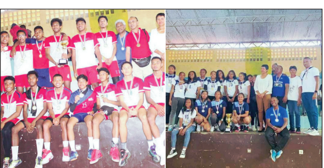
Asi lehilahy sy Gnvb vehivavy.