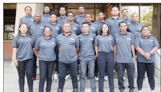
Ny CEBB tetsy Mahamasina.