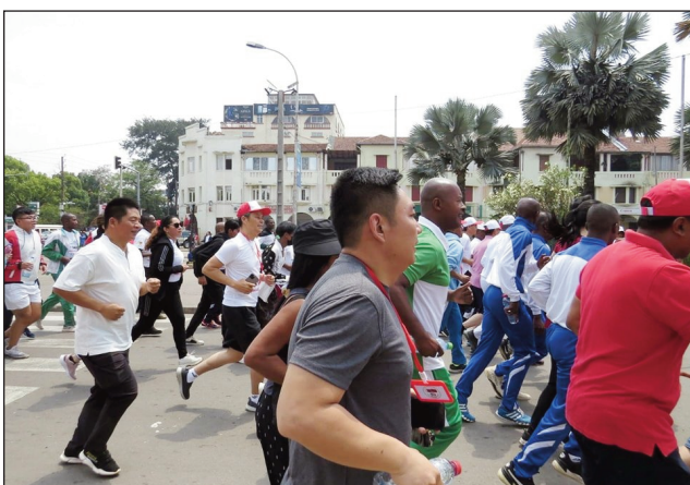
"Course de l'Amitié" nandalo teny Analakely.

Hazakazaka ara-piralahina "Course de l'Amitié" natomboka teny amin'ny « Parvis Analakely », nandalo teny Behoririka ary nifarana tao amin'ny Kianja Barea Mahamasina, tamin'ny alahady 06 novambra 2022, no nanamarihana ny faha-50 taonan'ny fifandraisana ara-diplomatika teo amin'i Chine sy i Madagasikara teto amintsika. Ny Masoivoho Sinoa eto Madagasikara, sy ny Fikambanana Sino-Malagasy, no tompo-marika tamin'ny fikarakarana an'ity hetsika ity ary nitarika nivantana ny hetsika ny Ambasadaoron'i Chine miasa sy