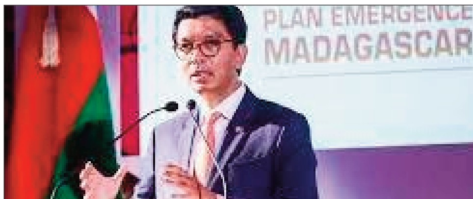
Ny filoha Rajoelina teny amin'ny CCI Ivato.

Taorian'ireny toe-draharaha tamin'ny faran'ny herinandro lasa teo ireny, mikasika ny planina voalaza fa maty paika (PEM) ary efa namoahana andiam-baovao maro teto ihany koa, dia mba maro ihany koa ireo olon-tsotra, niantso sy nandefa hafatra taty aminay fa kabary sy antso fanampena-maso : takon-kenatra, sy tsy am-piheverana teo anatrehan'ny vahiny avy any ivelany fotsiny ihany no betsaka, nefa efa tara be mihitsy raha oharina tamin'ny fampielezan-kevitra sy propagandy natao tany aloha fony hirotsaka ho fidiana ho filoham-pirenena ny taona 2018 Rajoelina, ka tsapa fa efa simba sy lo ny zavatra tiany hatao, hoy ireo sendra anay nefa mbola tiankatoa ihany amin'ny fifidianana 2023 manaraka. Tsy am-piheverana tokoa hoy ireo beanitra avy naka vola fisotroan-dronono teny avaradrano, satria raha ilay lalam-be migodana na "auto route" ohatra, iza no tena hahita