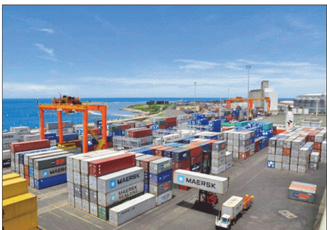
Ny seranan-tsambon'i Toamasina.

zan'ny Orinasa. Tsy manana mangirana fa mbola tafalentika tanteraka. Tsy misy afenina ny fahasahiranana ara-bola ho an'ny rehetra koa na hoana no mbola terena hametraka vola be hatao antoka etsy sy ery ireo Orinasa madinika tsirairay? Tsorina arak'izany, fa tsy afaka hanatontosana na hiatrika ireo fampiakarana petra-bola fiantoka vao-tondron'ny Article 15 ao amin'ny Didim-pitondrana N° 20071/2022 io ny Orinasa CAD sy TM, izay Didim-pitondrana tsy mifanaraka amin'ny zavamisy amin'ny fisehon'ny fiainam-pirenena. Fahapotehan'ny Orinasa madinika Malagasy, no vokatra aterak'io ary orinasa izay niasa sy n'ny tsara indrindra tamin'ny nandritra ny 20 taona, mamelona fianakavianana maro ary mbola averina: isan'ny tompon'andraikitra voalohany mampiditra ny volampanjakana. Fampatsiahiana: ny Agrément ihany koa dia toy ny Permis na kara-panondro, fahazaon-dalana azo ho