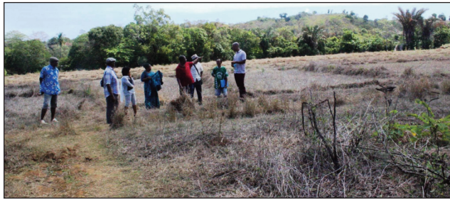
Tany isiana olana amin'ny olom-boafidy any Ambatozavavy Nosy-Be.

Velon-taraina ny vahoaka any amin'ny Fokontany Andranobe boriborintany Ambatozavavy distrikan'i Nosy Be faritra Diana, amin'ny tsindry sy ramatahora izay ataon'ny olom-boafidy amperinasa amin'izao fotoana izao, izay manana tany amin'ny Fokontany Andranobe ihany koa, ka nosakanany ny lalana fandalovana. Tamin'ny taona 1933 no efa nanaovana lalana, natsaraina tamin'ny taona 1973, ka mpandraharaha maromaro izay manana tany manodidina ao amin'ny Fokontany Andranobe boriborintany Ambatozavavy Nosy Be, no nandinika sy nikaon-doha niaraka tamin'ny vahoaka ary mpitondra tany Nosy Be tamin'izany andro izany, ka tapaka fa atao lalana. Alohan'ilay olom-boafidy nividy an'io tany io dia efa