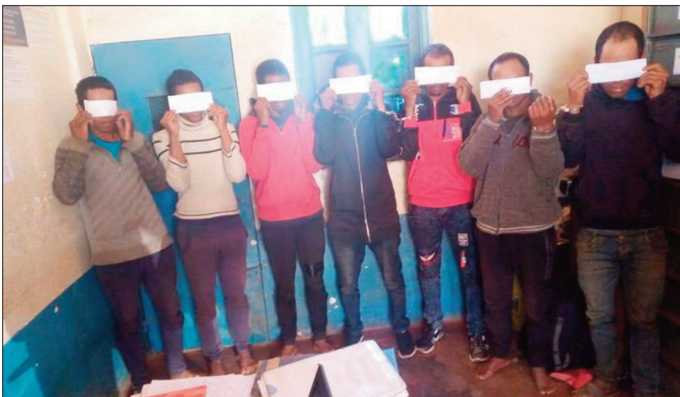
Ireo mpisoloky tratra.

Resaka fisolokiana, voasambotra ry Kalanoro sy ry Dadabe. Saron'ny Zandary avy ao amin'ny Poste Avancé Ambatofotsy Antananarivo Atsimondrano, ny olona miisa 07 avy any Antambiazana/Antsirabe II, mpanao fisolokiana amin'ny antso an-telefonina. Mitsatoka laharana finday antsoina ny mpisoloky ary milaza fa manana volamena iray vilany tany nomen-javatra, fa tsy notrandrahana ny dadabeany ka mila anaovana fomba sy sorona vao afaka kitihina, ka akoho lahy mena sy omby mainty tokam-bolo no ilaina amin'izany, raha hiara-hiasa ianao. Hain'izy ireo ny mandresy lahatra, ka misy ny roboka. Ampiresahan'izy ireo amin'ilay antsoiny hoe Dadabe ianao rehefa vita ny dingana voalohany ary eo i Dadabe, no milaza fa ianao no voatondro hazo ny fahasoaavana ary mila miresaka amin'ilay Kalanoro. Eo no mandray ny anjara asany ny olona manao feo kentsona la-