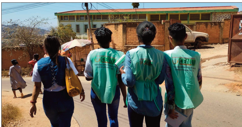
Ireo tanora mpanisa mpifidy avy amin'ny CENI.

Herinandro katroka izao no nanombohana ny fanisana ny lisitra vaovaon'ny mpifidy eto amin'ny tsy niala tao an-dohan'ny maro anefa tao anatin'izay ny hoe: logiciels efa drodroka, efa nanondrana, 17 taona mahery niasana ve dia mbola mangarahara foana rehefa ampiasaina? izay tsy eken'ny maro raha tsy hanaovana fitsirihana manokana "Audit" eo anatrehan'ny Vondrona Eoropeana mihitsy ohatra. Fokontany maro no nambara fa efa nanomboka ny anjara asany, toy ny eny Analamahitsy sy ny manodidina iny ohatra, ka mba gaga ihany ny rehetra tsy mahita izany "Tablette" izany akory, toa mampandry adrisa fotsiny ny Ceni raha izany no arahina, akom-baovao efa hita any Toamasina any koa raha ny teny nataon'i Roland Ratsiraka. Hita sy tsapa, fa raha mbola tsy eo ihany koa ny tompon'andraikitra ny fokontany, toy ny lehiben'ny sektera dia tsy ahavita ny