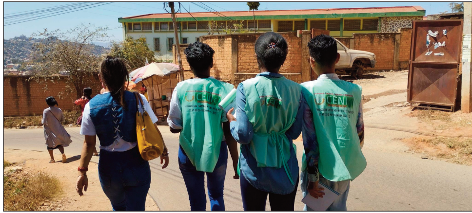
Mitaraina ny mponina any Ambatozavavy Nosy-Be faritra Diana, fa misy fanamparam-pahefana amina tany ataona olom-boafidy any an-toerana.