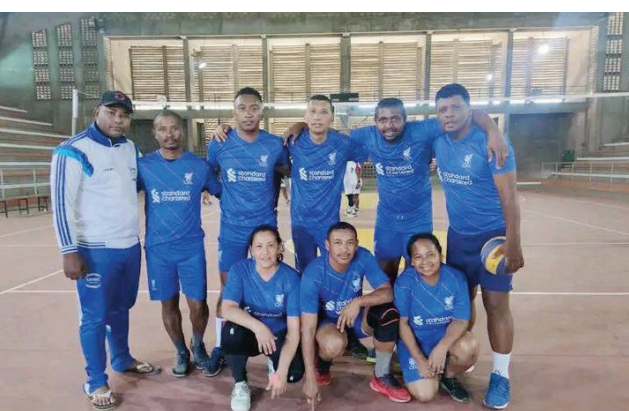
Ekipa Volley-ball Asief.

Hanomboka ny lalao Asief « Vainqueur des Coupes 2022 » etsy amin'ny kianja LMA Ampefiloha anio sabotsy 08 oktobra 2022, ny taranja volley-ball, ka hanomboka amin'ny 08 ora maraina ny lalao voalohany. Ireo fandaharan-dalao anio : PRM # MEDD, SANTE # SENAT, TOP DOM # PRIMATURE.