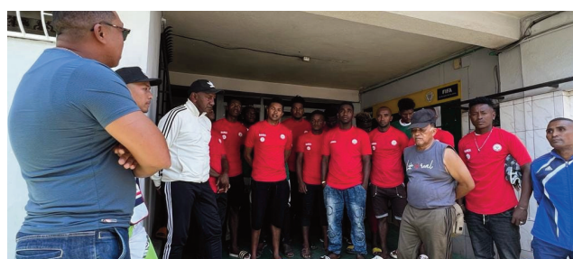
Barea Beach Soccer teny Isoraka.