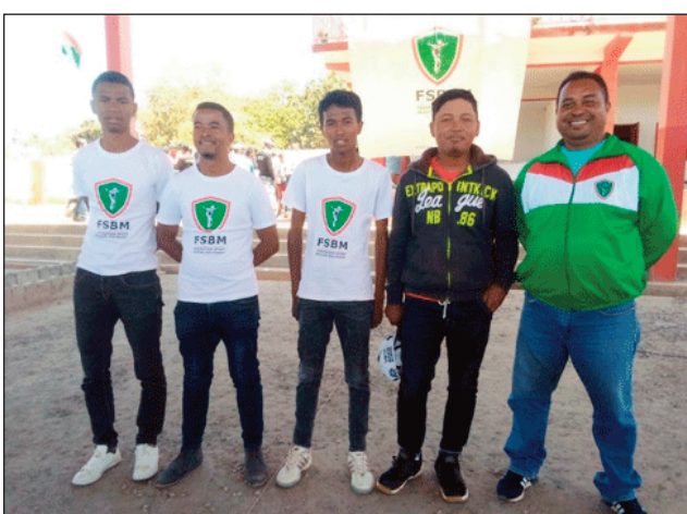
Mpilalao tsipy kanetibe teny amin'ny Pac Ampitatafika.

Nanomboka omaly zoma 07 oktobra 2022 teny amin'ny "boulodrome Pac Ampitatafika", ny lalao tsipy kanetibe fiadiana ny ho tompondakan'i Madagasikara 2022, ka ny sokajy "Séniors hommes" no nisantra an'izany, taorian'ny fanokafana ôfisialy. Anio sabotsy 08 ôktôbra 2022 kosa no miditra an-tsehatra ny sokajy vehivavy sy sokajy "Juniors" ary ny sokajy "Vétérans". Marihina fa tsy hifarana ity fifaninana ity raha tsy rahampitso alahady 09 ôktôbra 2022. Izay tafavoaka ho tompondaka eo amin'ny sokajy "Séniors hommes" dia hotolorana amboara kalisy 1 ho an'ny klioba, miaraka amin'ny amboara kalisy 3 hafa sy medaly miisa 3 ihany koa hoan'ireo mpilalao. Hisy koa ny