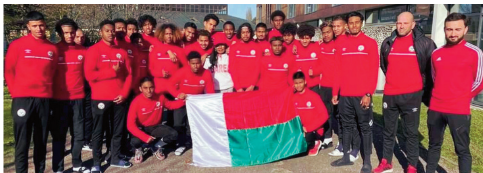
Barea U 23 anisan'ny nampiakatra ny toeran'i Madagasikara.

Nahazo laharana miabo 3 i Madagasikara eo amin'ny "Classement" izay navoakan'ny Fifa eo amin'ny baolina kitra, tamin'ny alakamisy 6 oktobra 2022, fa raha laharana faha-105 izy teo aloha dia niakatra eo amin'ny laharana faha-102 ankehitriny. Ny vokatry tsara azon'ireo Barea isan-tso-kajiny tato ho ato no nahatonga an'io fiakaran'ny toeran'i Madagasikara io. Marihana fa mbola mitana ny laharana voalohany maneran-tany i Brésil manana isa 1841.3, faha-2 i Belgi-