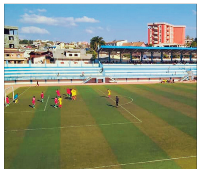
Ny kianja maoderina Ampasambazaha Fianarantsoa.