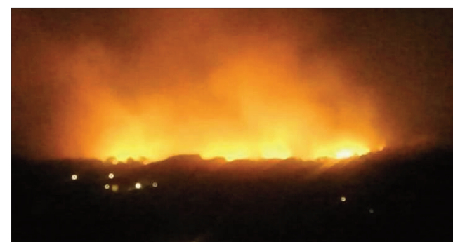
Ny firehetana ny ala tany Isalo.