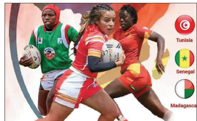
Rugby Africa Women's Cup 2022.