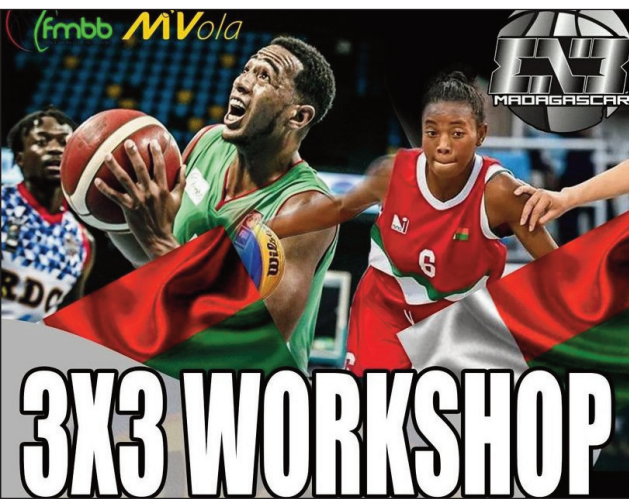
Hetsika "3x3 WorkShop".

Ho tanterahina eny Ankorondrano amin'ny sabotsy 8 sy alahady 9 ôktôbra 2022ho avy izao, ny hetsika basikety "Telo manao amin'ny telo (3 x 3)", ho fitiliana an'ireo mpilalao LAHY SY VAVY handrafitra ny Ekipam-pirenena malagasy basket 3x3, hiatrika ny fiadiana ny amboaran'i Afrika, izay hatao any EGYPTA amin'ny 3 sy 4 desambra 2022 ho avy izao, sy hiatrika ihany koa ny lalaon'ny Nosy ny taona 2023 hatao eto amintsika. Ny FMBB "Fé-