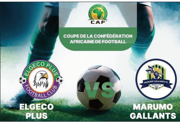
Elgeco Plus vs Marumo Gallants.