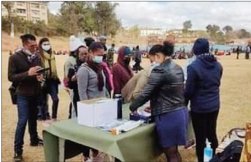
Fitsarana miaramila teny Betongolo ny volana jolay lasa teo.