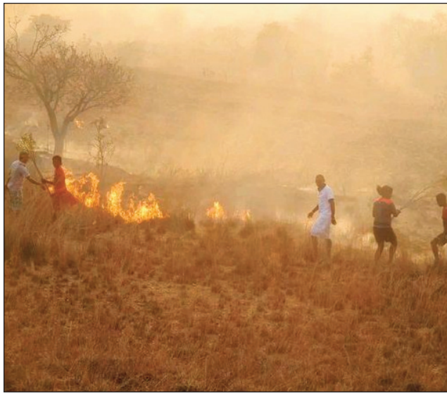
Ny firehetan'ny faritra arovana Zombitse-Vohibasia, any amin'ny distrikan'i Sakaraha faritra Atsimo Andrefana.

d'Interprétation » izay ni- fandrimbonan'ny ekipan' ny Madagascar National Parks, ny foko-nolon'An- dranovory ary ny mpitari- dia amin'izao fotoana izao. Misy aro afo 8-12 m miaro ny ala avy any ive- lany, fa tamin'ity indray mitoraka ity dia afo nisy nandrehitra tao anatin'ny faritra arovana no niseho. Mafy ny ady noho ny tsy fahampian'ny fitaovana, eo ihany koa ny halavi- ran'ny rano. Manodidina ny 80 ha eo ho eo ny ala may tao anatin'ny roa andro izay. Ankoatr'izany, may ihany koa ny farit- ralan'Ambalabe omaly ka manodidina ny 12 ha ny faritra may ary lohan' afo 3 no tsikaritra ho nita- rika izany. Niara-nientana ny fokonolona tao Andra- lamengoky notarihin'ny Cantonnement forestier an'i Sakaraha ary ny eo anivon'ny OMC Sakaraha izay tarihin'ny Chef Dis- trict. Mbola mitohy ha- trany ny famonoana afo miaraka amin'ny fitaova- na eo ampelatanan'ny any an-toerana.