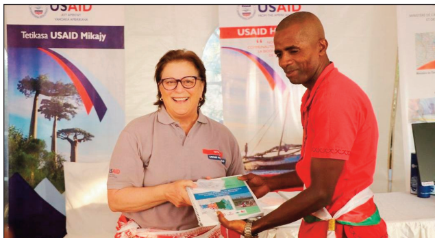
Ny Ambasadaoron'i Etazonia sy ben'ny tanàna avy amina kaominina, anisan'ny nahazo fampiasana tamin'ny Amerikana.