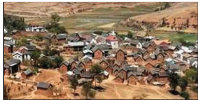
Ny tanànan'Anjeva sy ny manodidina azy.

Any amin'ny vohitra Ifandana kaominina Anjeva distri- kan'Antananarivo Avaradrano indray, no «randonnée» manaraka, na fanatanjahantena dia an-tongotra laroina fizahantany, ho karakarain'ny Ortana, na ny Ofisim-Pa- ritry ny Fizahantany amin'ny faritra Analamanga, ho tanterahana ny sabotsy 8 oktobra ho avy izao. 8,5 km ny halaviran-dalana handehan'ny mpandray anjara amin'izany hetsika ara-panatanjahantena sy fizahan- tany izany, hamakivikian'izy ireo lohasaha sy havoana ao amin'ny kaominina Anjeva. Ny fiaingana amin'izany dia any amin'ny 24 km, atsinanan'Antananarivo amin'io sabotsy 8 oktobra io. Hiakatra ny tendrombohitra Ifan- dana avy eo ireo mpandray anjara, ity tendrombohitra ity izay manana haavo 1527 m, ka hahatazanana an'Anjeva sy ny manodidina azy, hisongadina amin' izany ny fahitana ny reniranon'Ivovoka. Amin'ny 7 ora sy sasany ny fiaingan'ny mpandray anjara ho any An- jeva avy eo Antaninarenina, amin'ny 8 ora sy sasany ny fahatongavana any Anjeva ary hanombohan'ny ran- donnée. Fady henakisoa, sy tongolo gasy ary tongo- lobe ny toerana handehanana.