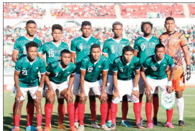
Barea Chan 2022.

Amin'ny alahady 15 janoary 2023 ho avy izao amin'ny 8 ora alina (20 h) any Constantine, no hiatrika voalohany ny ekipam-pirenen' Ghana ny Barea 2 Malagasy ao amin'ny vondrona C misy azy, eo amin'ny fifaninanana Chan Algérie 2022. Amin'ny alakamisy 19 janoary 2023 amin'ny 5 ora hariva (17 h) kosa, mbola any Constantine hatrany ny hifanandriny indray amin'i Maroc izy ireo. Farany amin'ny alatsinainy 23 janoary 2023 amin'ny 8 ora alina (20 h), no hifampitady amin'ny ekipam-pirenen'i Soudan, mbola any Constantine hatrany.