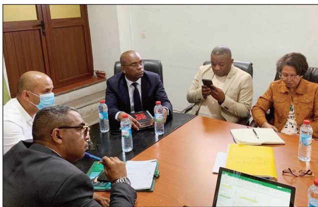
Fivorian'ny Kômity mpikarakara ny basket to Bal 2022.