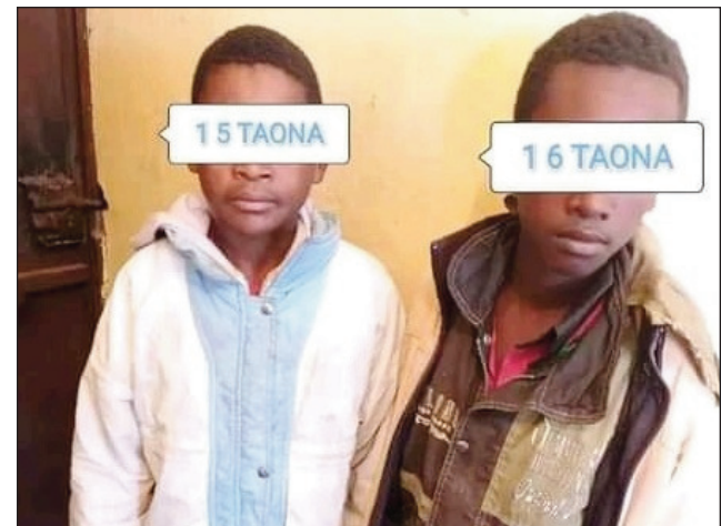
Ireo ankizilahy 2 efa mpanolana sahadry.