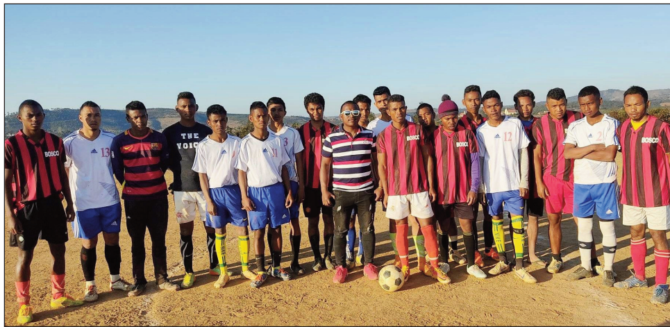
Ekipa anisan'ny mandray anjara amin'ny foot à 7 any Ambohitrolomahitsy Manjakandriana.

Coupe omby sy ondry lehilahy: Aigle Noir Maroary hikatroka amin'ny FC Sabotsy zokiny Ambohitrolomahitsy. Coupe ondry vehivavy: FC Sabotsy hifandona amin'ny FC Ambohitrolomahitsy.