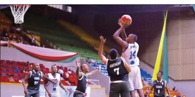
Basket N1 A lahy sy vavy.

Ny fifaninanana nasiônaly N1 A indray izao dia ny « Final four N1A Hommes » sy ny « 2ème phase N1A Dames », no hetsika manaraka eo amin'ny taranja basikety Malagasy, taorian'ny nahatontosan'ny fifaninanana Road To Bal farany teo. Amin'ny zoma 28 ôktôbra ka hatramin'ny alahady 06 nôvambra 2022 etsy amin'ireo kianja "Terrain basket (Kianja Barea)", sy ao amin'ny « Palais des Sports Mahamasina », no hanatanterahana an'ireo fifaninanana ireo. Mba hisokatra hoan'ny fifaninanana ôfisialy ihany izany noho ny farany ireo kianjana basikety marobe misy ao amin'ny kianjan'i Mahamasina ao ankehitriny.