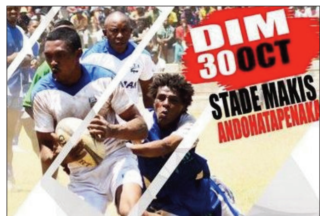
Rugby teny Andohatapenaka.