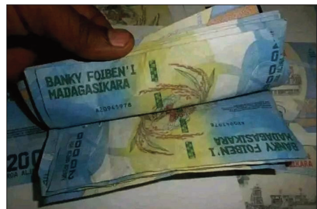
Vola Malagasy, misy olon-dratsy mahavita manao sandoka an'izany vola izany.