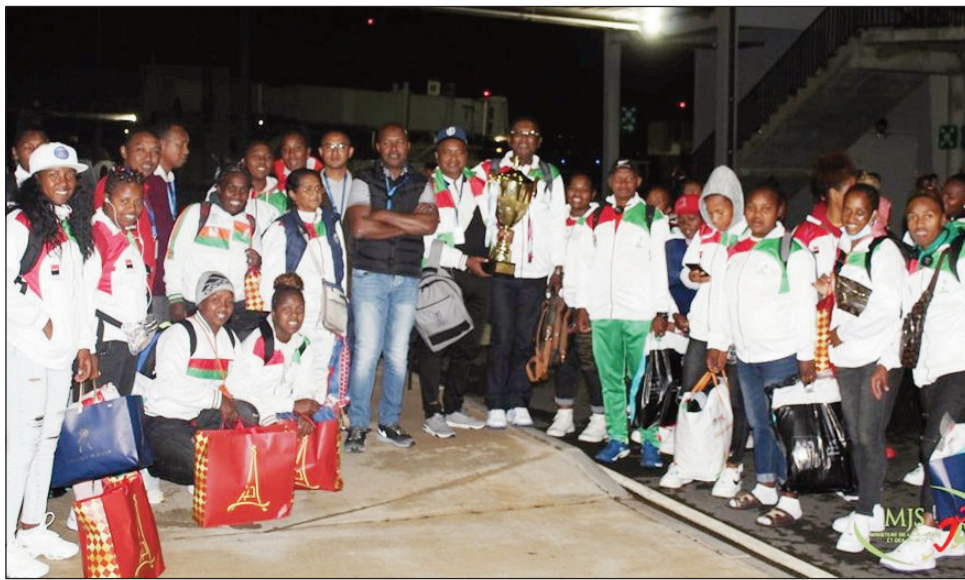
Makis Ladies XV tafaverina teny Ivato.

Tafaverina an-tanindrazana tamin'ny alatsinainy 24 ôktôbra 2022 ny delegasiôn'ny rugby Malagasy, nisy an'ireo mpilalaoan'ny Makis vehivavy, avy nia-trika sy niaro ny voninahipire-nena nandritra ny Rugby Africa Women's Cup tany Tunisie, ny 14 hatramin'ny 22 ôktôbra 2022 lasa teo. Tsiavivina fa nivoaka ho laharana voalohany tao amin'ny vondrona C nisy azy ny Makis Ladies XV, rehefa nahazoany fandresena avokoa ireo lalao roa nataony. Hiatrika ny lalao ankatoky ny famaranana hiaraka amin'ireo ekipa 4 tafavoaka laharana voalohany isam-bondrona tamin'ny Africa Cup Women Farany teo ny Makis Ladies XV, ka izay voalo-