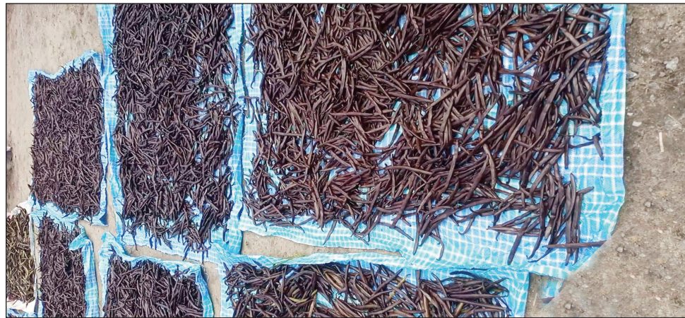
Lavanila, vokatra anisan'ny mampalaza an'i Sambava faritra Sava.

Nivoaka tamin'ny fahanginany ireo mpamokatra vokatra fanondrana lavanila any Sambava faritra Sava, volan'izy ireo mitentina hatramin'ny 2 miliara Ar, tsy nefain'ireo mpandraharaha any an-toerana. Nivondrona ny solontenan'ireo tantsaha mpamokatra lavanila any Sambava, faritra SAVA, izay nahatsiaro ho tratry ny fivadiham-pitokisana nataon'ny mpividy ny vokatr'izy ireo, ka misy amin'ireo Mpan- drahara ara toekarena