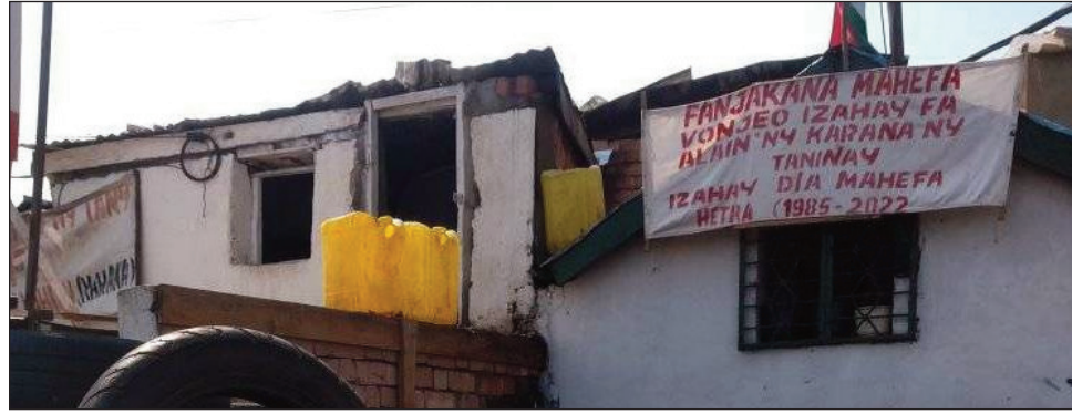
Tsy manaiky hiala amin'ny tany nohajariany nandritra ny 40 taona ireo mponina etsy Ambodivona.

Nisy mpanofa -trano handeha hiasa, ka vao lasa kelikely izy dia nirehitra ny afo. Hoy ireo fokonolona, misy namadika tamin'izy ireo, ka nifampiraharaha tamin'ilay karana, dia nanaiky ny hiala. Olona 4 izy