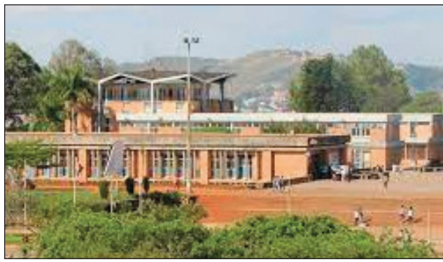
Oniversite eto Madagasikara, toeram-pampianarana ambony tsy ilaozan'olana.

Miantso ny Minisiteran'ny Fampianarana Ambony sy ny Fikarohana ara-tsiansa, izay mpiahy azy, ireto mpampianatra tsy raikitra eny amin'ny ambaratonga ambony ireto, mba handray andraikitra, sy hamaha izao olana izao. Manana ny anjara toerany amin'ny fampianarana eny amin'ny Anjerimanontolo, ireto so-