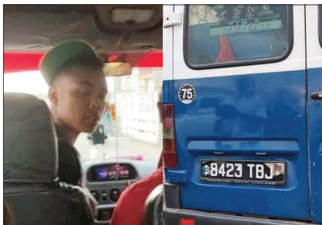
Stefa Ilay mpamily sy ny fiara nentiny, saika hihodina an-dalana.

izy ireo, ny resevera sy ny mpamily mbola nahay vava be sy be mokondoha ihany: antsoy hoy izy ireo ny manam-pahefana na i Prezida fa tsy matahotra izahay. Tena tsy nety niala mihitsy ny mpandeha ary tena niantso polisy. Avy hatrany dia nandray andraikitra ny polisy, nampiditra ilay taksibe 109 tao amin'ny Positry ny Polisy sady nasazy azy ireo sy nampandoa lamandy.