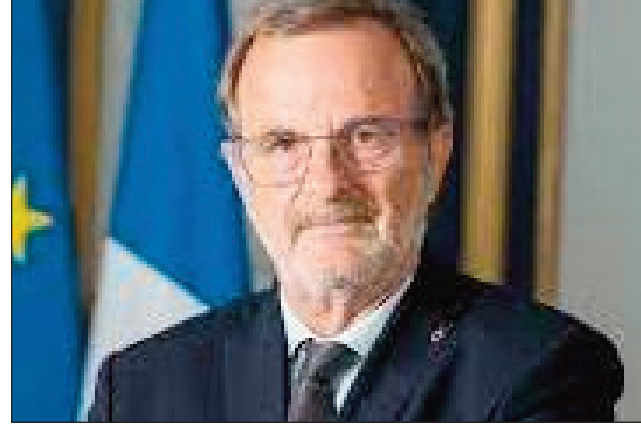
Ny ministra delege misahana ireo tany Frantsay ivelan'i Frantsa.