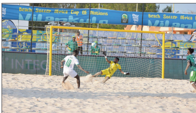
Sénégal sy ny Barea Beach Soccer.

Lavon'i Sénégal tompondaka farany tamin'ny isa 8-4 ny Barea Beach soccer, tamin'ny lalaom-bondrona fahatelo farany natrehany tamin'ny alatsinainy 24 ôktôbra 2022 lasa teo, tao amin'ny kianja "Vilankua Beach Soccer Arena" any Mozambika, eo amin'ny fifaninanana "CAN Beach Soccer Mozambique 2022". In-3 resy ny Barea Beach Soccer tamin'ity fifaninanana ity, fa efa nandresy azy avokoa na i Egypte na i Ouganda tamin'ny lalao roa voalohany nataony. Nifarana teo izany