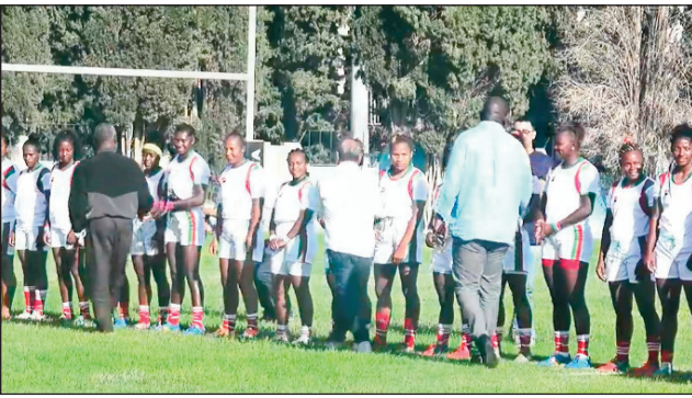
Ny Makis Ladies XV any Tunisie.

Nandravarava Sônegaly ny Makis Ladies XV tamin'ny fandraisany anjara voalohany amin'ny fifaninanana « Rugby Africa Women's Cup Qualification 2022 » tontosaina any Tunisie ankehitriny ka nandresy 34 – 25 na dia somary sahiran-kirana kely ihany aza tamin'ny farany. Efa nitarika tamin'ny isa -3 ny Makis Ladies XV teo am-pialantsasatra tamin'io lalao natao tamin'ny talata 18 ôktôbra 2022 lasa teo io tao amin'ny . kianja "El Menzah Rugby Stadium" any Tunisie. Marihana fa nanomboka tamin'ny 14 ôktôbra 2022 lasa teo ity fifaninanana ity ka tsy hifarana raha tsy amin'ny faha-22 ôktôbra 2022 ho avy izao. Amin'ny asabotsy 22 ôktôbra 2022 indray no hikatroka amin'i Tunisie mpampiantrano ny Makis Ladies XV ao amin'ny vondrona C misy azy.