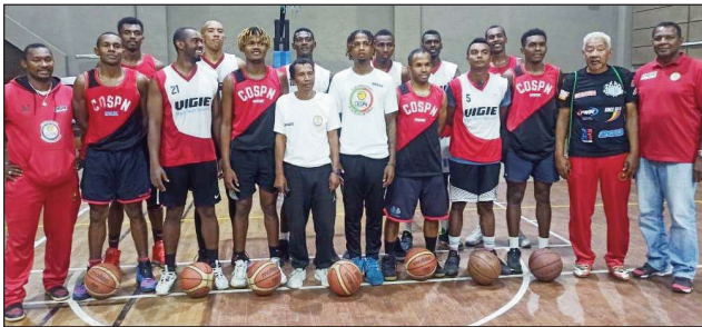
Ny Cospn Madagascar 2022.

Vonona tanteraka ny ekipan'ny Cospn solontena Malagasy amin'ny fifaninanana basikety "Road To Bal Antananarivo 2022", ho tantaraha etsy amin'ny "Palais des Sports Mahamasina" manomboka rahampitso zoma 21 ka hatramin'ny alahady 23 ôktôbra 2022 ho avy izao. Efa tonga eto Antananarivo Madagasikara avokoa ary efa vonononona ihany koa ireo ekipa 3 ao anatin'ny vondrona D hanampy ny ekipa Malagasy amin'io fifaninanana io (ny Djabal Basket Iconi COMORES, ny Roche Bois Warriors MAURICE ary ny Kenya Ports Authority KENYA). Marihana fa ireo