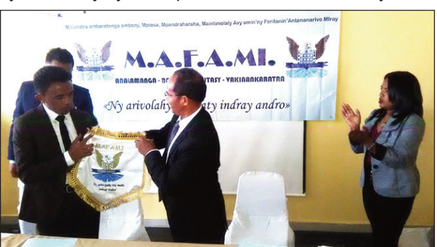
Ny famindram-pahefana teo amin'ny fitantanana ny Mafami.