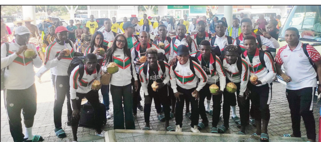
Barea Beach Soccer tonga tany Mozambique.

Efa any Mozambika ka mipetraka ao amin'ny Samara Hôtel Vilankulos Mozambique ny Barea Beach Soccer, izay hiatrika ny fifaninanana "Can Beach Soccer Mozambique 2022". Efa nitsapa ny kianja "Stade Arena Beach Soccer" hanatanterahana an'ireo lalao any Mozambika ihany koa izy ireo nanomboka afak'omaly. Fantarao ny fandaharan-dalo hatrehan'ny Barea Soccer Malagasy : Asabotsy 22 ôktôbra 2022 : 15 :30-Madagascar # Egypte, Alahady 23 ôktôbra 2022 : 12:30-Ouganda # Madagascar, Alatsinainy 24 ôktôbra 2022 : 14:00-Sénégal # Madagascar.