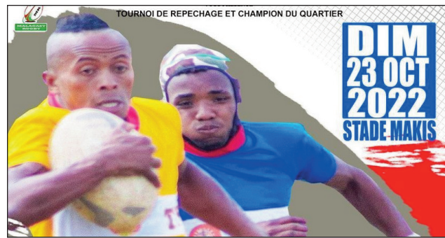
« Rugby Tounoi de Repêchage Top 20 » sy «Champion du Quartier ».

Hifampitohy miaraka eny Andohatapenaka amin'ny alahady 23 ôktôbra 2022 ho avy izao ny fifaninanana rugby « Tounoi de Repêchage Top 20 » sy ny « Champion du Quartier ». Lalao goavana miisa 4 no indray harahina amin'izany manomboka amin'ny 9 ora maraina mandra-paharivan'ny andro. Fandaharan-dalao « Tounoi de Repêchage Top 20 » : 09 :00-3F5 Ambo-ditsiry # XV Avenir Andohatapenaka, 11 :00-Fta Andavamamba # Uasc Cheminot. « Champion du Quartier » : 13 :00-Usa Ankadifotsy # Tfa Anatihazo, 15 :00-Ftm Manjakaray # Tfma Ankasina. Ho 3000 ar ny fidirana eny amin'ny Gradin ary 5000 ar eny amin'ny Tribune amin'io andro io.