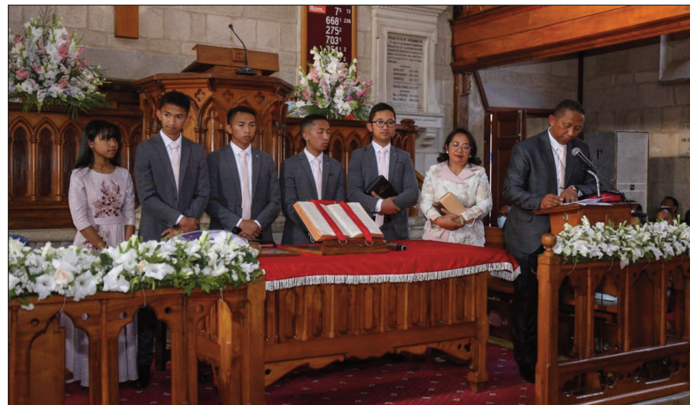
Trano may teny Anosizato ao amin'ny Boriboritany faha-4 Antananarivo omaly.