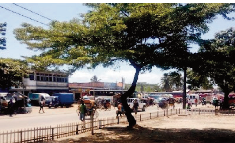
Ny tanànan'i Tanambao V, Toamasina, ahitana ny ISSPM.