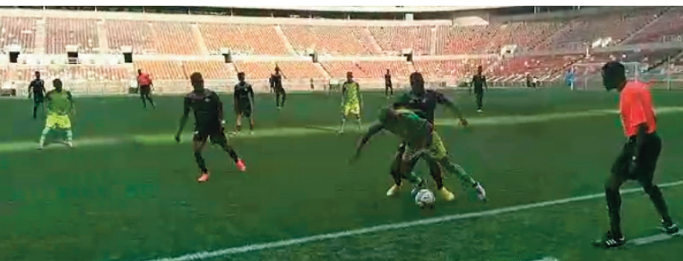
Marumo Gallants Fc sy ny Elgeco Plus nandritra ny lalao tany Afrika Atsimo.