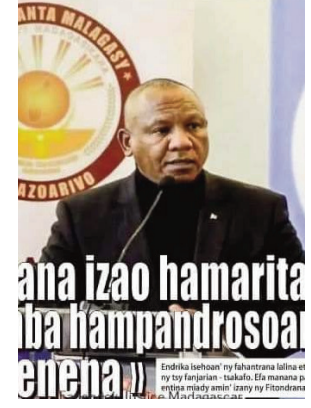
ana izao hamaritry ny fomba hampandrosoana ny firenena

Vololona Elisa : hihihiiiiii, mbola stage aloha zany lay taona maro2 efa lasa. Zao vao tena hiasa ve? Loooooza, Potika lay Firenena !