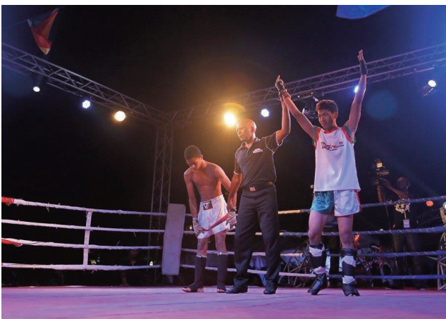
Kick Boxing Malagasy.

"Roa andro nisesy (sabotsy 15 sy alahady 16 oktobra 2022)no nanatanterahana ny fiadiana ny ho Tompondakan'i Madagasikara 2022 amin'ny taranja Kick Boxing, tetsy amin'ny "Palais des sports Mahamasina" Mpikatroka nahatratra 135 isa avy amin'ny ligim-paritra 13 (Analamanga mpampiantrano, Boeny, Atsinanana, Alaotra Mangoro, Betsiboka, Matsiatra Ambony, Fitovinany, Vatovavy, Androy, Anosy, Atsimo Andrefana, Atsimo Atsinanana ary Menabe) no nandray anjara tamin'ny fifaninanana ka ny sabotsy ny natao ny fifanint-