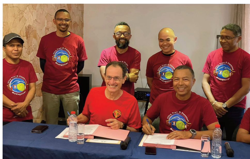
Fifanaovan-tsonia teny amin'ny Sakamanga.