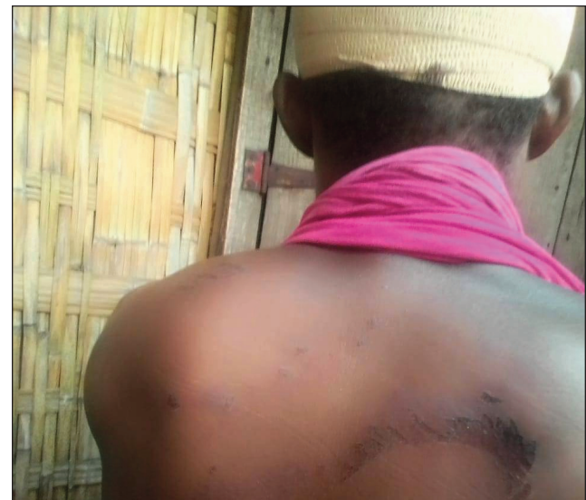
Olona nofirain'ny jiolahy ny antsany tany Antsarakofafa.