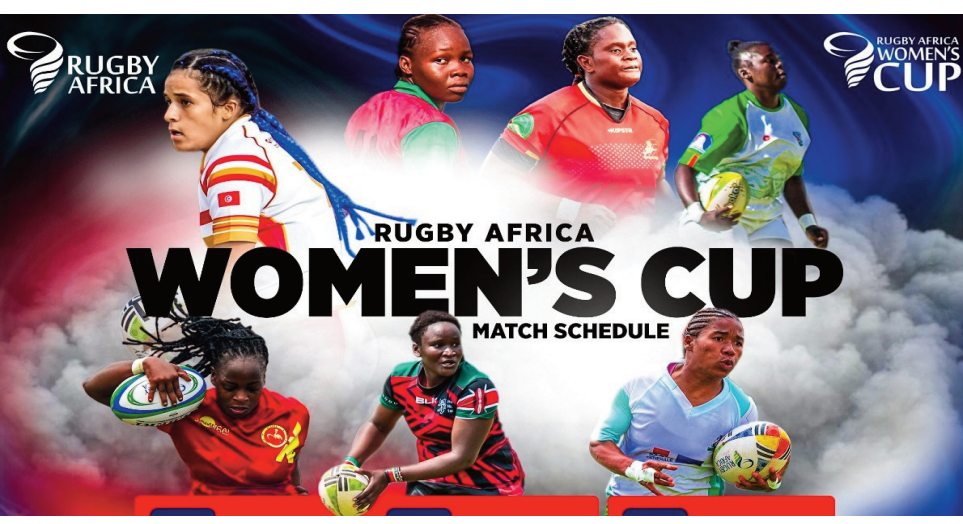
Rugby Africa Women's Cup 2022.