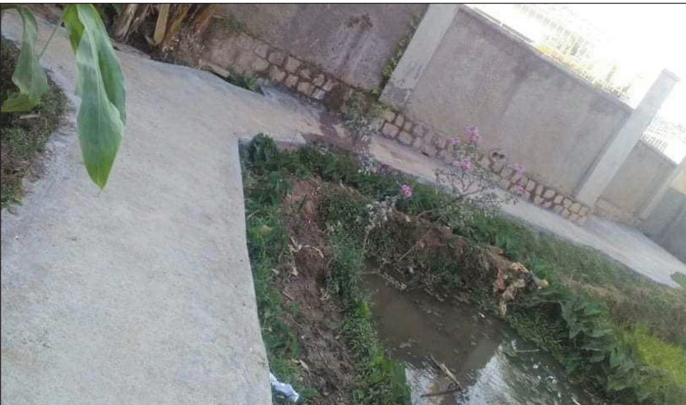
Foto-drafitrasa lalakely vitan'ny kaominina Ivato any Mandrosoa.