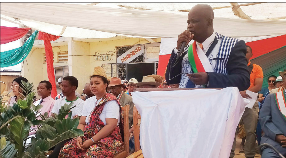
Ny fankalazana ny 14 oktobra 1958 tany Mandritsara faritra Sofia.