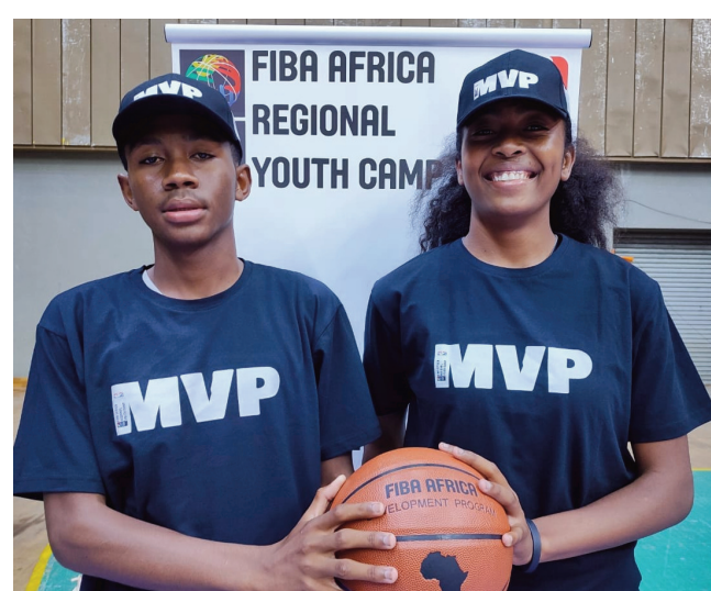
Mpandray anjara Fiba Africa Regional Youth Camp Madagascar 2022.