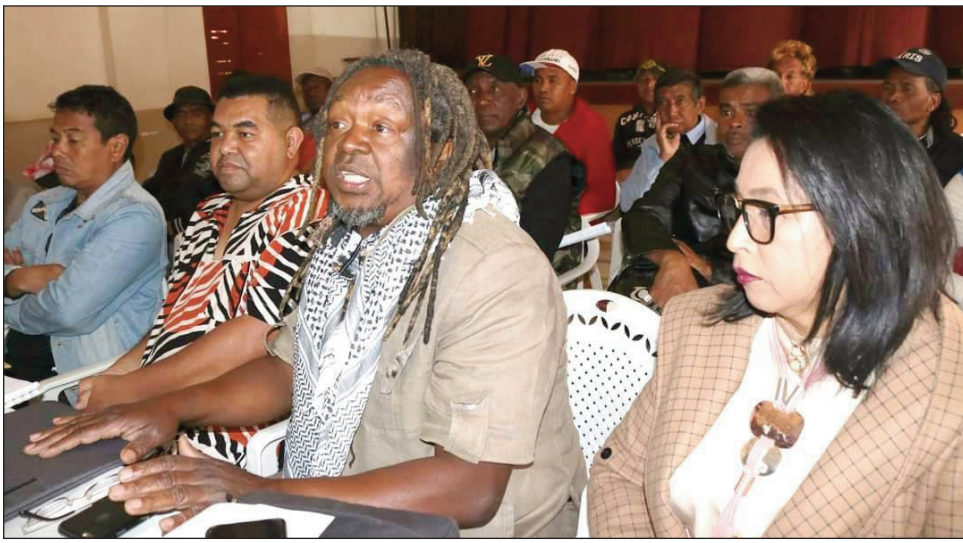
Ireo artista teny Faravohitra.

Raharaha OMDA, namalan-kira ny ministra Lalatiana, hoy ireo artista mpikambana ao amin'ity ôfisy mpiaro ny zon'ny mpamorona ity. Tsy naharitra intsony ny fianakavianben'ny mpanakanto teny Faravohitra ny alakamisy lasa teo, ka dia niantsoantso nanao hoe: Prezida o! Sarah! Sarah! misy ratsy fanahy ao! Tsinina fa ny ministry ny serasera sy kolontsaina Lalatiana Andriantogario Rakotondrazafy, no lazain'izy ireo mivantana amin'izany, manimba endrika mihitsy ka tokony sarahana amin'izy ireo, satria be loatra ny politikan'ny antoko Freedom amin'izy ireo sy ny OMDA iray manontolo amin'ny ankapobeny, ka miteraka fisaraham-bazana eo amin'ny zava-kanto sy kolontsaina mihitsy aza. Tsy mbola nandray ny tambin-karamany ireo artista hatramin'ny volana febroary, tsy voahaja ny