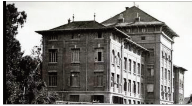
Ny Lycee Galieni, na Lycee Andohalo.

eny ifotony anefa, dia tsy mandeha araka ny tokony ho izy fa mikorontana tanteraka izany, ary raha izao no mitohy dia maro ireo tsy ho tafiditra any anaty