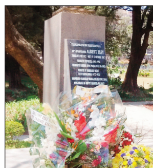
Ny tsangambaton'ny filoha Zafy Albert etsy Ambohijatovo.