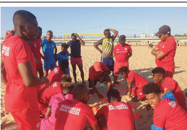
Barea Beach Soccer 2022.

Fantatra ihany koa ankehitriny ireo mpilalaon'ny Barea Beach Soccer miisa 14 voatazona mbola hanohy ny fampivondronana any Mahajanga taorian'ny sivana voalohany natao. Ampahatsiahivina fa miisa 12 izy no handrafitra ny ekipam-pirenena Malagasy amin'ny Beach Soccer hihazo an'i Mozambika. I hazany hoe mbola misy mpilalao 2 hafa hihintsana indray izany aorian'ny sivana faharoa hatao. Ny anaran'izy 14 mirahalaha : Mpiandry ha-