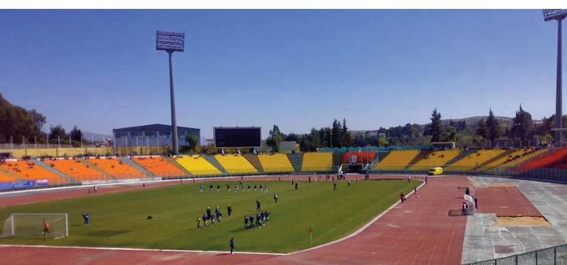
Ny Kianja Chahid Hamlaoui any Algérie.

Ao amin'ny kianja Chahid Hamlaoui any Algérie ny Barea Chan no hanao fanazarantena mandritry ny fifaninana "Chan Algérie 2022". Izy ity dia kianja nohavaozina manokana mihitsy handray ny CHAN 2022 izay hanomboka amin'ny janoary 2023 ho avy izao. Toy izao ny mombamomba an'ity kianja Chahid Hamlaoui ity : -Gazon naturel, -Manana « 3 terrains d'entraînement », -Misy « 23000 nouveaux sièges », -Manana « 26 portes d'entrée électroniques », -Ahitana « Ecran géant 84 m2 ».