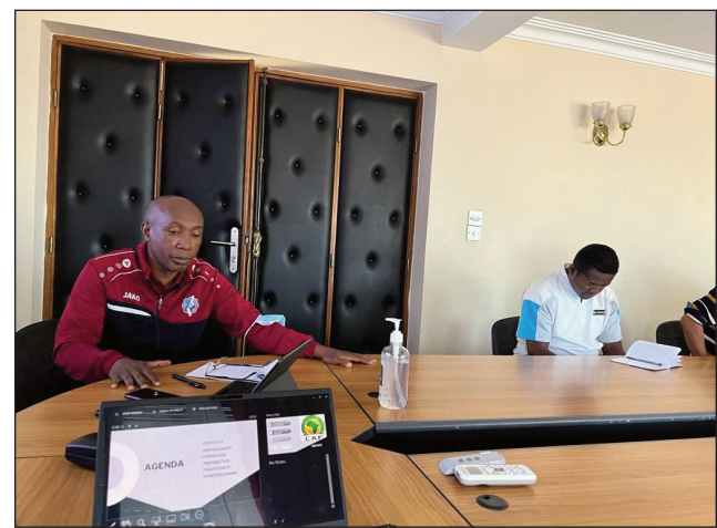
Ny DTN ao amin'ny FMF.