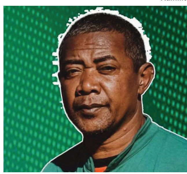
Ny hitsara lalao any Fianarantsoa.