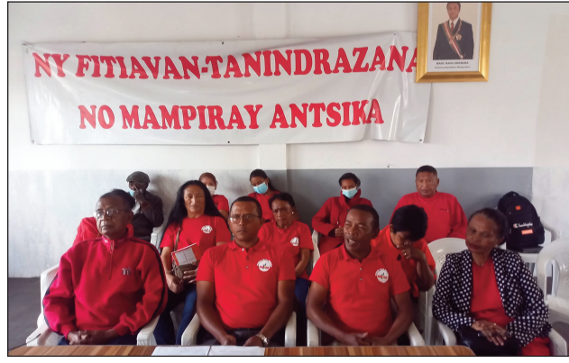
Ireo avy amin'ny RMDM Analamanga.