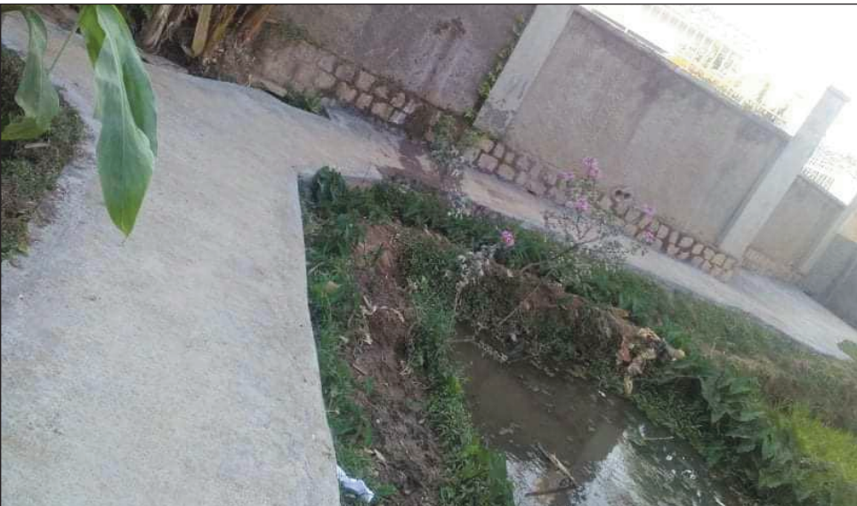
Foto-drafitrasa lalakely vitan'ny kaominina Ivato any Mandrosoa.