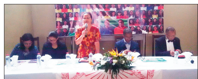
Solontena avy amin'ny tarika Ampifitia.