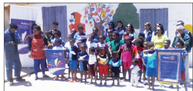
Ankizy tezaina ao amin'ny Akany Tsimoka Anosiavaratra, anisan'ny nahazo fanampiana tamin'ny Rotary Club International.