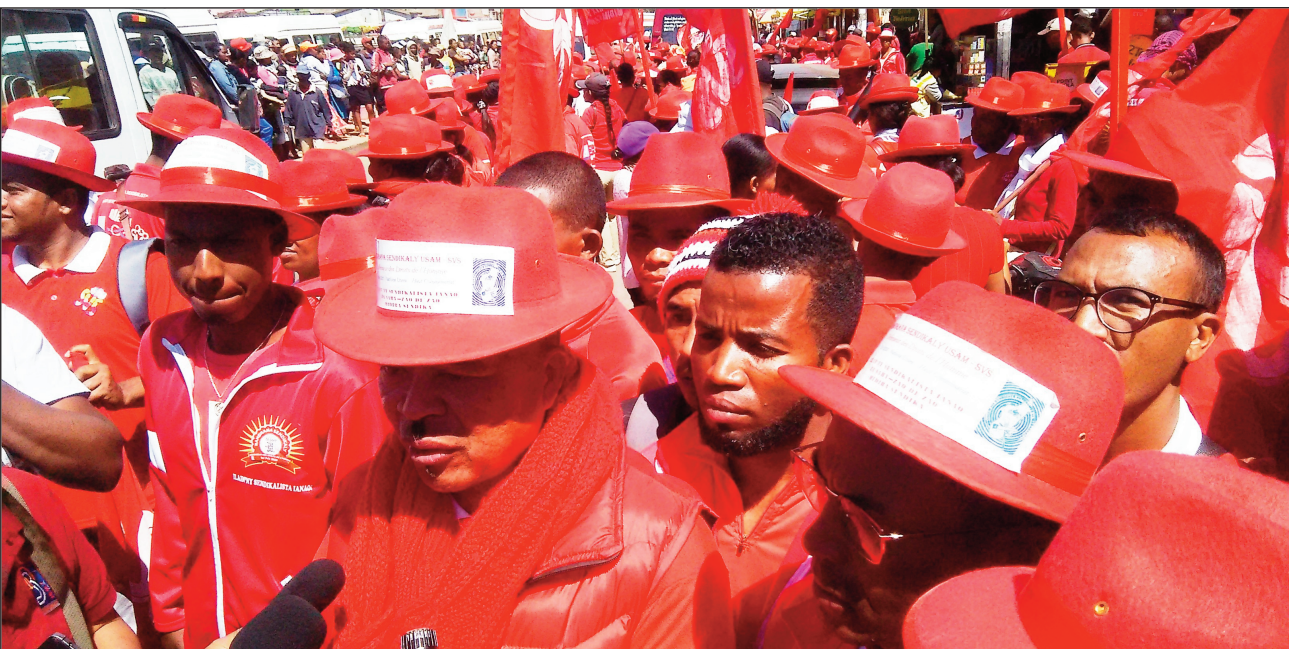
Ny diabe nataon'ny Randrana Sendikaly.