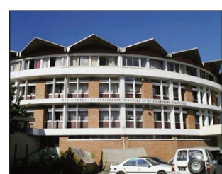
Ny ministeran'ny fanabeazam-pirenena etsy Anosy.

kosa amin'ity taom-pianarana ity: fialan-tsasatry ny Fetin'ny Olo-masina: ny 29 oktobra ka hatramin'ny 6 novambra 2022. Fialan-tsasatry ny Noely: ny 24 desambra ka hatramin'ny 8 janoary 2023. Fialan-tsasatry ny andron'ny sekoly : ny 25 febroary ka hatramin'ny 5 martsa 2023. Fialan-tsasatry ny Paska: ny 8 aprily ka hatramin'ny 23 aprily 2023. Ary ny fialan-tsasatra lehibe amin'ity taom-piana-