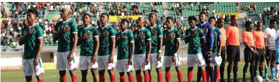
Ny Barea Chan 2022 tetsy Mahamasina.