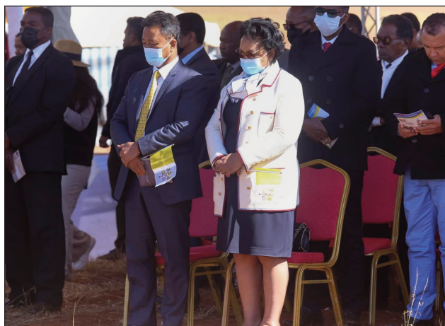
vana, tsy ilay olona no iadivantsika, fa ilay fanahy ratsy izay tonga ao anatin'ilay olona, ka mampivily ny sainy.

faha 10 tany Antsirabe ity dia nisy ny resadresaka fohy nataon'ny filoha teo aloha Marc Ravalomanana tamin'ny mpanao gazety Tokony mametraka, alohan'ny zavatra rehetra an'Andriamanitra aloha isika izay vao mipetraka mandinika dia mihaona. Rehefa avy eo mijoro amin'ny fahamarinana, fa lalana sy fahamarinana i Kristy Tandremo tsara hoy izy fa misy mitady handika vilana a ! ny olona mino an'Andriamanitra tsy mba manana fisainana hafa mihitsy. Tsy nofo aman-dra akory no hiadi-