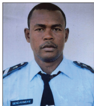
Ilay zandary lavo.