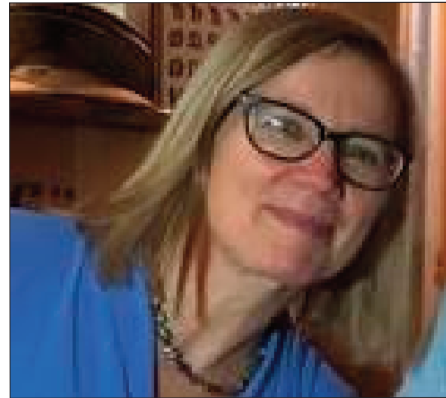
Ny Masoivoho vaovaon'ny Vondrona Eôropeanina eto Madagasikara.