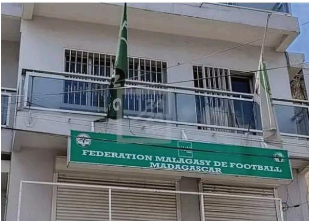
Ny Fmf eny Isoraka

Hanombokoa amin'ny 09 septambra 2022 ho avy izao ny dingana voalohany eo amin'ny fifaninanana baolina kitra sokajy D-2 nasiônaly antsoina hoe « Ligue des champions Malagasy » ankehitriny izay karakarain'ny FMF «Federation Malagasy de Football». Tsy hifarana izany dingana voalohany izany raha tsy amin'ny 18 septambra 2022 ho avy izao. Amin'ny 2 ka hatramin'ny 12 ôktôbra 2022 kosa no hanatanterahana ny dingana faha-2 amin'ity fifanintsanana. Ity. Ny dingana « Poule des AS » kosa ho