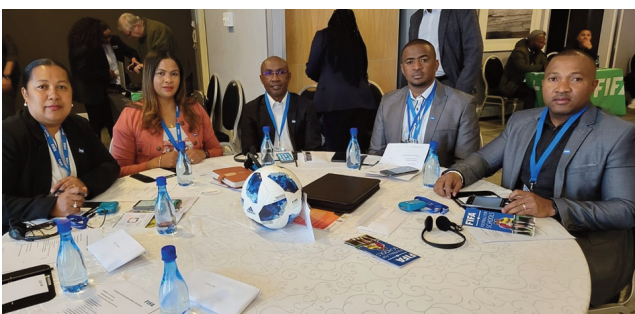
Delegasiôna Malagasy tany Afrika Atsimo.

Nifarana ny alakamisy 1 septambra 2022 teo ny seminera rejônaly nokarakarin'ny CAF "Confédération Africaine de Football" sy ny COSAFA "Conseil des Associations de Football en Afrique-Australe" nahakasika ny F4S "Football for schools" Notanterahina tao Afrika Atsimo nanomboka tamin'ny alarobia 31 aogositra 2022 lasa teo. Nankasitrahana an'izany ny delegasiôna Malagasy notari-