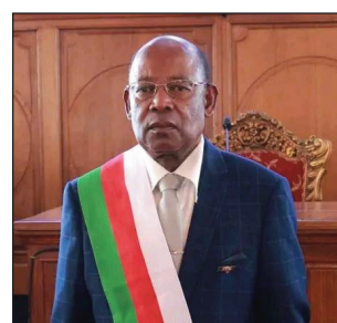
Ny senateran'i Madagasikara Fiandraza fahavelony.