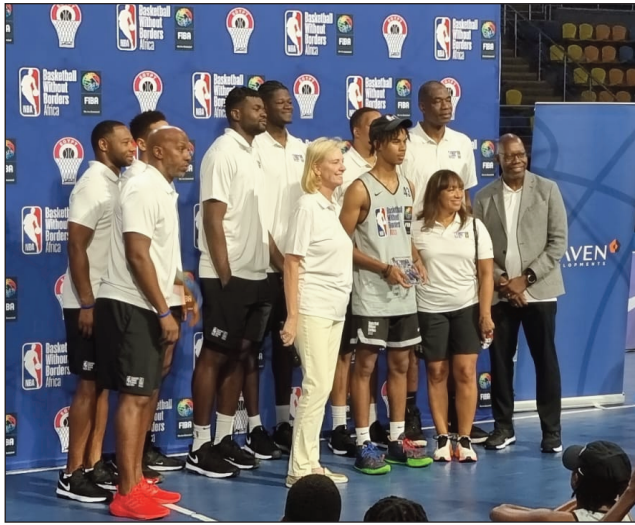
Improved Player Award » Andriatsarafara Lova kapitenin'ny Ankoay U 18 izay tafiditra ho an'

Nifarana tamin'ny alarobia 31 aogositra 2022 ny fiofanana basikety "Basketball Without Borders - BWB Africa 2022" natao tany Le Caire Egypte nandritra ny 4 andro notarihin'ireo Kintan'ny Basketball sy Mpanazatra kalaza maro avy amin'ny NBA (National Basketball Association) ary ireo Teknisiana avy amin'ny FIBA ka tao-rian'ny fiofanana, dia voasafidin'ireo mpikarakara sy mpampiofana ho "Mpi-lalao nisongadina nahitana fivoarana indrindra nandritra ny fiofana" izay nosalorana ny Mari-pankasitrahana Mendrika antsoina hoe "MIP « Most