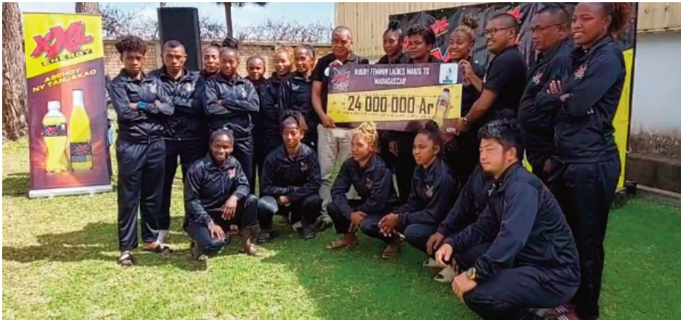
"Ladies Makis Sevens" teny Andraharo.

Amin'ny maha zava-pisotra manome tanjaka sy manohana ny fanatanjahantena azy, ny XXL dia manohana ny ekipam-pirenena Malagasy amin'ny baolina lavalava sokajy vehivavy na ny izay hanatrika ny fifaninanana iraisam-pirenena "Rugby world Sevens 2022", lalao izay karakarin'ny "Word Rugby", vondrona mifehy ny taranja baolina lavalava maneran-tany. Ny lalao dia hanomboka amin'ny 09 ka hatramin'ny 11 septambra 2022 ho avy izao any Afrika Atsimo. Taorianan'ny "Africa Women's 2022" ny volana aprily lasa teo, dia hita fa nisongadina ary nanamarika ny tantaran'ny baolina lavalava ny "Ladies Makis Sevens" ary tamin'izany no nahazoany ny tapakina hanatrehana ny lalao maneran-tany izay ho tanterahin'ha amin'ity volana ity. XXL amin'ny maha mpanohana ôfisialy ny vondrona Malagasy amin'ny lalao baolina lavalava azy dia nanolotra zava-pisotra Star sy fitaovana ara-panatjahantena XXL ary