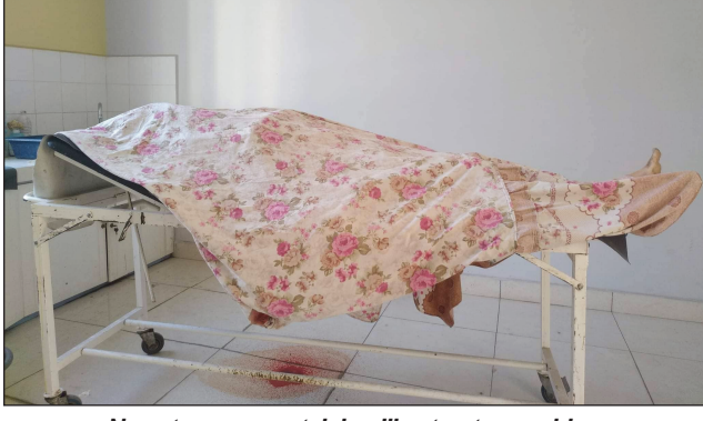
Ny vatana mangatsiakan'ilay teratany vahiny.

Mirongatra tanteraka ny asan-jiolahy ao amin'ny distrika telo ao anatin'ny fairitra Menabe dia ny distrikan'ny Morondava sy Mahabo ary Belo sur tsiribihina. Ny alin'ny alakamisy 01 Septembre hifoha zoma dia olona miisa 3 no maty voatititra basy sy voatsindron'antsy, ka teratany Armenianina mizaka ny zompirenena frantsay ny iray izay voatititra nandritra ny fanafihan-dahalo tao amin'ny fokontany Ankijabe, kaominina ambanivohitra Bemanonga distrikan'i Morondava. Dahalo maheririn'ny dimampolo mitondra basy no nanafika tao tokony tamin'ny dimy ora sasany maraina ary nitifitra ka nahafaty ilay teratany vahiny sy Zama iray sy nangorona omby tao an-tanana. Efa any antoerana manara-dia moa ny mpitandron'ny filaminana ary tamin'ny fotoana nanoratana ity lahatso-ratra ity dia efa miady