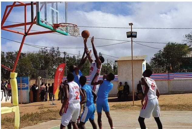
Fihaonana tany Ambovombe Androy.

Samy niatrika ny lalao 1/4-dalana avokoa omaly zoma 09 septambra 2022 ireo sokajy N1B Dames sy N1 B Hommes ary U20 Garçons miatrika ny fifaninana-pirenena basikety baolina fiadiana ny ho tompondakan'i Madagasikara 2022 eo amin'ireo sokajy telo ireo izay tontosaina ao amin'ny kianja « Gymnase couvert Ambatomena Fianarantsoa » hoan'ny N1 B Dames sy U 20 Garçons ary ao amin'ny kianja « Capj Ambovombe Androy » hoan'ny sokajy N1 B Hommes. Nihaona tamin'izany tany