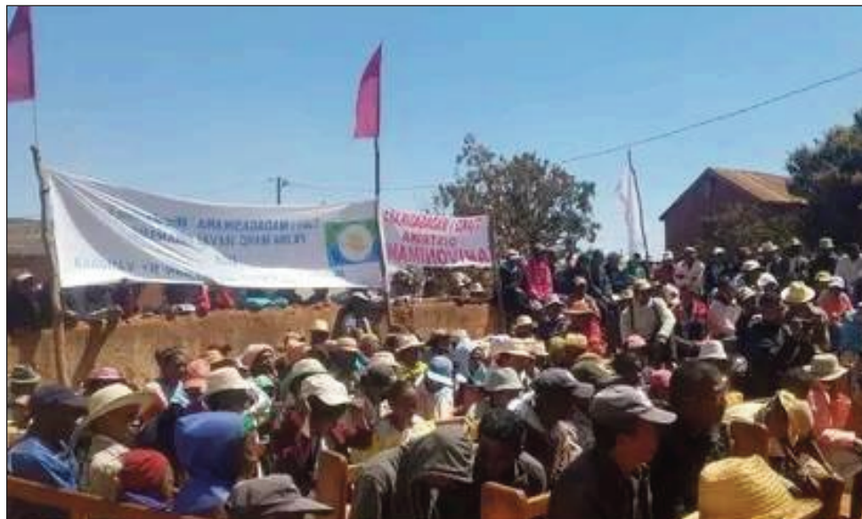
Ireo tompon'andraikitra ny fitandroana ny filaminana any Ampasifasy Mahabo miady amin'ny dahalo, mpitandro filaminana iray naratra.