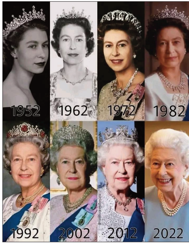
tena mifanohitra amin'ny lamina napetraky ny fitondrana Anglisy . Maniry olona ho faty hoy ny fanehoan-kevitra ny olona , mahita volana alohan'ny biby . Asa izay ho tohiny