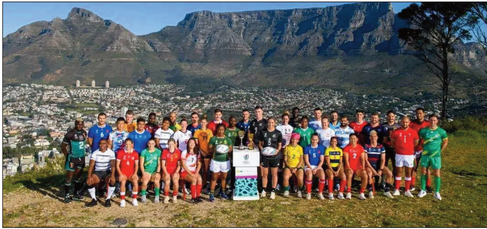
Ireo Mondialistes any Afrika Atsimo

Nanomboka any Cap Town Afrika Atsimo omaly zoma 09 septambra 2022 ny fifaninana rugby lalaovin'olona 7 fiadiana ny ho tompondaka eran-tany 2022 ka ireo firenena "40 meilleures nations féminines et masculines" no mandray anjara amin'izany ao anatin'ny "format de compétition à élimination directe". Ny sokajy lehilahy no nisantatra ny fihaonana tamin'ny tapany maraina raha nanomboka tamin'ny 1 ora atoandro (ora Malagasy) kosa ny anjaran'ny vehivavy ka nikatrohan'ny Makis à 7 s vehivavy tamin'ny vehivavy Aostriana. Hita ho efa zatra ady sady mana-