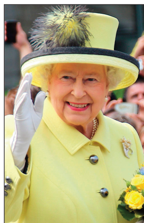
Ny Mpanjakavavy Elisabeth II fahavelony.

Niamboho afak'omaly ny Mpanjakavavy Elisabeth II, Mpanjakan'ny United Kingdom (UK) of Great Britain. Saika mitanondrika sy malahelo avokoa izao tontolo izao, noho ny fahalasanan'ity olona anisan'ny malaza indrindra eran-tany ity. Niamboho ny mpanjaka, na LONDON BRIDGE IS DOWN, izay koa no anisan'ny filazan'ny Britanika, ny mpanjaka miamboho any UK.