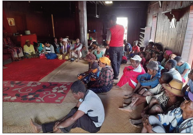
Ravalomanana . Miverina hoy ireo mponina ny tamin'ny 1947 raha ny vonomoka natao tamin'ny mponina tao Ikongo .