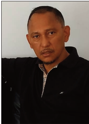
tondra faisana vahoaka ireo ihany ?