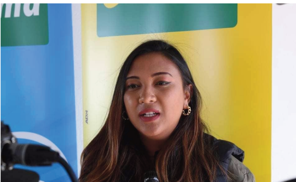
Ny tompon'andraikitra ny Telma teny Andraharo.

Mikarakara lalao (tom-bola) mety hahazoana loka lehibe miisa 8 be izao ny orinasa Telma "Sponsor officiel" amin'ny hetsika « Salon de l'Auto 2022 » andiany faha-13 izay ho tontosaina eny amin'ny CCI Ivato hanomboka amin'ny alakamisy 29 septambra ka hatramin'ny alahady 02 ôktôbra 2022 ho avy izao. Izay ho tsara vintana indrindra dia hahazo ny loka lehibe 1 o - fiara vaovao be mitentim-bidy 60 tapitrisa ariary, ny faha-2 kosa dia hahazo "véhicule à 2 roues" iray ary ny faha-3 hahazo "Smartphone haut de gamme" iray. Izany rehetra izany dia fantatra taminy tamin'ny fitafana fohy nataon'ny tompon'andraikitra ny Telma tamin'ny mpanao gazety teny amin'ny "Studio ADN" Andraharo tamin'ny alakamisy 08 septambra 2022 lasa teo. Tsotra ny fandraisana anjara amin'ny lalao dia ny fandefasana SMS ahitana