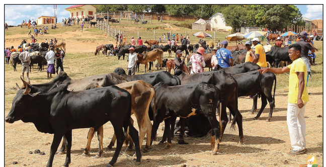
Fiompiana omby, fiharian-karena anisan'ny mbola misy olana eto amintsika.