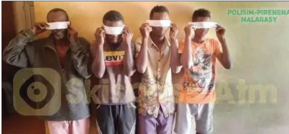
Ireo efatra mianaka voalaza fnahavita nanolana ilay zaza.

Efa biby fa tsy olona intsony raha ny zavatra niseho tany Ambilobe faritry Diana. Nisy ny fanolana nitranga tao Ambilobe izay zazavavy vao 14 taona monja, ka ny dadatoany efa-mianaka ihany no nahavanon-doza tamin'izany. Vokatry izany, bevohoka 3 volana ankehitriny ity zazavavy kely 14 taona ity. Ny zava-nisy tany an-toerana, rehefa tsy nianatra ity zazavavy ity dia nandeha tany amin'ny nenitoany. Rehefa nisy dia nalehany io nenitoany io dia nitsofoka tsirairay tao amin'ny efitranon'ilay zaza iretsy efa-mianaka be iretsy. Ni-fandimby nanolana azy. 55 taona ilay rangahy ary 25, 23 ary 19 taona ireo zanany lahy. Mba nitantara ny nanjo azy tamin'ny