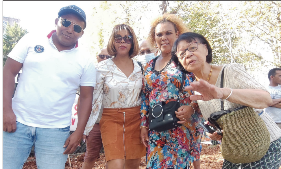
Ny «Salon du Business» izay nisokatra omaly tany Toamasina.