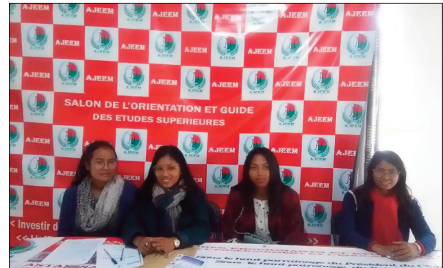
Ireo mpikarakara ny hetsika.