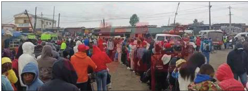
Tomemy olona ny toeram-piantsonana Fasan'ny Karana.

T sy maharaka ny fiara fitaterana mankany Antsirabe renivohitry ny faritra Vakinankaratra amin'izao fotoana, noho ny fahamaroan'ny olona mpandeha mankany. Ny antony dia noho ny fihaonamben'ny tanora katolika, na ny JMJ Mada X, hatao any an-toerana hanomboka ny 30 aogositra ho avy izao, fa maro koa ny mpiala sasatra misafidy iny faritra Vakinankaratra iny amin'izao famaramparanana ny fotoam-pialan-tsasatra izao, na mbola mangatsiaka aza Antsirabe, ary eo koa ireo famadihan-drazana fomba fanao Malagasy,