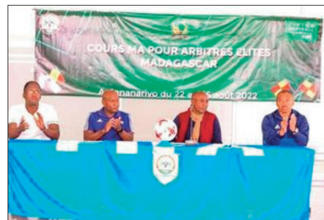
Fanokafana ny « Cours Ma arbitre Elites » teny Vontovorona.