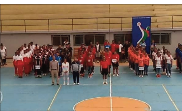
Handball « Minimes » sy « Juniors » any Fianarantsoa.

Any Fianarantsoa no hanatanterahana ny ny « Championnats nationaux 2022 de « Hand ball » sokajy « Minimes » sy « Juniors » ka notanterahina tao amin'ny kianja mitafon'Ambatomena, tamin'ny asabotsy 20 aogositra 2022 lasa teo, ny fanokafana ara-pomba ôfisialy an'izany. Efa nanomboka tamin'ny alakamisy 18 aogositra 2022 lasa teo kosa ny fifaninana ka haharitra hatramin'ny sabotsy 27 aogositra 2022 ho avy izao ary miditra amin'ny andro faha-6 ny fifaninana