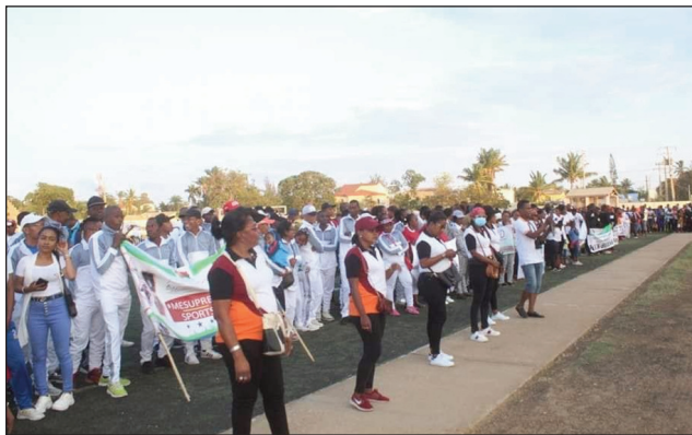
Fanokafana ny fifaninanana Nasiônaly ASIEF 2022

Mpiasam-panjakana mahatratra 12000 isa no tonga any Toliara renivohitry ny masoandro miatrika ny fifaninanana Nasiônaly ASIEF 2022 izay tanterahina ny 20 aogositra ka hatramin'ny 04 septambra 2022 ho avy izao. Nosokafana ôfisialy tamin'ny sabotsy 20 aogositra 2022 lasa teo tao amin'ny Kianja Maître Kira Andaboly Toliara ny fifaninanana ka tonga nanome voninahitra izany ny Minisitryny Tanora sy ny Fanatanjahantena notronon'ny Filohan'ny Antenimeram-pirenena sy ny