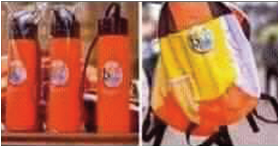
Ireo kitapo sy gourds mahabe resaka.

Mbola resabe hatramin'izao ny momba ireo kits: kitapo sy gourds, natolotra ho an'ireo tanora manerana ny Nosy, handray anjara amin'ny JMJ Mada X, hatao any Antsirabe faritra Vakinankaratra hanomboka ny 30 aogositra ho avy izao, ka tsy hifarana raha tsy ny 04 septambra. Marina fa ny tena kristiana tsy mandà fanomezana araka ny fanazavana efa nomen'ireo tompon'andraikitra anisan'ny mikarakara ity fihaonamben'ny tanora katôlika ity, fa misy tsy mazava ny momba ny nividianana ireo kits: kitapo sy gourds ireo. Araka ny loharanom-baovao marimopototra mantsy, efa nakana 60000 Ar avy, ireo mpandray anjara rehetra tamin'ity JMJ Mada andiany faha- 10 ity, ka ao anatin'izany ny vidin'ny kits rehetra mandritra ny hetsika, ny kits izay hahitana kitapo sy gourds, boky momba ny JMJ mada, ny programa, ny chapelet,... Ao anatin'io latsakemboka efa nataon'