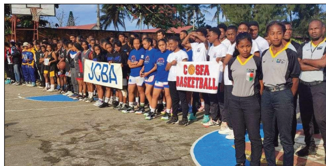
Fanokafana basikety U 16 tany Taolagnaro

Taorianan'ny fanatanterahana ny Afrobasket U 18 farany teo teto amintsika dia "Championnats Nationaux de basket" miisa 3 miavaka tsara no indray tanterahina miaraka any amin'ny Faritra telo eto Madagasikara. Ao ny "Championnats Nationaux U 14" zazalahy sy zazavavy izay tanterahina any amin'ny kianja bika Tsiroanomandidy Faritra Bongolava nanomboka tamin'ny asabotsy 20 aogositra 2022 lasa teo ka tsy hifarana raha tsy amin'ny alahady 28 aogositra 2022 ho avy izao. Ekipa zazalahy miisa 34 nozaraina ho vondrona 7 ary ekipa zazavavy miisa 24 noza-