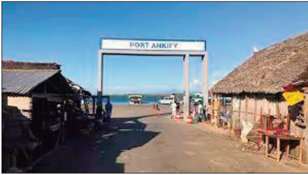
Seranan-tsambon'Ankify Ambanja, anisan'ny tantanan'ny APMF.