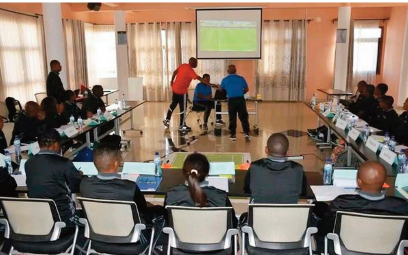
« Cours MA Arbitres Elites ».