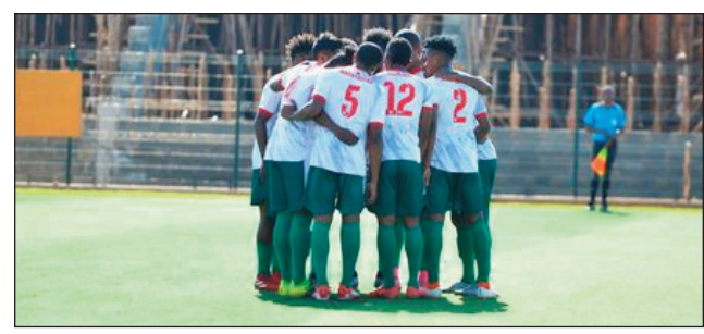
Barea Chan tetsy amin'ny By Pass.