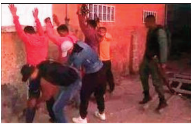
Ireo olon-dratsy voasambotry ny polisim-pirenena.

Nanao be midina tany anaty elakelantano afak'omaly alina ny polisim-pirenena, tao ireo nanao fanamiana, nisy ihany koa ireo nanao akanjo sivily. Vokany, olona miisa 58 no voasambotr'izy ireo nandritra ny indray alina monja io tao Anosibe sy ny manodidina, ao amin'ny Boriboritany faha-4. Tao ireo tratra nitondra antsy lava, tao ihany koa ireo nitondra entana avy nangalarina, niampy ireo tsy fanarahan-dalana maro samihafa. Ho an'ireo