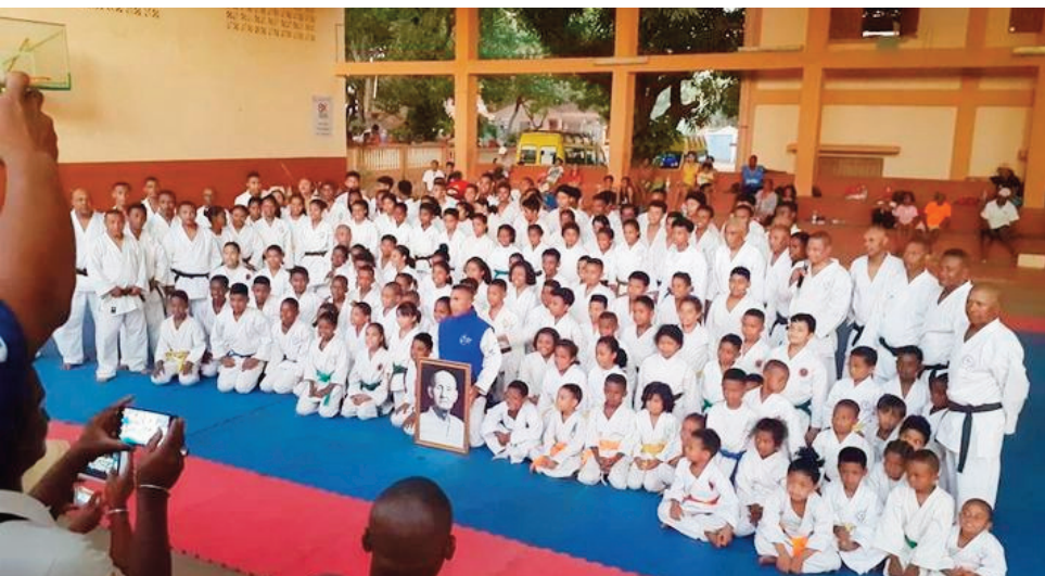
«Karaté Style Wado-ryu» tany Mahajanga.

Nisy dingana telo no tantanterahina tamin'izany :