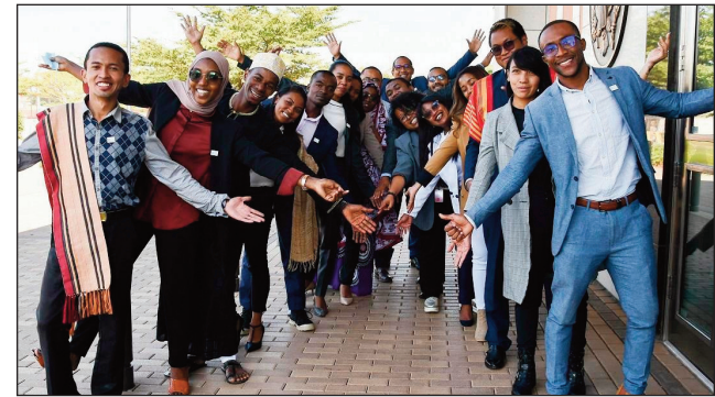
Tanora, efa nahazo vatsim-piofanana, Yali Mandela Washington.