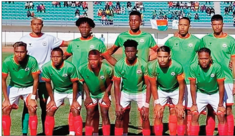
Barea U23, 2022.

Vita tamin'ny 18 aogositra 2022 lasa teo ny antsapaka amin'ny fifanintanana « Qualification U23 », hahazoana matrika ny CAN U23 ho tontosaina any Maroc. Fantatra tamin'izany, va hiatrika ny dingana voalohany hifanandrina amin'i Seychelles amin'ny 19-27 septambra 2022 ny Barea U23 ka aty Madagasikara ny lalao mandroso amin'izany. Raha tafita amin'izany dingana voalohany izany kosa ny Barea dia hiatrika ny ekipam-pirenena U23 Gabonaise eo amin'ny dingana faha-2, izay ho tontosaina amin'ny 21-30 oktobra 2022. Raha mbo-la tafita amin'izany dingana izany dia hifanandrina amin'i Angola/ Namibi vs Cameroun, eo amin'ny dingana faha-3, izay ho tontosaina amin'ny 20-28 martsa 2023.