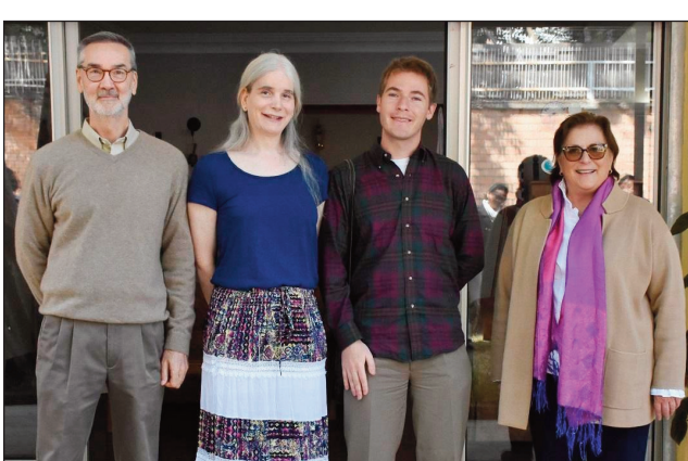
Ireo mpilatsaka an-tsitrapo Amerikana, miverina miasa eto amintsika (afovoany).

Miverina miasa eto Madagasikara indray ireo mpilatsaka an-tsitrapo amin'ny Peace Corps Amerikana. Noraisin'ny Peace Corps tamin'ny fomba ofisialy ireo mpilatsaka an-tsitrapo roa, izay tonga eto Madagasikara ary nanao ny fianianany mia-lohina ny handraisany ny asany tamin'ny talata, teo anatrehan'ny Ambasadaoro Claire A. Pierangelo, sy ny Talen'ny Peace Corps eto Madagasikara Brett Coleman. Ireo mpilatsaka an-tsitrapo ireo dia isan'ireo tsy maintsy nandao an'i Madagasikara tamin'ny taona 2020 vokatry ny valan'aretina Covid-19. Tonga teto Antananarivo izy ireo tamin'ny fiandohan'ity volana ity ary namerina nanamafy ny fahaizany teny malagasy indray, tao anatin'ny tapa-bolana ahafahany mandray ny asa maha-mpampianatra teny anglisy azy ireo any amin'ny sekoly ambaratonga faharoa. Niarahaba ireo mpilatsaka an-tsitrapo ireo ny Ambasadaoro Pierangelo, sady nisaotra ireo mpiasa ao amin'ny Peace Corps. Nasongadiny ny mahazava-dehibe ny fianianana izay ataon'ireo mpi-