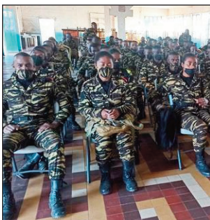
Ireo mpianatra ho zandary niofana.