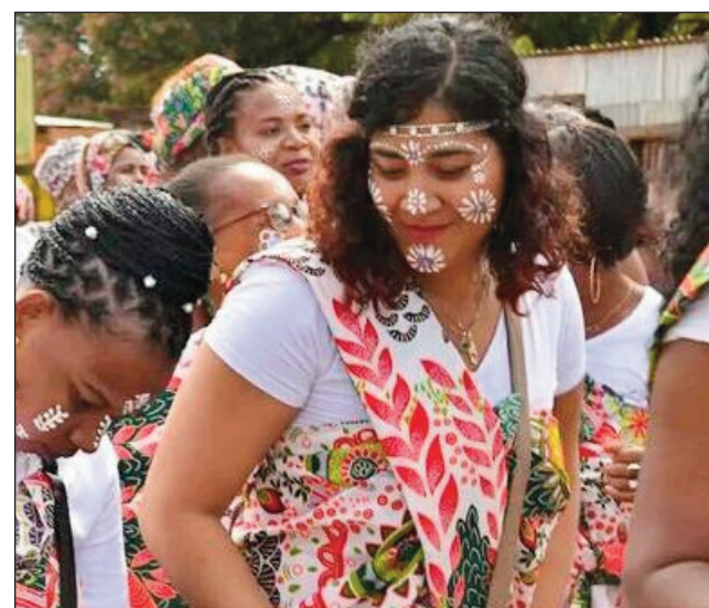
Vadina polisy sy polisy vehivavy any Antsiranana.