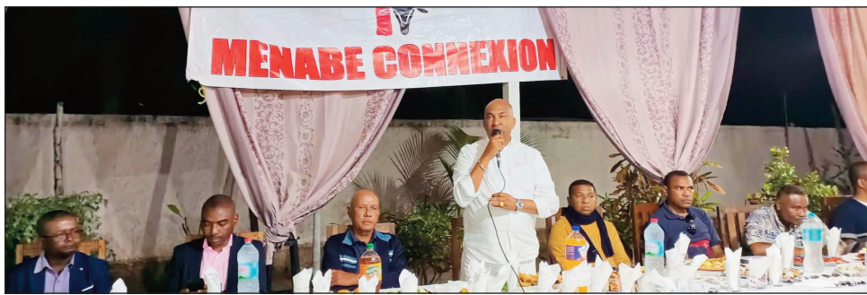
Ireo avy amin'ny Menabe Connexion.

Ny Menabe Connexion dia fikambanana naorin'andriamatoa Hawel Mamod'Ali, tamin'ny alalan'ny fampivondronana ireo zanaky ny faritra Menabe miparitaka manerana ny vazan-tany, tamin'ny alalan'ny connexion ary misy ny hetsika Jeux de Menabe, izay karakarain'izy ireo, notanterahina ny faha-12 sy 13 ary 14 Aogositra lasa teo ny andiany faharoa, tamin'ny hetsika izay nokarakarain'izy ireo izay. Nahitana hetsika ara-panatanjahantena sy kolontsaina maro isan-karazany, izay maimaimpoana avokoa, teo koa ny dinidinika narahina ady hevitra, ho fampandrosoana ny fari-tratra Menabe, niresahina