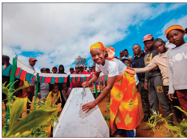
Rano fisotro madio avy amin'ny Amerikana any amin'ny faritra Atsimo Atsinanana.

N ampiditra rano fisotro madio sy fotodrafitrasa fidiovana amin'ny faritra ambanivohitra ny Ambasadin'i Etazonia eto amintsika. Maherin'ny 8.000 ireo mpisitrika izany amin'ny faritra afovoan-tany sy atsimo atsinanana. Nitokana rafi-pamokarana rano madio ho fanatsarana ny fahasalaman'ny mponina maherin'ny 8.000 ny Sampandraharaha Amerikanina misahana ny Fampandrosoana Iraisampirenena na USAID, ny herinandro lasa teo, tao amin'ny kaominina anankiroa tsy nisitraka rano afovoan-tany sy atsimo atsinanana'i Madagasikara. Notokanana tamin'ny fomba ofisialy ny 12 aogositra lasa teo tao amin'ny kaominina Andonabe ao amin'ny Faritra Vatovavy sy Andrainjato ao amin'ny Faritra Matsiatra Ambony ireo fotodrafitrasa vaovao sy nohatsary ireo. Anisan'izany ny tohadran-vaovao ho an'ny fanangan-drano, ireo fitaovana fanadiovana sy fitahiriana rano, ary koa ireo barika sy fantsona mampifandray ireo singampamokaran-drano maro samihafa. Tafiditra ao anatin'izany koa ny toerana fandroana ho an'ny daholobe, ny lava-piringa, ny toerana fanasan-tanana, ireo tobim-patsakana madinidinika, ary ny fantson-drano mampifandray ny rafi-pamokaran-drano amin'ny sekoly sy ny tobim-pahasalamana vitsivitsy. Ireo kaominina