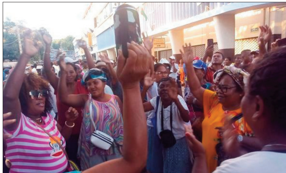
Nilaharana, tsy nisy ny solika tany Mahajanga sy Ambondromamy afak'omaly.