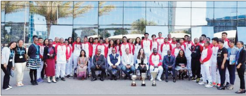
Ireo Ankoay U18 zatovolahy sy vavy, teny amin'ny biraon'ny Firenena Mikambana teny Andraharo.

Noraisin'ny fandaharan'asan'ny Firenena Mikambana misahana ny Fampandrosoana ( Nations Unies - UN), tetsy amin'ny foibentoerany etsy Andraharo ireo mpilalao na amin'ny Ekipam-pirenena Malagasy U18 , ANKOAY Zatovolahy sy Zatovovavy, tamin'ny talata 16 aogositra 2022 lasa teo.