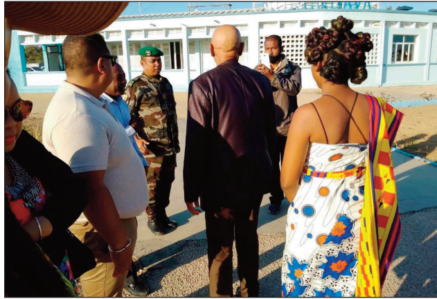
Ny filohan'ny HCC, tonga tany Morondava.

Ny alakamisy faha-11 Aogositra 2022 teo dia tonga tany Morondava faritra Menabe ny filohan'ny HCC (Fitsarana Avo momba ny Lalampirenana), Florent Rakotoarisoa, rehefa nahazo fanasana hatrika ny fitokanana ny Centre Eco-Touristique du Menabe, sy ny fanombohan'ny Jeux du Menabe, izay karakarain'ny Menabe connexion. Toy ny mahazatra moa dia rehefa misy filohana andrimpanjaka na mpikambana ao amin'ny governemanta tonga any an-toerana dia tonga eny amin'ny seranam-piaramanidina avokoa ireo solontenam-panjakana ao amin'ny renivohitry ny faritra Menabe mandray sy manome voninahitra ny vahiny. Ny nahagaga anefa tamin'ity dia tsy nisy afa-tsy manamboninahitra iray no tonga nitsena azy teny amin'ny seranam-piaramanidina, eny fa na dia ny ben'ny tanànan'ny kaominina ambonivohitr'i Morondava aza dia tsy hita teny. Ny fanadihadiana izay natao, no nahalalana fa ny sasany tamin'ireo STD dia niaraka tamin'ny governoran'ny faritra Menabe namonjy ny famaranana ny Fitampoha tany Belo sur Tsiribihina ary ny sasany kosa niaraka tamin'ny Prefet, namonjy lanonam-pianakavian'ny minisitry Tinoka Roberto tany Mandabe, nefa na dia izany aza dia tokony ho nandefa solontena izy ireo, fa ahian'ny maro ho noho Andriamatoa Hawel no nanasa azy, no tsy nanotronan'ireo olom-panjakana ity filohana andrim-panjakana ity, noho ny tsy fifankahazoana misy