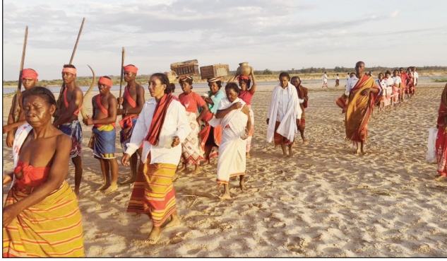
Ny Fitampoha tany Belo Tsiribihina tamin'ity taona ity.

Tontosa soa amantsara ny Fitampoha 2022, izay natao tao amin'ny distrikan'i Belo sur Tsiribihina faritra Menabe, ny faha-4 Aogositra, ka hatramin'ny faha-12 Aogositra lasa teo. Omby miisa 19 no novonoina nandritran'izany fotoana izany. Saika nahatonga solontena tety avokoa ny Ampanjaka rehetra manerana ny Nosy, izay notarihan'ny avy ao amin'ny fikambanan'ny Aantenimieran'Olobe eto Madagasikara (AOM). Ny alakamisy vao nisy solontenam-panjakana foibe tonga tany an-toerana rehefa nisy ny antso avo tamin'ny haino amanjery sy ny tambazotra sosialy ary ny gazety, ka tonga tany an-toerana Andriamatoa Minisitry ny Jono sy ny Toekarena manga MAHATANTE Tsimanaoraty Paubert, raha solontena kosa no nalefan-dramatoa minisitry ny ponina izay zanak'i Menabe, no sady lehibe tao Belo sur Tsiribihina. Toy izany koa tsy tonga ramatoa minisitry ny serasera sy ny kolontsaina, izay voakasik'ity Fitampoha ity, satria dia isan'ny harenan'ny kolontsina Malagasy ny Fitampoha. Nivoitra nandritra ny lahatenin'ny Minisitry ny Jono sy ny Toekarena manga MAHATANTE Tsimanaoraty Paubert, fa nirahin'ny filoham-pire-