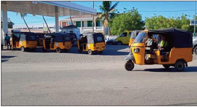
Filahrana solika amin'ny RN4 any Ambondromamy faritra Boeny.

Sahirana amin'izao fotoana ireo mifamoivovy mampiasa ny lalampirenana faha-4 (RN4), ny lalampirenana faha-7 (RN7), ny lalampirenana faha-34 (RN34) noho ny tsy fahampian'ny tahirin-tsolika amin'ny toerana mihazo an'i Mahajanga, mihazo an'Antsirabe, ny mihazo an'i Morondava. Be ireo tafahitsoka any an-toerana noho ny tsy fisian'ny solika, toy ny gazoala, na misy aza dia filaharambe izany. Nijery vahaolana ny tompon'andraikitra ny amin'ny ministeran'ny An-