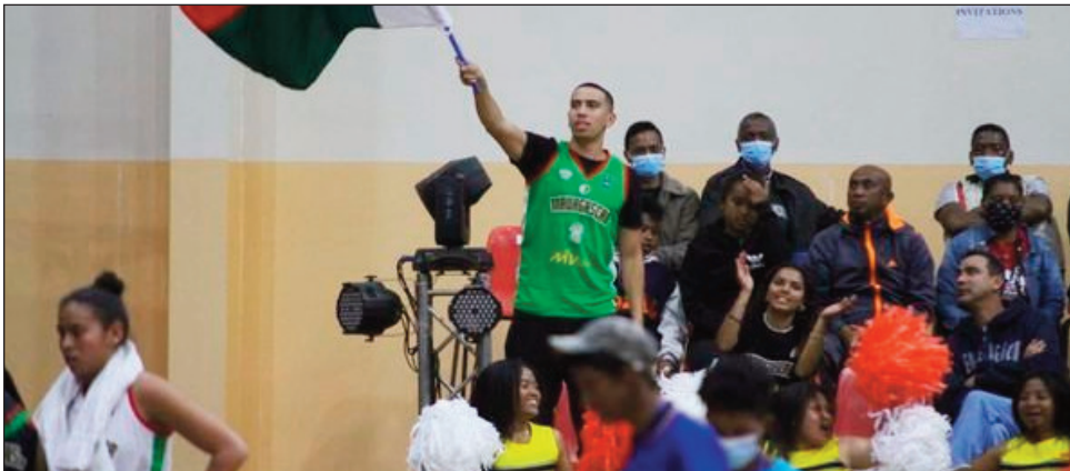
Mpijery ny Afrobasket U18.

N a dia samy resy avokoa aza ireo ekipa Ankoay lehilahy sy vehivavy tamin'ny lalao nataony avy, tamin'ny alatsinainy 8 aogositra 2022, ny Ankoay vehivavy lavon'i Mali tamin'ny isa 87-40 ary ny Ankoay lehilahy kosa dia resin'i Sé-négâl tamin'ny isa 70-62, dia samy tafita niatrika ny lalao 1/4-dalana notontosaina omaly alarobia 10 aogositra avokoa izy ireo. Tamin'ireo lalao 2 voalohany natrehan'izy ireo avy kosa, teto Antananarivo ny Ankoay U18 lehilahy dia nandresy ny Béninois « 102 - 41 », sy nandresy ny Algérien 76 - 59. Tany Antsirabe kosa ny Ankoay U18 vehivavy dia resin'i Ouganda « 54 - 59 » ary nandresy an'i Algérie « 59 - 43 ».