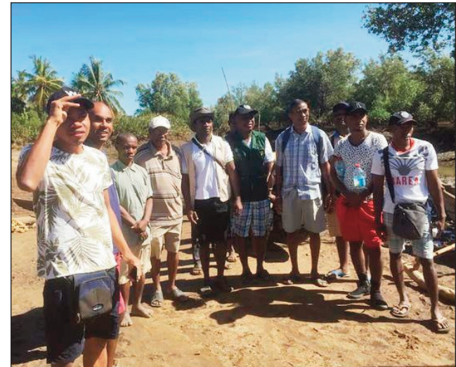
Fikarohana momba ny ala honko any Antsohihy.