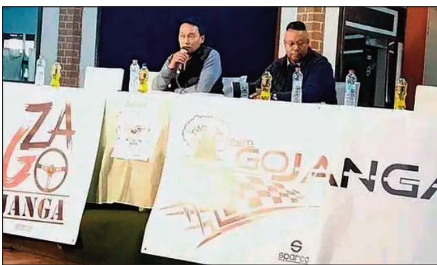
Rallye vacances 2022.

Ho tontosaina any Mahajanga toy ny mahazatra, amin'ny 12, 13 ary 14 aogositra 2022, ny fifaninana fanamoriana fiarakodia "Rallye du Boeny 16e édition", ka amin'ity indray mitoraka ity dia ny Team Go Janga irery, miaraka amin'ny fanotronan'ireo mpiara-miombon'antoka marobe tarihan'ny T2R "Team Raharinosy Racin" sy ny "Région Boeny" ary ny Jovena no hikaraka an'izany. Hahatratra 230 km ny totalin'ny halaviran-dalana ho dia-vio'ireo mpifaninana amin'ity rallye ity, ka mahatratra 17 mirefy 126 km ny dingana manokana ho