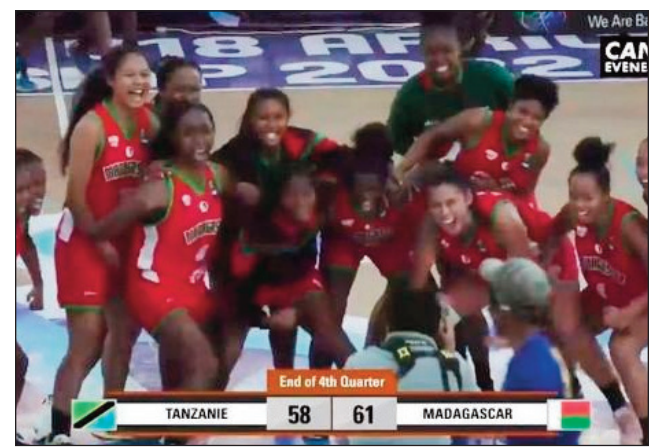
Ny hafaliana teo amin'ny Ankoay vehivavy teo amin'ny fifaranan'ny lalao omaly, tany Vatofotsy Antsirabe.