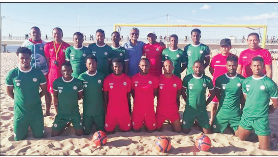
Barea Beach Soccer 2022.

ho tanterahina amin'ny 21 hatramin'ny 30 ôktôbra ho avy izao izany fifaninana izany. Noraisin'ny fitondram-panjakana sy noharahabainy tany Mahajanga tamin'ny 9 aogositra 2022 teo izy ireo, ka notolorana fankasitrahana manokana. Mbola nampantantena fampianana hanomanana an'izany dingana famaranana ho atrehana izany izy ireo ary koa tsiraka ho an'ireo mpilalao tsirairay, ho fiomanan' izy ireo na ara-batana na ara-tsaina mandrapahatongan'ny CAN Mozambique 2022, izay ho atao ny volana Oktôbra izao.