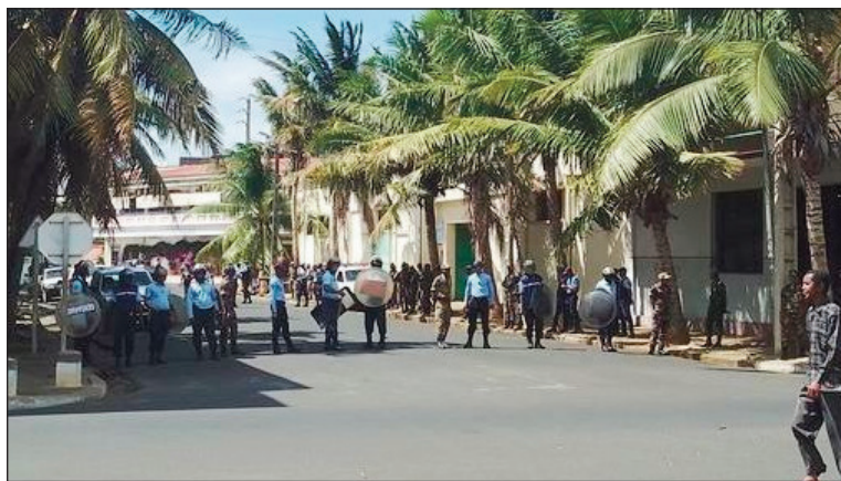
Ny herim-pamoretan-dRajoelina tany Antsiranana.

Nosakanan'ny herim-pamoretan-dRajoelina koa ny hetsika saika ataon'ny antoko Tiako i Madagasikara (TIM), tao amin'ny Tiko tany Antsiranana faritra Diana omaly. Araka ny nambaran'ny Prefet an'i Diego tsy azo anaovana fivoriana politika ny Tiko ao amin'ny Place Kabaro, izay toerana misy ny MBS any amin'ny faritra avaratry ny Nosy iny, na fananan'olon-tokona aza. Araka ny vaovao voaray avy any an-toerana: saika mba hikoragna amin'ny filoha nasiònalin'ny antoko Tim ireo mpikatroka any an-toderana, manararaotra ny fandalovan'ny Filoha Ravalomanana any ireo mpomba azy any an-toerana, nefa dia famoretana sy fanakanana izao no nataon'ny mpitondra. Ny olona mipetraka sy miasa manodidina ity Tiko any Diego ity koa dia tsy nahazo niditra tamin'ny toerana nisy an'izy ireo, nandritra ny fanakanana nataon'ireo herim-pamoretana ireo. Raha ny nambaran'ireo tompoandraiki-panjakana tany an-toerana, tsy nahazoana alalana hono io hetsika famoriam-bahoaka saika nataon'ny antoko TIM io, nanao izany fanambarana izany ny mpitandro filaminana ao amin'ny OMC sy ny Prefet any an-toerana. Feno mpitandro filaminana, herim-pamoretana noho izany ny tany amin'ny Tiko Antsiranana sy