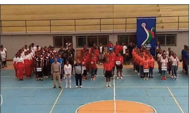
Handball « Minimes » sy « Juniors » any Fianarantsoa.

Any Fianarantsoa no hanatanterahana ny ny « Championnats nationaux 2022 de « Hand ball » sokajy « Minimes » sy « Juniors » ka notanterahina tao amin'ny kianja mitafon'Ambatomena, tamin'ny asabotsy 20 aogositra 2022 lasa teo, ny fanokafana ara-pomba ôfisialy an'izany. Efa nanomboka tamin'ny alakamisy 18 aogositra 2022 lasa teo kosa ny fifaninana ka haharitra hatramin'ny sabotsy 27 aogositra 2022 ho avy izao ary miditra amin'ny andro faha-6 ny fifaninana