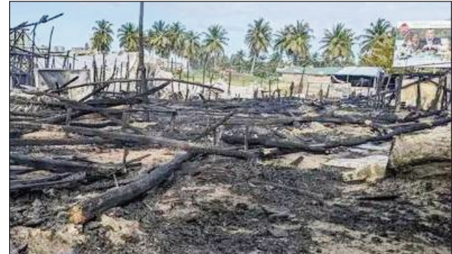
Ireo trano may kilan'ny afo tany Toamasina.