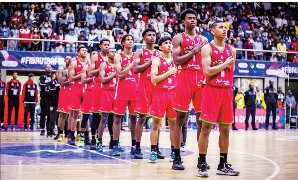
Ny Ankoay an'i Madagasikara sokajy zazalahy.