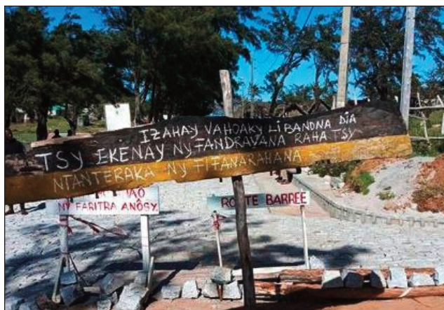
Sora-baventy ataon'ireo mponina any Libanona, tsy manaiky ny hanesorana azy ireo amin'ny taniny.

trahan'ny olana, satria tsy manaiky izao amboletra atao amin'izy ireo izao ireto olona ireto. Voalaza fa hametrahana fibre optique no niatombohan'ny tetikasa dia izao lasa projet présidentiel na tetikasan'ny filohampirenena izao no niafarany. Mampiaka-peo ny any an-toerana noho izany, fa angaha lasa mpiara-miombon'antoka amin'ny Karana hoy izy ireo ny fiadidiana ny Repoblika? Tantara hitohy!