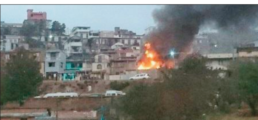
Ny toerana nisy ilay trano may teny Ambohipo.

Taitra vao maraina ny teny Ambohipo Boriboritany faha-2 eto Antananarivo Renivohitra ny alahady teo, nisy fipoahana mahery vaika teny an-toerana tamin'io fotoana io, nisy trano nirehitra noho ny fipoahana entona fandrehitra na gaz. Araka ny fanadihadiana sy ny nambaran'ny mponina manodidina, gaz tsy nihidy tsara no nahatonga ny fipoahana. Samy nisomebiseby namonjy ilay trano may ny mponina manodidina mba tsy hiitaran'ny afo, izay nahiana ho niitatra noho ny fahamaizana be.