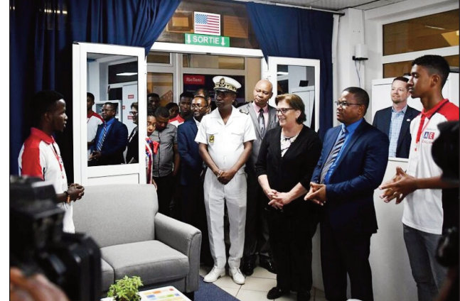
Ny fanokafana tamin'ny fomba ofisialy, ny American Corner nohavaozina any Fort-Dauphin.