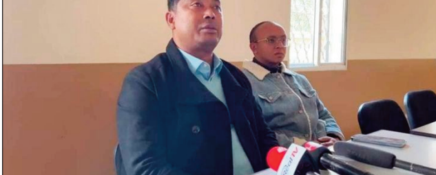
Ny mpisolovava ilay sefo fokontany (ankavia).

Manoloana ilay raharaha fanambanana basy sy antsy nataon'ny depiote Naivo Raholdina ilay sefo fokontany, mitondra fanazavana ny mpisolovava nity sefo fokontany ity.