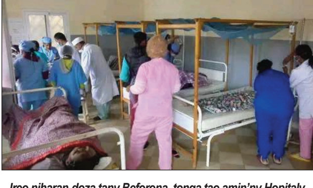
Ireo niharan-doza tany Beforona, tonga tao amin'ny Hopitaly.

Nisehoana loza mahatsiravina tany Beforona distrikan'i Moramanga, faritra Alaotra Mangoro omaly. Olona maromaro no namoy ny ainy tamin'izany araka ny vaovao voaray. Tany anelanelan'i Beforona, sy Marovoalavo no nitrangangan'izao lozam-pifamoivoizana izao, vokatra ny fandehanana mafy. Tamin'ny fotoana nanoratana, olona 08 no maty, 12 naratra mafy. Omaly tokony ho tamin'ny 10 ora maraina teo, tany Marovoalavo kaominina Beforona, taxi-brousse ni-