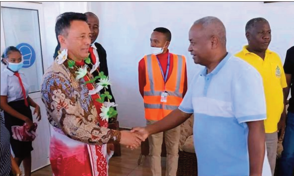
Ny filoha Marc Ravalomanana, nihaona tamin'ny mponin'Antsiranana tao Bazary ny sabotsy teo ihany.